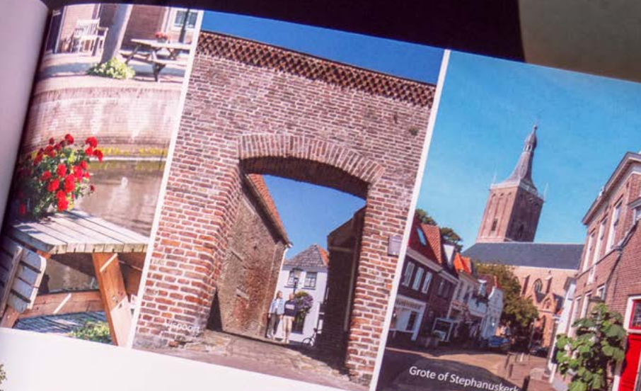
Grote of Stephanuskerk