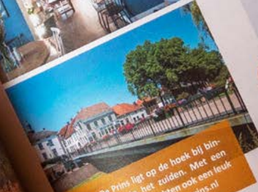
Restaurant De Prins ligt op de hoek bij binnenstad van het stadje in het zuiden. Met een sfeerfuller en heerlijke gerechten ook een leuk plekje om te dineren. www.restaurantdeprins.nl