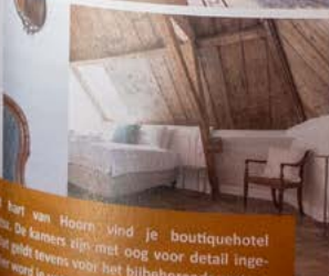
...het hart van Hoorn vind je boutiquehotel ... De kamers zijn met oog voor detail ingericht. Het geldt tevens voor het bijbehorende restaurant. Het woord je verwand. www.ybrantsz.nl