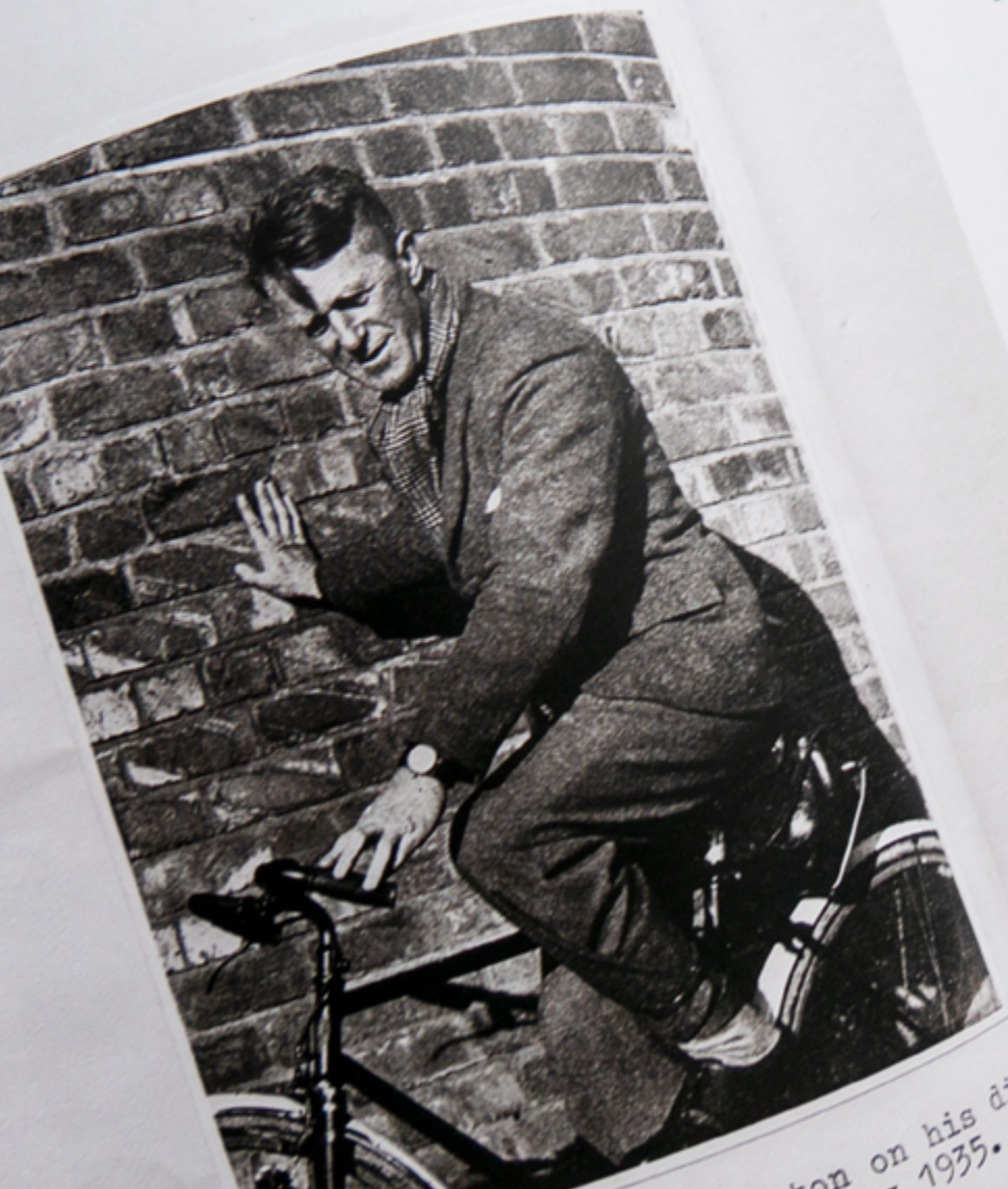
...on on his bicycle 1935.

Een belangrijke uitdaging voor de Britten was om potentieel rebellerende gebieden, door de Ottomanen bezette gebieden, Lawrence had een belangrijke rol gespeeld in het Nabije Oosten. Lawrence had een belangrijke rol gespeeld in het Nabije Oosten. Lawrence had een belangrijke rol gespeeld in het Nabije Oosten. Lawrence had een belangrijke rol gespeeld in het Nabije Oosten.