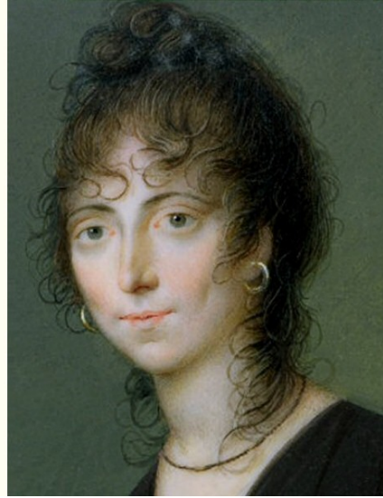
De ouders van Napoleon: Carlo Bonaparte en Letizia Ramolino

Ook de familie Buonaparte tekende voor de amnestie. Nee, Buonaparte is geen schrijffout. Napoleons ouders waren van verre adellijke Toscaanse komaf en ze spraken Italiaans en ze hadden een Italiaanse familienaam: Buonaparte (met een u). Napoleons vader Carlo (1746-1785) was in zijn jonge jaren actief in de Corsicaanse vrijheidsstrijd en was bereid om hier offers voor te brengen maar uit opportunisme koos hij op het juiste moment de kant van de Fransen. De jonge Carlo was juridisch geschoold en dankzij de amnestie kon hij als advocaat gaan werken bij het plaatselijke gerecht. Carlo trachtte als fervent gokker en verkwister voortdurend middels gerechtelijke procedures land en geld te verkrijgen. Het lukte hem om goede betrekkingen en zelfs allianties te smeedden met de Franse functionarissen op het eiland waaronder niet de minste: de gouverneur van het eiland, graaf van Marbeuf, die erg onder de indruk was van Napoleons moeder, Letizia.