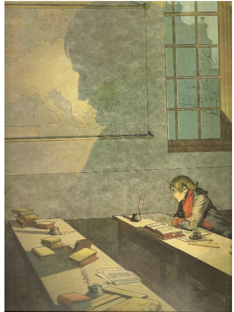
Napoleon op de militaire school te Brienne

Eerst moesten de broers Frans leren en hiervoor ging Napoleon op negenjarige leeftijd eerst enkele maanden naar een voorbereidingschool in Autun. Om zijn moeder financieel te helpen, nam hij zijn twee jaar oudere broer Joseph bij zich en bekommerde zich om diens opvoeding. Het is opvallend dat Joseph onder toezicht kwam van zijn jongere broer maar als je broertje Napoleon Bonaparte heet, hoef je je daarvoor natuurlijk niet te schamen. Joseph was – hoewel jaloers – in zijn latere leven trouw aan Napoleon en was in de regel bereid alles te doen wat hij van hem verlangde.