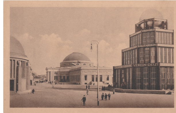
Ansichtkaart met rechts Monument van IJzer op expositie Leipzig 1913

De expositie kreeg in Nederland veel aandacht en werd in verschillende architectuurbladen uitgebreid aangekondigd. Er waren ook Nederlandse architecten die de expositie bezochten. Architect Joan van der Meij, die toen samen met Michel de Klerk en Piet Kramer bezig was met het ontwerp van het beroemde Scheepvaarthuis in Amsterdam, is er in ieder geval geweest. Hij moet nogal onder de indruk geweest zijn van het Tauts ontwerp, want hij zond twee ansichtkaarten naar Nederland met daarop het Monument van IJzer. 18