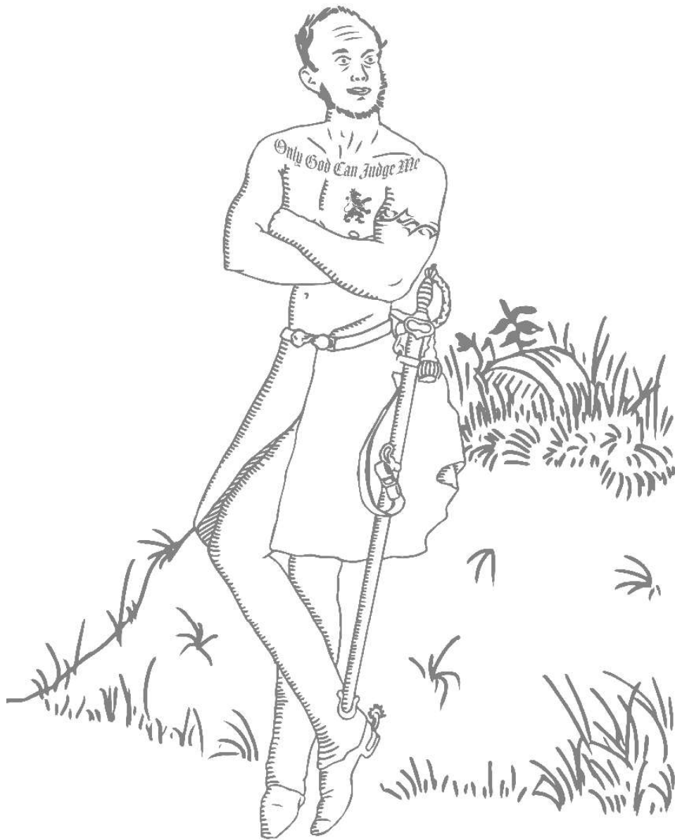
FIG. 72 TATTOO WILLEM II Willem II liet een tattoo zetten ter viering van zijn koninklijke onschendbaarheid

ministeriële verantwoordelijkheid. Door politici verantwoordelijk te maken voor het te voeren beleid werd de macht van de koning aanzienlijk ingeperkt.