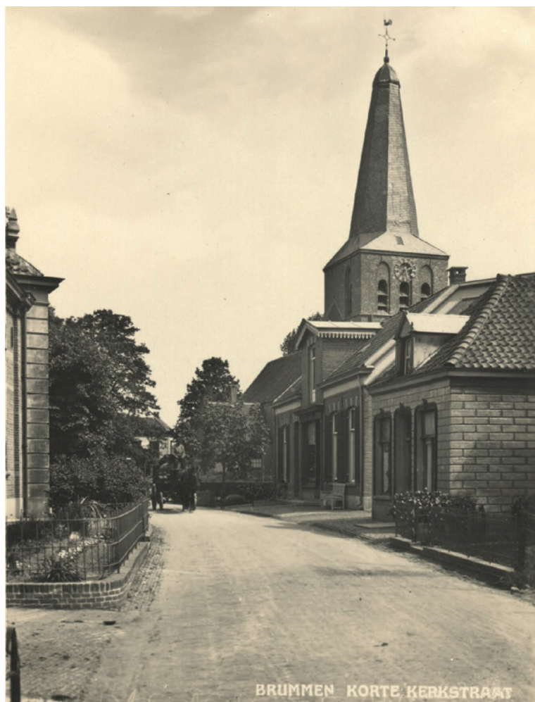
Korte Kerkstraat - Marten Putstraat ca. 1930. Links is nog net een stuk van het nieuwe gebouw zichtbaar.

Concordia, het statige gebouw aan het begin van de Engelenburgerlaan; Concordia, al generaties bekend van de optredens, het kegelen en de kermisfeesten; Concordia, het café en zalencentrum. Bij dat alles zouden we bijna vergeten dat de opdrachtgever van de bouw van het huidige Concordia de gelijknamige heren-sociëteit was. En dat die sociëteit al lang en breed een begrip in het dorp was toen er op die plek aan de Engelenburgerlaan alleen nog de boswachterswoning van Groot Engelenburg stond. Die voorgeschiedenis, het verhaal van de groep mannen 'uit den hooger stand', die in de jaren 1860 het initiatief nam, de sociëteit Concordia op te richten, is het onderwerp van het eerste hoofdstuk van dit boek.