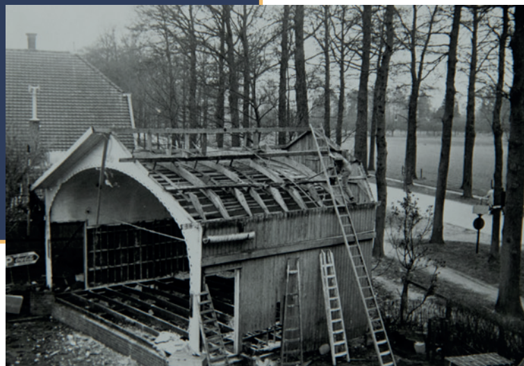
Afbreken van muziekkoepeel

In die tijd, op de Wilhelmina-school, heb ik elk jaar drie planten thuis verzorgd (met koemest) voor de Floralia tentoonstelling. Dit leverde vaak een prijs op.