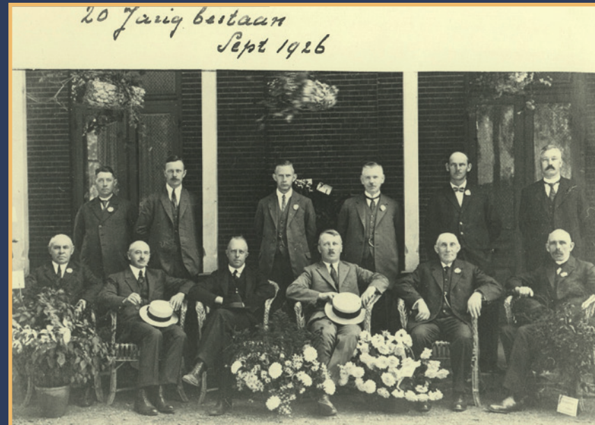
20 jaar Floralia