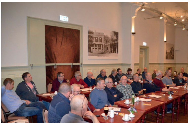
Vergadering het St. Jans-Gilde in Concordia.