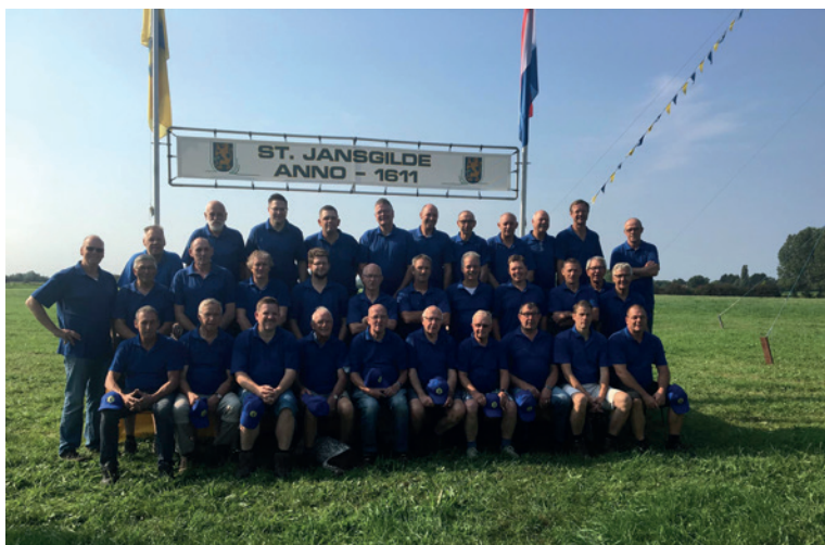
Het St. Jans-Gilde op de Vogelwei. 2019

Op de avond na de kermis was er altijd een buffet voor alle bestuursleden van het gilde en de vrijwilligers die meehielpen op de vogelwei in Concordia. Het café was niet altijd de thuisbasis voor het Sint Jans-Gilde, er was in de jaren '50 een tijd dat er wel vergaderingen bij Kromhout of bij het café van Bé Willems aan de Arnhemsestraat waren, maar die werden toch als te klein beoordeeld. Vanaf eind jaren '50 is het centrale punt voor het Sint Jans-Gilde steeds Concordia geweest. Iedereen in het dorp nam vroeger ook vrij die kermismaandag. Het gemeentehuis ging dicht, de scholen waren dicht. "Je had geen keus, je ging erheen, want het was kermis" zegt een trouwe kermisganger. Dat was soms wel lastig voor mensen met werk buiten Brummen, er was op kermismaandag geen kinderopvang bijvoorbeeld.