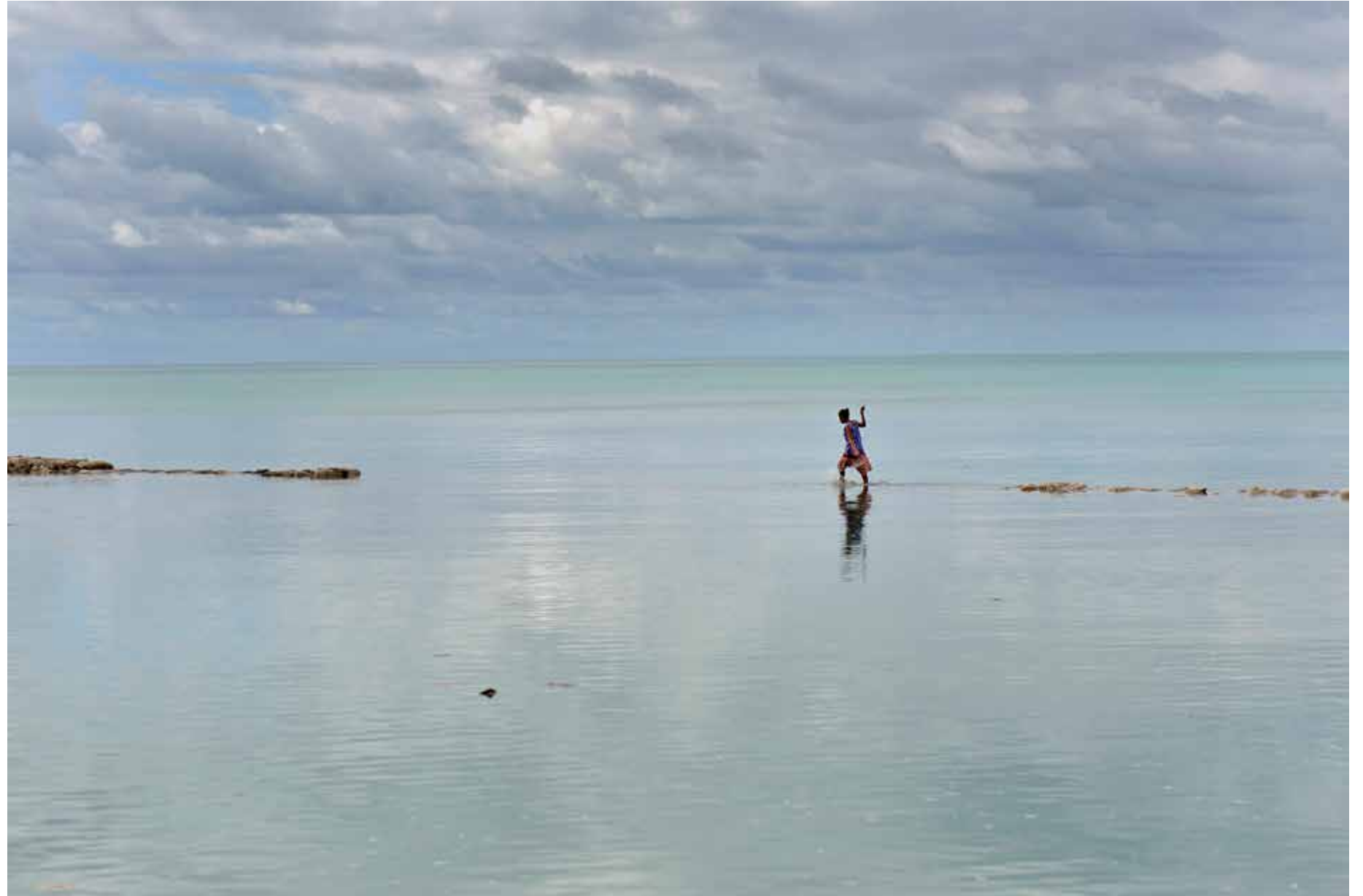
Een mislukte poging om land te heroveren in de lagune van Tarawa, Kiribati.