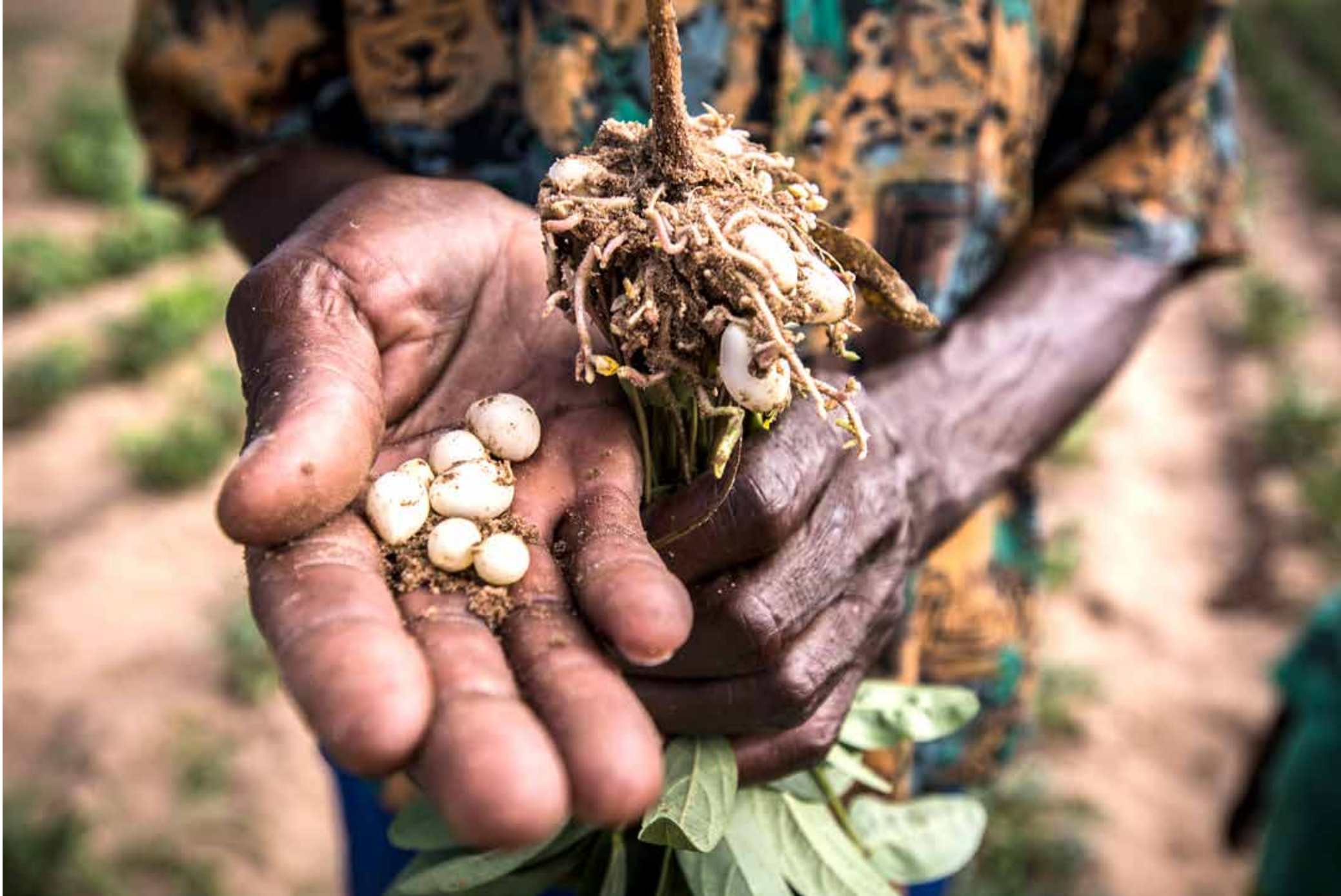
Zaden van de pindaplant. Zimbabwe.