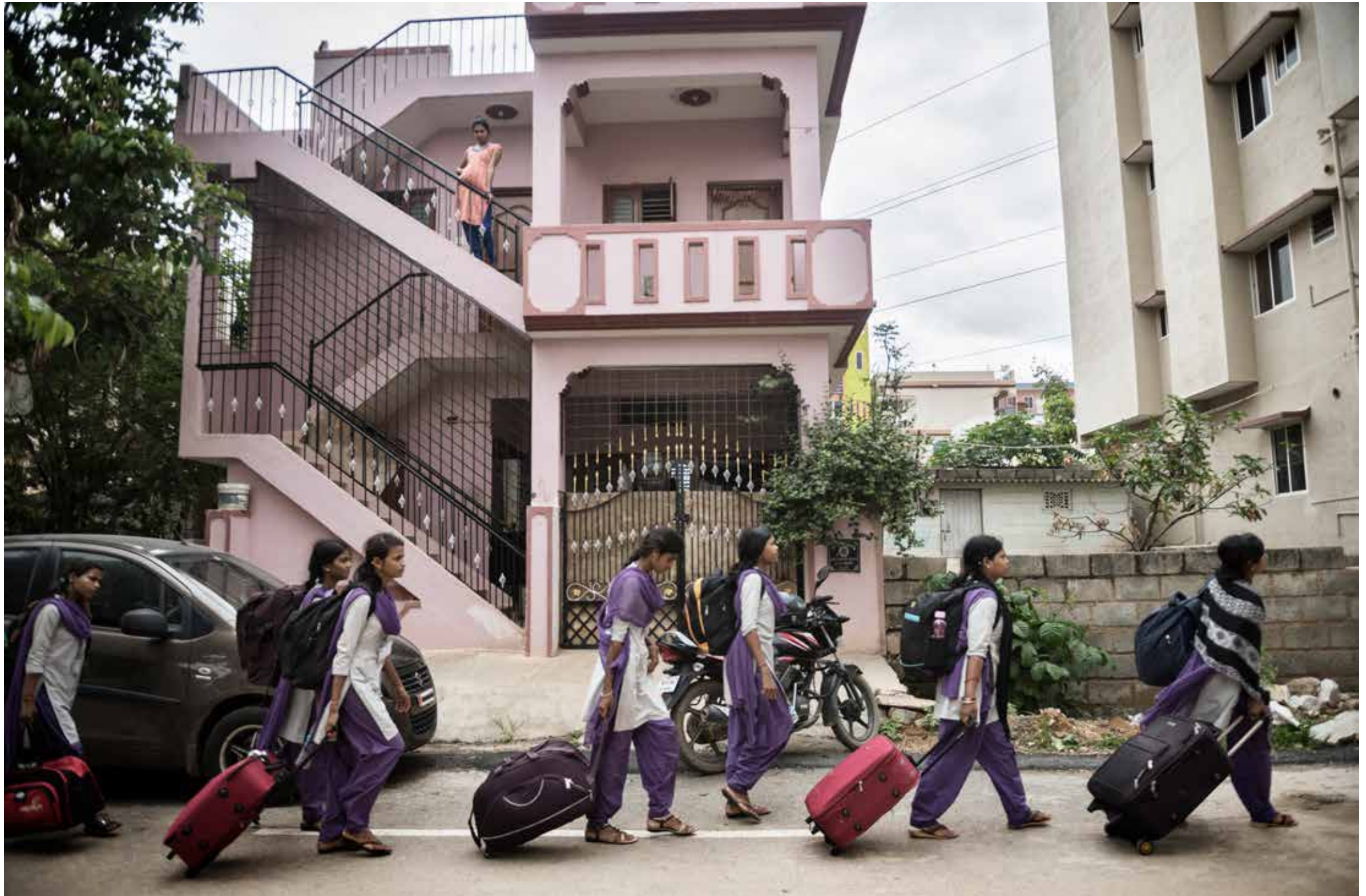
De jonge fabrieksarbeiders betreden hun nieuwe woonwijk en residentie in Bangalore, India.