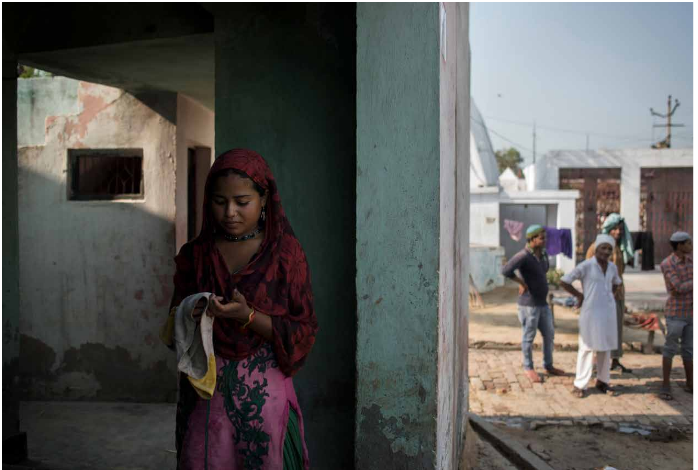
Sharda behoort ook tot de vrouwen die verstoten zijn door het doorgaan met het verrichten van betaald werk. Peepli Khera, India.