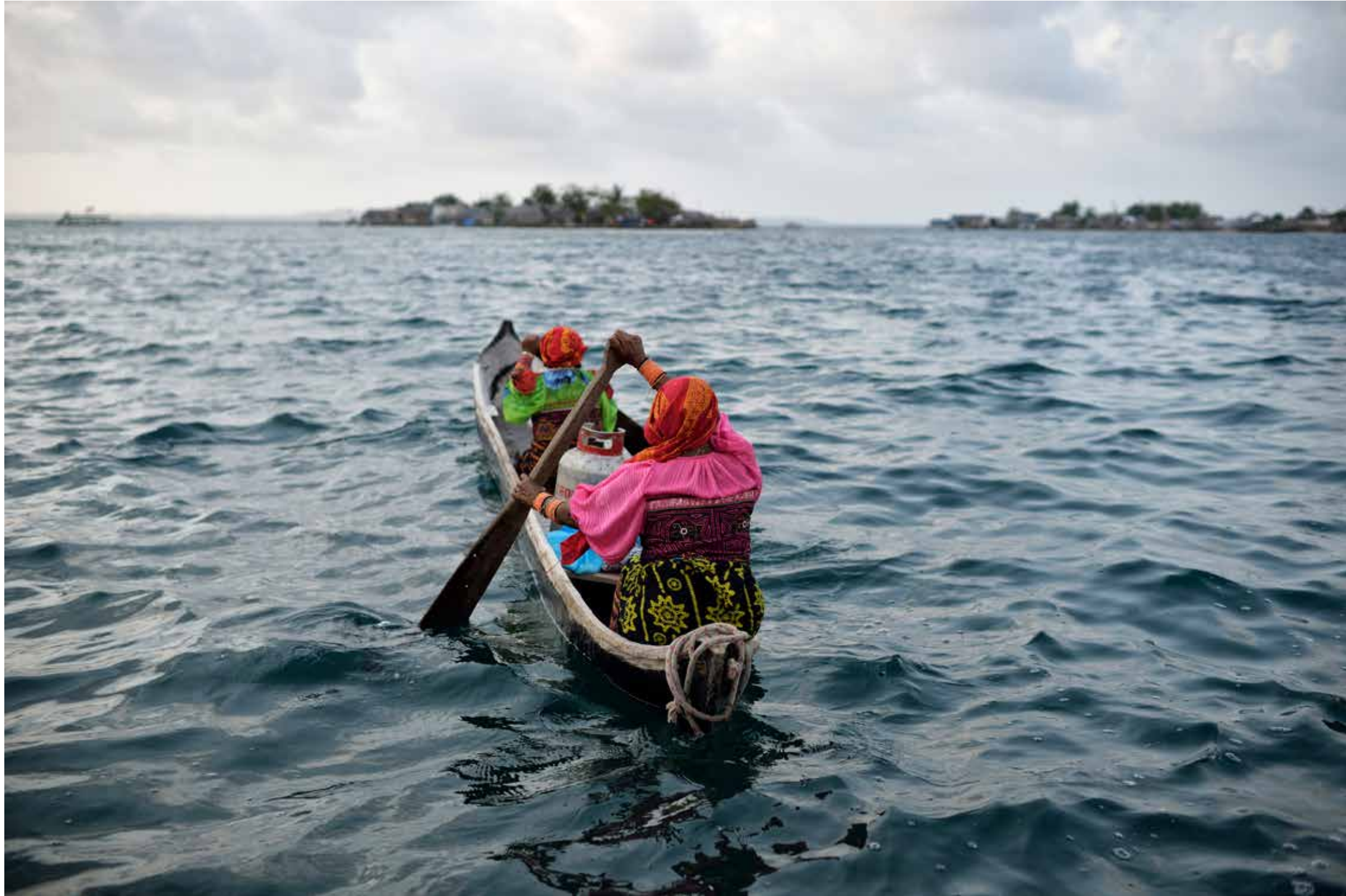
Vrouwen halen flessen gas bij Carti Sugdup om te kunnen koken, Guna Yala, Panama.