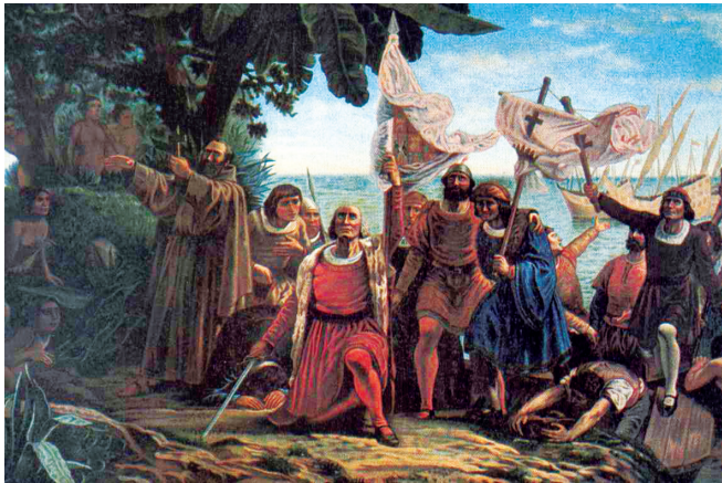
Columbus stapte voor het eerst op Amerikaanse bodem. Geromantiseerd schilderij van de Spanjaard Dióscoro Teófilo Puebla Tolín uit 1862.

slapen dan meestal in de tambo, en de meisjes en vrouwen uit het dorp moeten hen bedienen. Haar broer Ninan, die een paar jaar ouder is, is gestationeerd in de tambo als chasqui, oftewel renbode. Hij krijgt gesproken boodschappen of quipu's - ingewikkelde stelsels van touwen en knopen - mee om die op twee uur rennen over het schitterende wegensysteem door te geven aan de volgende chasqui. Zo kan een boodschap binnen een paar dagen door het hele rijk reizen. Haar vader is gepensioneerd veteraan in het leger van de sapa inca, en kan eindeloos vertellen over de grote zee en de woeste krijgers aan de randen van het rijk.