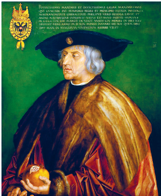
Portret van Maximiliaan, de machtigste man van Europa, in zijn laatste levensjaar, door Albrecht Dürer uit 1519.