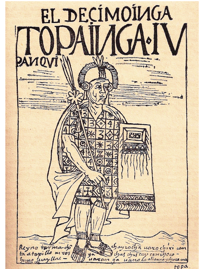
Portret van Túpac Inca Yupanqui, heerser over het Inca-rijk in 1492, door Felipe Guamán Poma de Ayala (ca. 1535 - 1616), uit het boek 'El primer nueva corónica y buen gobierno' uit circa 1615.

Kushirimay is ongeveer net zo oud als Aagje en behoort tot de leeftijdscategorie van de Corotasque: jonge meisjes die hun ouders helpen bij het hoeden van de llamakuddes, weven, koken en alle lichte werkzaamheden. Er is geen school in het dorp Capachica, maar alle jonge mensen krijgen les in Quechua, de lingua franca van het Inca-rijk. Kushirimay spreekt met haar dorpsgenoten Aymara. Kennis van Quechua is noodzakelijk om de vertegenwoordigers van het rijk te woord te staan wanneer deze het dorp aandoen.