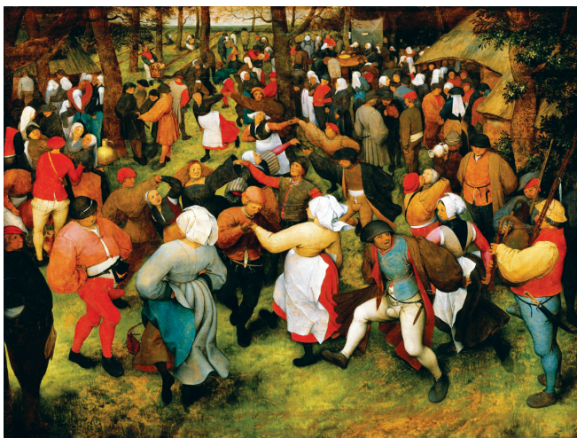
De Bruidsdans, schilderij van Pieter Bruegel de Oude, uit 1566 geeft een beeld van het dagelijkse leven in de Renaissance.