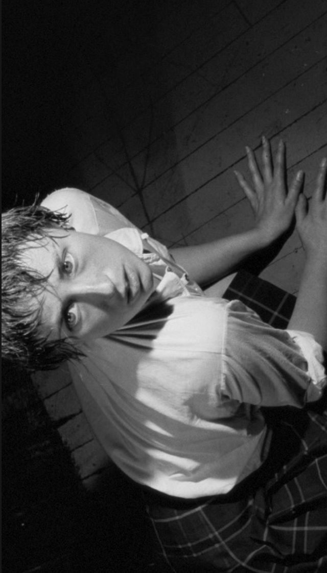
Zonder titel nr. 92 Cindy Sherman 1981

Het gaat niet altijd om vreemde camerahoeken. Vaak zal je visuele instinct je vertellen dat je moet kiezen voor een meer neutrale hoek, zodat de toeschouwer op gelijke hoogte staat met je onderwerp. Er zijn enkele vuistregels. Als je alleen het hoofd fotografeert, moet je camera zich ter hoogte van het neuspuntje van je onderwerp bevinden. Als je iemand voor driekwart fotografeert, kies je positie ter hoogte van de borst. Als je mensen in hun volle lengte weergeeft, fotografeer je hen ter hoogte van hun middel.