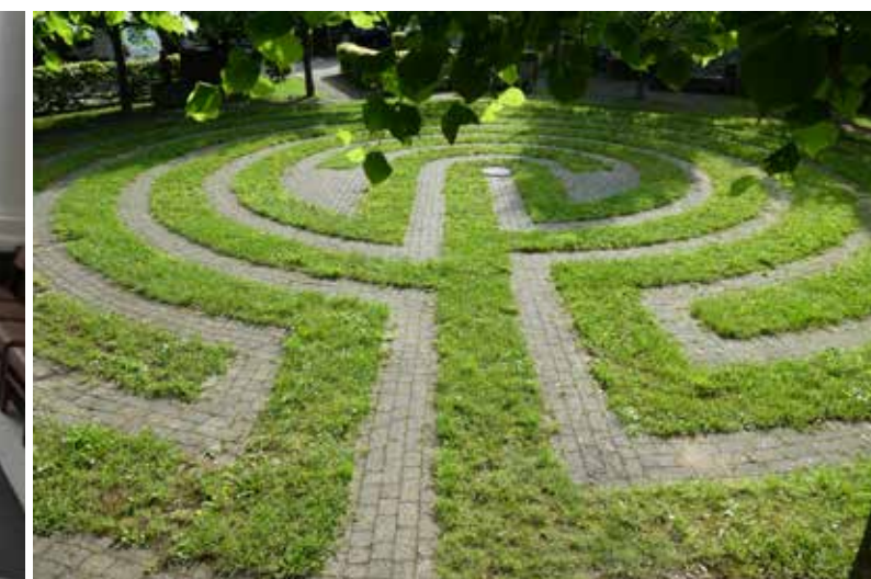
Villers Sint Gertrude