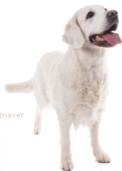
De Golden Retriever AANSCHAF

Ben je vooral op zoek naar 'slechts' een gezellige huisgenoot of heb je ook show- of fokambities? Of lijkt het je juist leuk om lekker fanatiek met je Golden Retriever aan jacht(trainingen) of andere activiteiten mee te gaan doen? Binnen een ras heb je vrijwel altijd met verschil in type te maken. Dat geldt ook voor de Golden Retriever. Er zijn fokkers die primair selecteren en fokken op werkeigenschappen, maar er zijn er ook die zich meer op bepaalde karaktereigenschappen of uiterlijke raskenmerken richten. Als je serieus overweegt om met je Golden Retriever te gaan showen, fokken of om bijvoorbeeld aan jachthondenwedstrijden te gaan deelnemen, dan doe