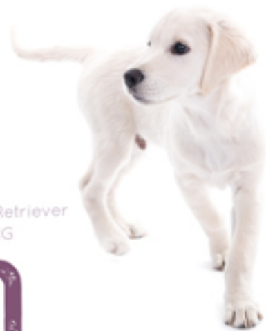
De Golden Retriever VERZORGING

Zo'n prachtige vacht als die van een Golden Retriever vergt wel enig onderhoud. Op de vacht na is het een ras dat relatief weinig verzorging nodig heeft.