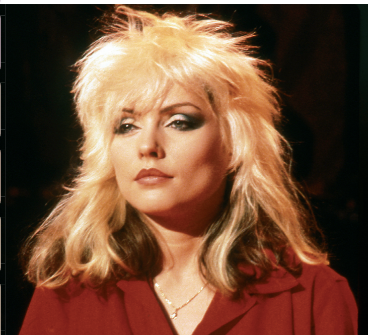
Blondie archief: Gentile Look - Chris van de Vooren

Eat To The Beat van Blondie wordt op 27 september 1979 uitgebracht. De LP bereikt de vijftiende plaats in de Nederlandse LP Top 50. Op