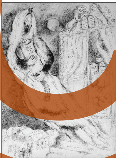
Marc Chagall Rabbi Akiba , 1947

volgen. Maar Mozes kon de discussies niet begrijpen en hij was zeer teleurgesteld. Maar toen hoorde hij de leerlingen over een bepaald onderwerp aan hun meester vragen: Hoe weet je dat? En hij antwoordde: Dit is een wet die aan Mozes gegeven is op de Sinai, en Mozes was getroost. Daarop keerde Mozes terug naar de Heilige – hij zij geprezen – en zei: Eeuwige der wereld, je beschikt over zo'n man en je geeft de Thora aan Israël door mij! Maar God antwoordde: Zwijg, want dit is mijn besluit. Toen zei Mozes: Eeuwige der wereld, jij hebt me toegestaan zijn lessen bij te wonen, laat mij de beloning zien die voor hem is weggelegd. Keer je om en zie, zei de Eeuwige en Mozes keerde zich om en zag hoe de Romeinen het vlees van de martelaar Akiba verkochten op de markt. Eeuwige der wereld, riep Mozes, is dit de beloning voor dergelijk onderwijs? En de Eeuwige antwoordde: Zwijg, want dit is mijn besluit. 27