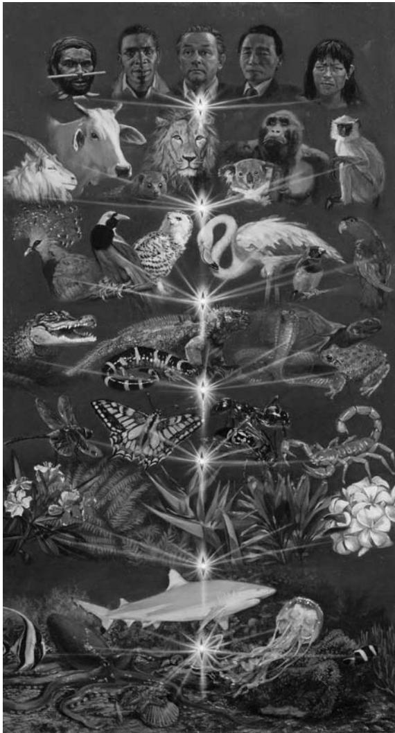
De evolutie van de ziel, reizend door de 8.400.000 verschillende levensvormen.

Het is een omhulsel dat om de ziel heen zit als een kledingstuk, vandaar het woord lichaam, likhaam, lijkhemd. (Van Dale etymologisch woordenboek)