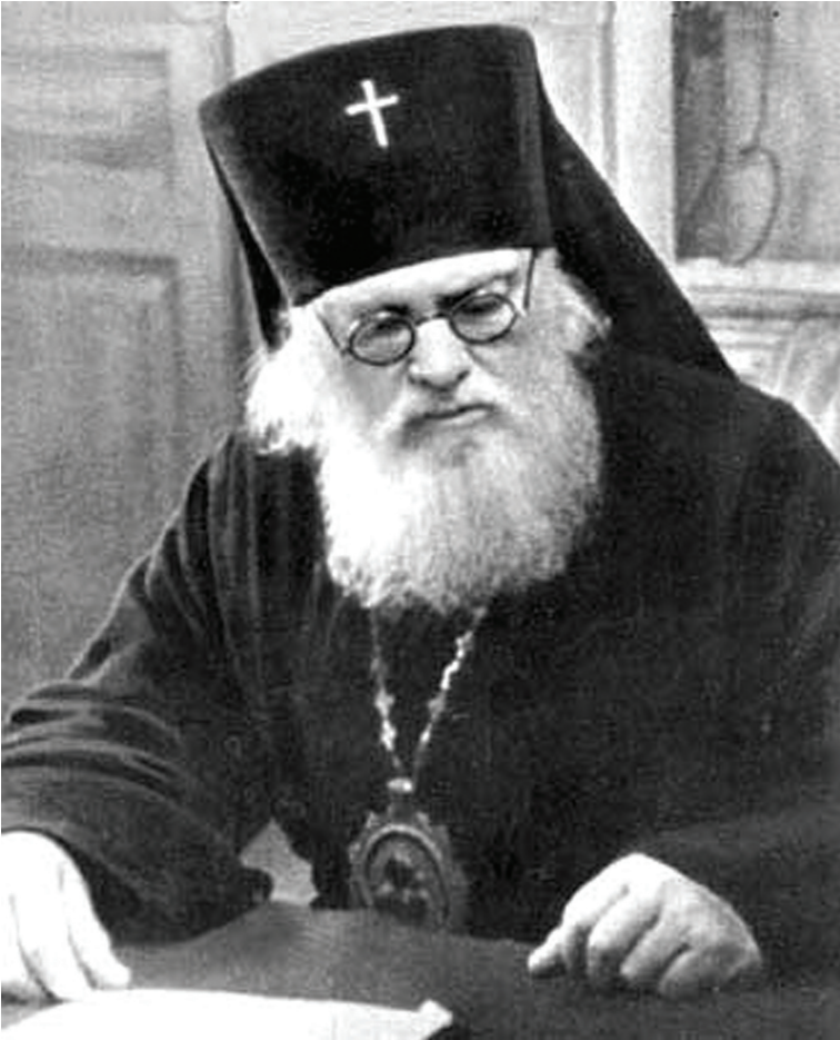
Heilige Lucas de Belijder, Aartsbisschop van Simferopol en Krim