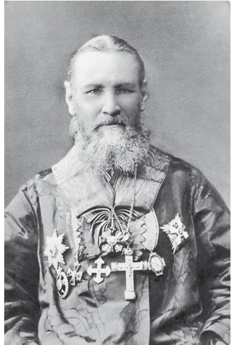
Heilige Johannes van Kronstadt

Aartspriester Johannes van Kronstadt (Sergieff)