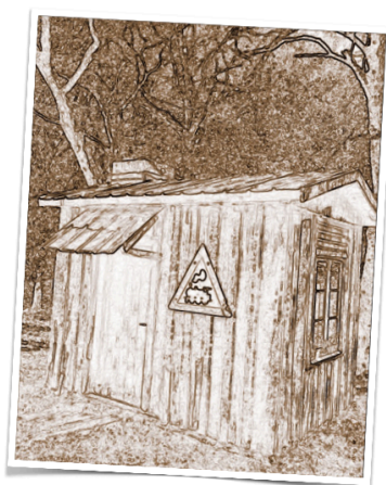
Schuurtje achter in de tuin