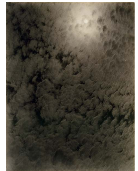
Links: Paul Strand, Abstraction, Porch Shadows, Twin Lakes, 1916. Rechts: Alfred Stieglitz, Equivalent.