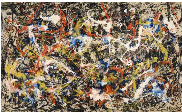
Jackson Pollock, Convergence, 1952.