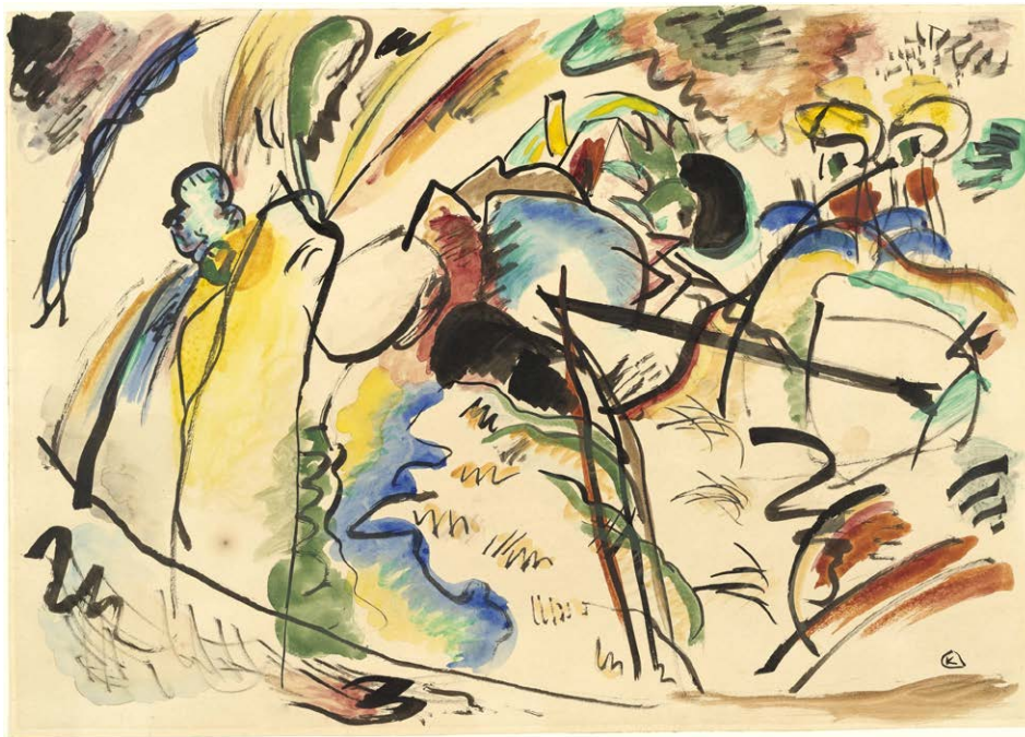
Kandinsky, Zonder titel, 1910-1913.