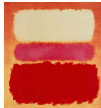
Mark Rothko, White Cloud over Purple, 1957.