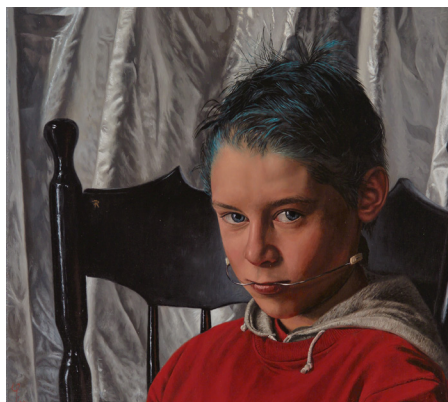
Blue Hair & Braces , 40 x 45 cm, 1998 Menena Joy Schwabe Award, Mall Galleries National Portrait Gallery London

In 2008, 2010, 2015, 2017, 2019 and 2022 Heldens' work was selected by the European Museum of Modern Art (MEAM) in Barcelona, with a 'honorable mention' in 2015; in 2021 his painting 'Squatter Jesus' was selected for the MOD Portrait exhibition, also at MEAM. In