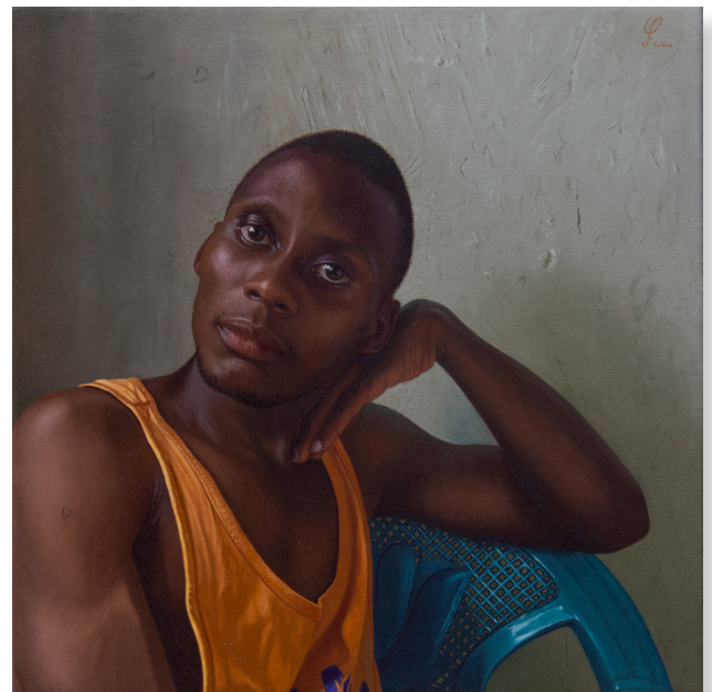
His Royal Highness , 45 x 45 cm, 2021