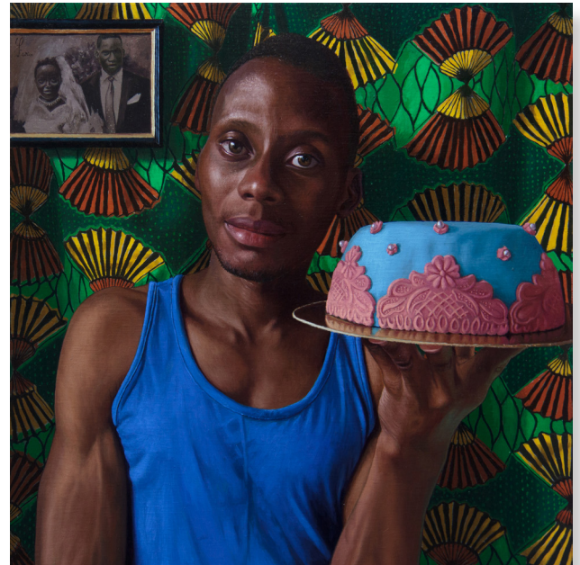
The Icing on the Cake , 45 x 45 cm, 2021

Jajja is selected for Modportrait Exhibition 2022, Zaragoza, Spain