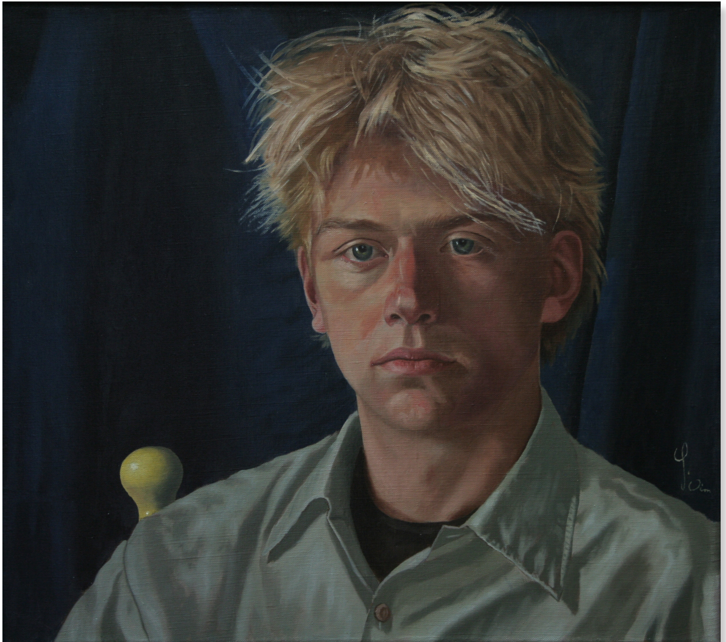
Antonie, 40 x 45 cm, 1990