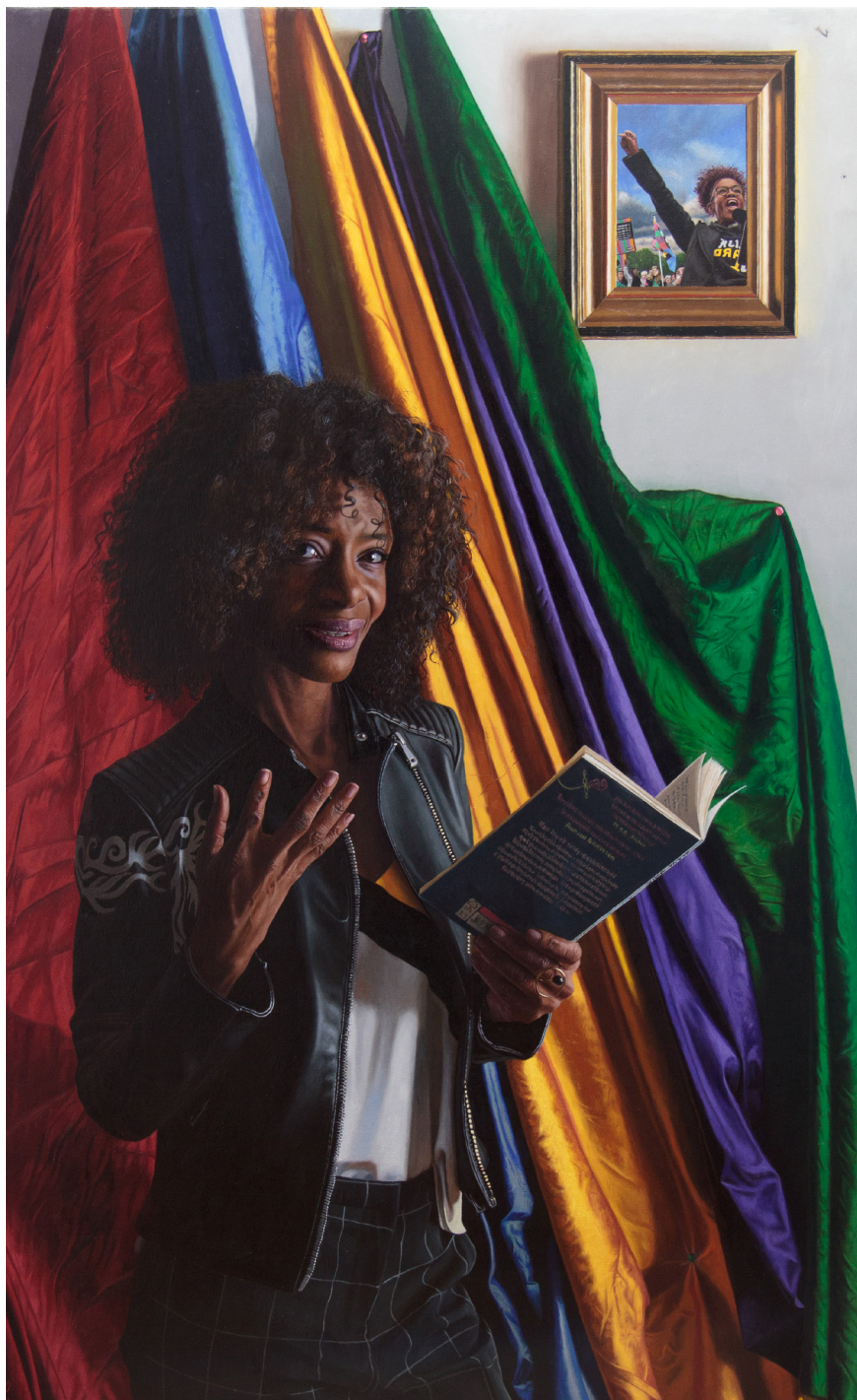
Still I Rise, 130 x 80 cm, 2021

This is a kind of colourful 'state portrait' of a well-known politician, leader of the anti-racism party Bij1, which advocates a reform of social structures which fail to prevent serious discrimination. Because she will clearly ventilate her opinions, and is a forthright defender of human rights and the rights of minorities, she meets a lot of resistance, which makes her role in Dutch politics all the more visible. Her role in various emancipation processes is symbolized by the rainbow colours in the background, almost dominating the canvas; Simons is 'caught' in one of her eloquent speeches for which she is famous. The mirror shows one of the demonstrations in which she has taken part. The title of the painting is taken from the well-known poem by Maya Angelou, an inspirational hymn about the plight of the down-trodden.