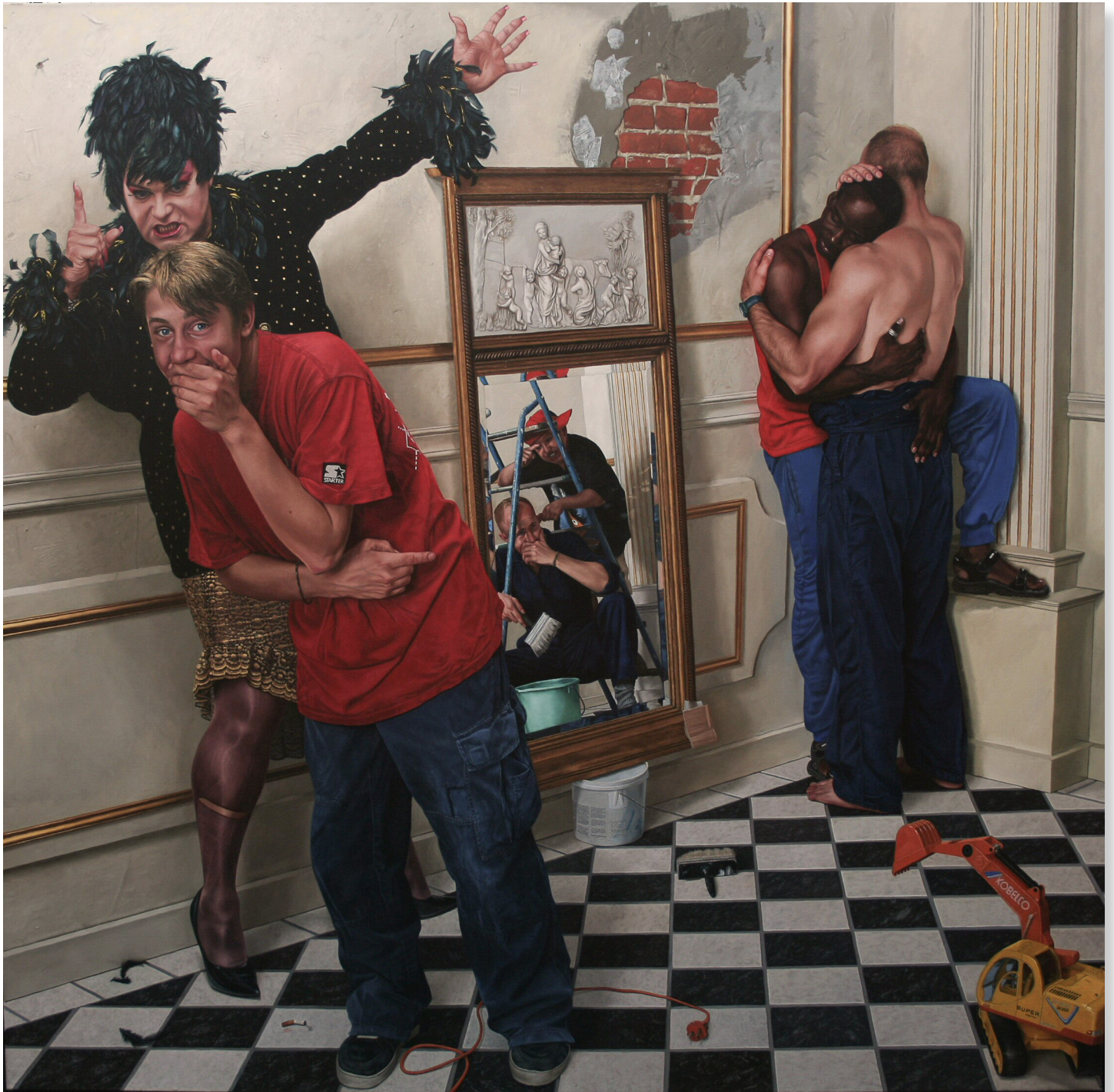
The Mirror, 200 x 210 cm, 2000/2001