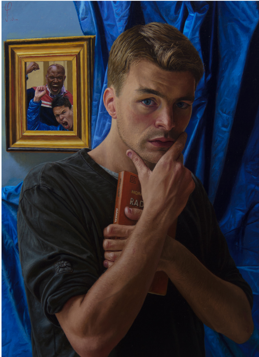
Weltschmerz, 65 x 45 cm, 2016