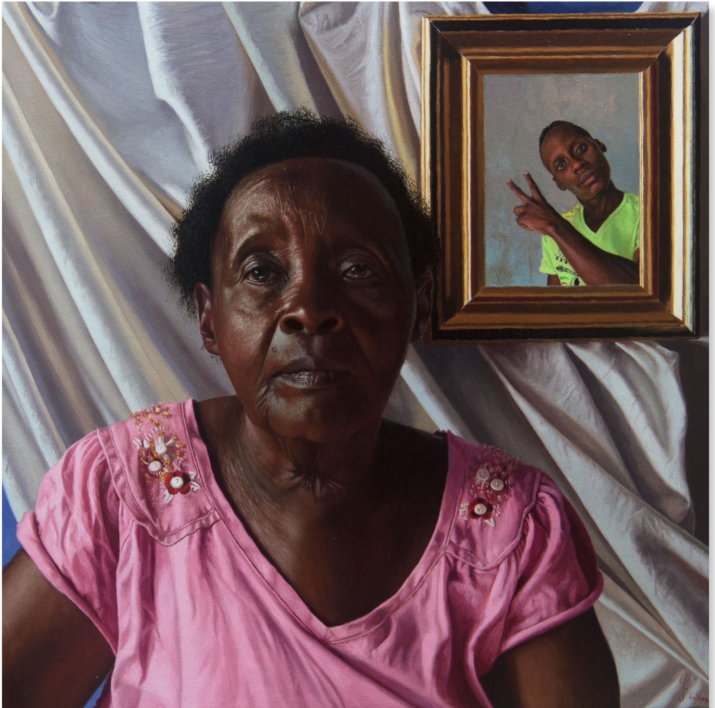
Jajja (Grandmother), 45 x 45 cm, 2021