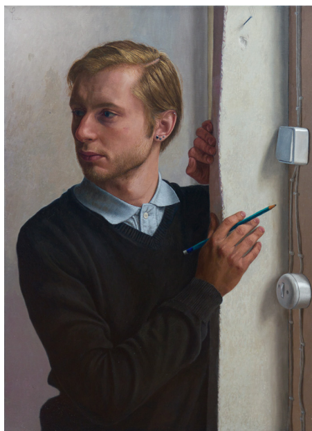
Distracted , 75 x 55 cm, 2011 First Prize BP Portrait Award 2011 National Portrait Gallery London

Afrikaanse vrouw 'Jajja' geselecteerd voor de MOD Portrait Exhibition in Zaragoza in 2022, waarna het te zien zal zijn in het MEAM in Barcelona.