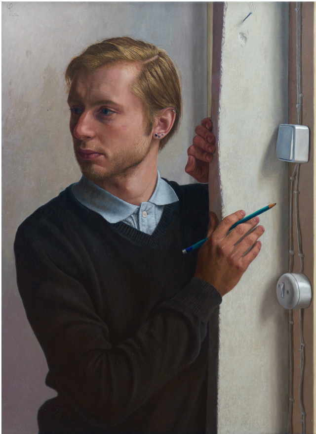
Distracted , 75 x 55 cm, 2011

Collectie National Portrait Gallery, London, United Kingdom