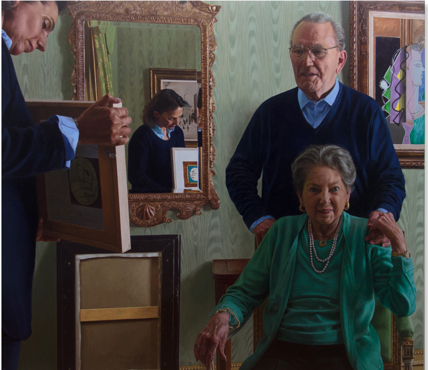
The Collectors, 125 x 140 cm, 2017