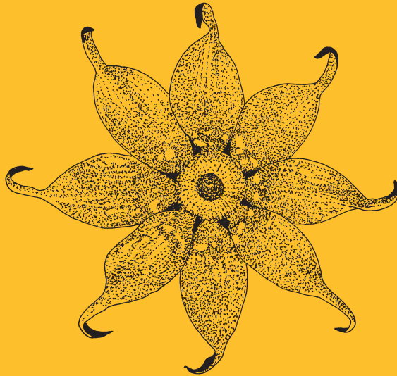
– Clematis –

De mens wordt zich bewust van zijn goddelijke afkomst, verlegt het zwaartepunt van zijn leven door zijn 'ik' over te geven. Het Corpus Hermeticum bevat hulp en onderricht voor de mens die hunkert naar het goddelijke veld, want een ontwakende heeft kracht en begeleiding nodig. Toch zijn de gesprekken van Hermes aanwijzingen voor het 'ik' en voor de ziel; de innerlijke weg bewandelen dient de mens zelf te doen. Ware geestelijke verlichting kan niet uit boeken worden geleerd. Inwijding kan alleen in het hart van de mens gerealiseerd worden door de ziel.