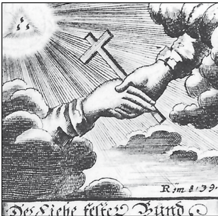
Gravure 2. De hechte band van de Liefde