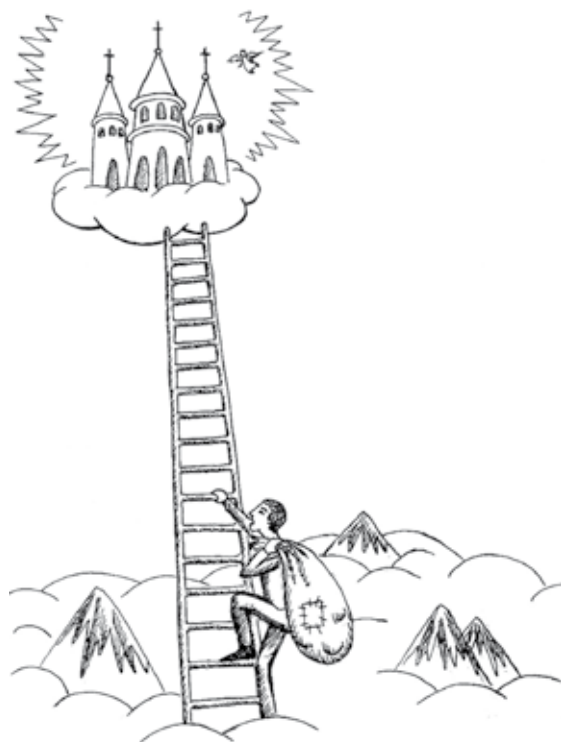
Illustratie 2. Bewust, verticaal lijden

En deze twee moeten goed uit elkaar gehouden worden, anders lijdt je een heel leven lang voor niets. Bijvoorbeeld: een vrouw lijdt, omdat haar man drinkt en haar slaat en ze blijft tegen zichzelf zeggen: 'ik moet het verdragen, dat is mijn lot'. Dit is mechanisch , nutteloos lijden en leidt alleen maar tot de vernietiging van de persoonlijkheid. Jullie moeten een onderscheid maken tussen nutteloos, horizontaal lijden en bewust lijden, dat tot verlichting voert. Horizontaal lijden maakt je karma alleen maar zwaarder en leidt tot verlies van kracht en wil, het leidt tot totale achteruitgang. Zie illustratie 1. Bewust lijden herinnert ons aan het Pad, het schakelt ons over van de horizontale naar de verticale tendens. Onbewust lijden leidt nergens toe, het is nutteloos. En als jullie het Pad volgen en hindernissen nemen, zal dit lijden je verheffen. Horizontaal lijden doet zich