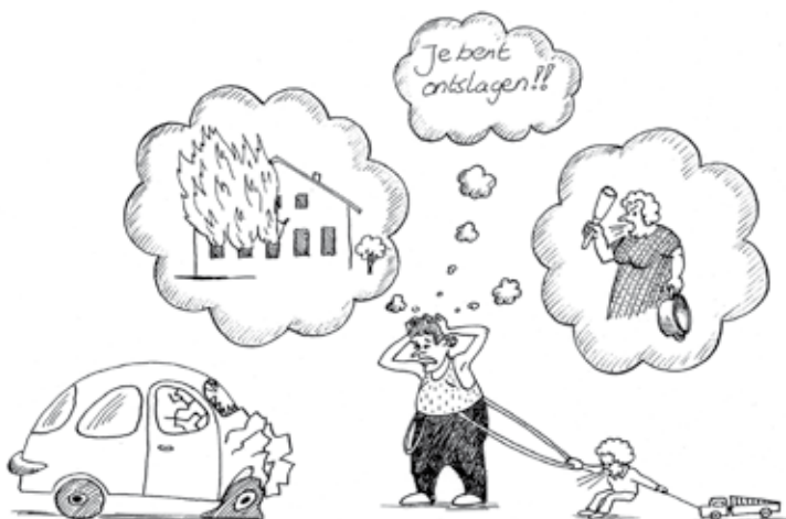
Illustratie 1. Onbewust, mechanisch, horizontaal lijden

‘Als een leerling op het Pad,’ antwoordde G, ‘bewust innerlijke pijn doorstaat, dan is dat bewust lijden. Pijn ontstaat door een botsing van de werkende zelve n met de chaotische zelve n. Als de leerling psychische pijn doorstaat, past hij de methode van bewust lijden toe. Maar als hij lijdt door het feit dat hij het nieuwste model van een bepaalde auto niet kan kopen, raakt hij alleen maar achterop.’