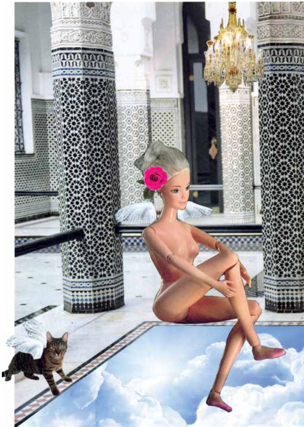
Lights go down in the moment, we're lost and found. I just wanna be by your side, if these wings could fly. 4