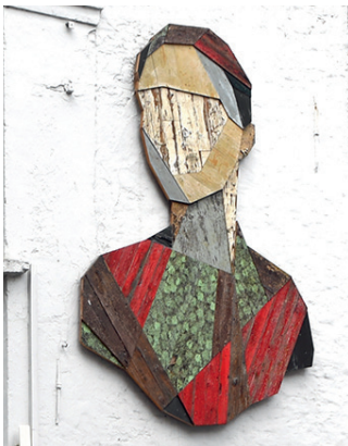
● Vrouw kijkt naar 't Zand, Stefaan De Crook (Strook)

van Stefaan De Crook (Strook), is de houten sculptuur aan de gevel van 't Santpoortje, hoek Noordzandstraat met de Speelmansrei.