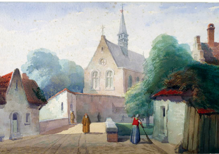
● Kapel van de kapucijnen, Legendre 1850

Het zuidelijk deel van 't Zand, het Groene genaamd, werd in 1617 geschonken aan de paters