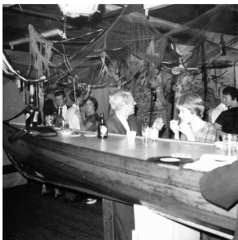
1.4 Aan de bar (de Zuipschuit) in de sociëteit aan de Lauriergracht op de tweede verdieping van een voormalig Amsterdams pakhuis

Op de tweede verdieping was onze sociëteit. De kratten bier en frisdrank werden opgehesen met behulp van een touw en katrol, bevestigd aan de verhuisbalk boven aan de gevel van het pakhuis. Dat hijsen scheelde een