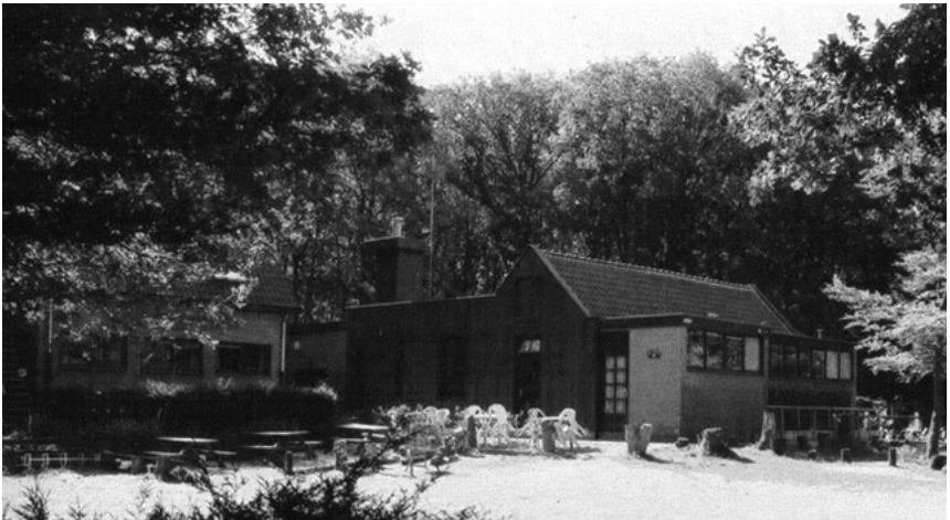
1.1 Waarschijnlijk de plek waar ik in 1961 werd ontgroend: Vakantiehuis AZ25 aan de Oud Huizerweg in Naarden

Nu was ik met mijn hoofd bij het ontgroeningskamp van de alo. Wat stond mij te wachten? Een kaalgeschoren kop, modderbaden, bierdrinkwedstrijden en veel geschreeuw en gelal? Ik kende dit soort uitpattingen alleen uit de krant en van schoolvrienden die een jaar eerder waren gaan studeren op de Universiteit van Amsterdam en zich hadden aangemeld bij de katholieke studentenvereniging Sanctus Thomas Aquinas (STA). Ik had ook gelezen dat tijdens de ontgroening van het Amsterdamse Studenten Corps (CSA) 'Dachau-tje' werd gespeeld. Een