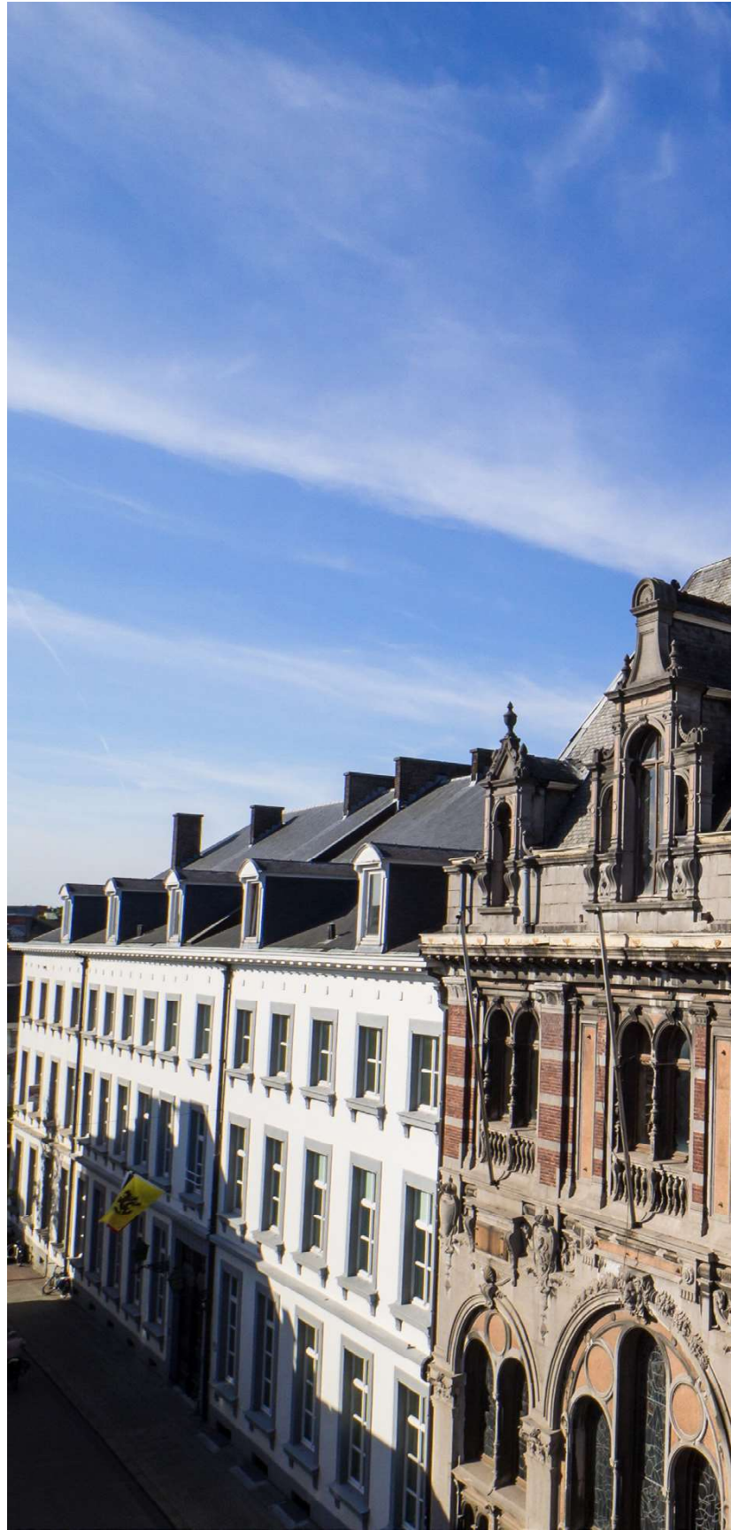
De voormalige provincieraadzaal