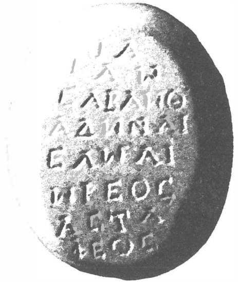
Gnostisch-magisch amulet met de namen van de boze planeetmachten, zie p. 259 en p. 465, aant. 284