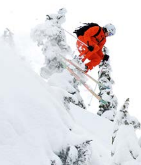
Een skiër offpiste.

De grootste schaatsbaan ter wereld. De 7,8 km lange schaatsbaan op het Rideau Canal kronkelt door hoofdstad Ottawa en trekt elk jaar meer dan een miljoen bezoekers. Zie blz. 145.