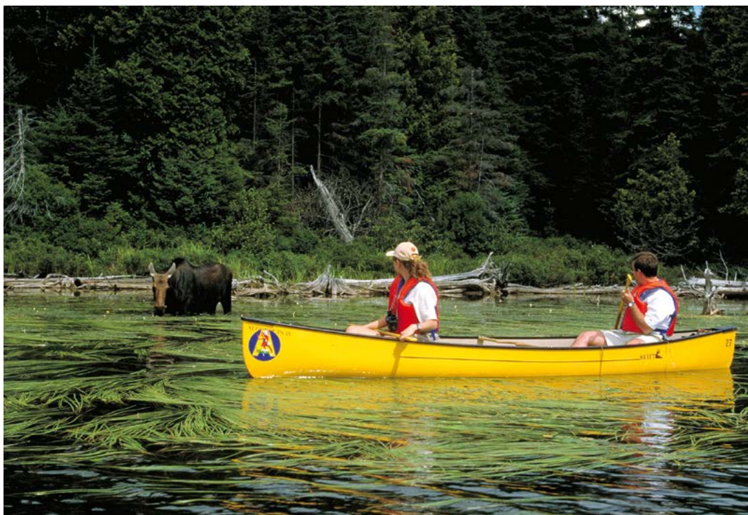
Kanoën in het Algonquin Provincial Park.