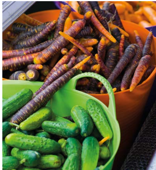
Verse augurken en paarse wortels in Saskatchewan.

De verschillende trends en obsessies op het gebied van vers en biologisch zijn helemaal op hun plaats in Canada. De dagelijkse kost van de First