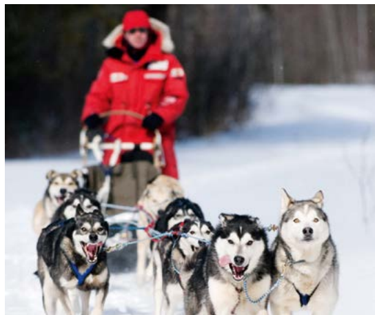
Hondenslee in Yukon Territory.