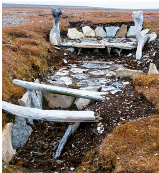
Thule-vindplaats nabij de Resolute Bay.

Toch zijn de Dorset geen rechtstreekse voorvaders van de Inuit. In het jaar 900 brak weer een warmere periode aan en begon het permanente pakijns zich terug te trekken, waardoor de