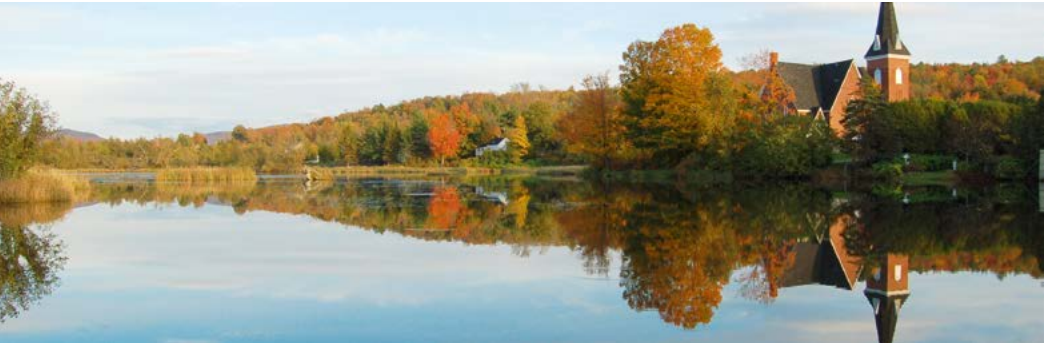
Herfstkleuren rond Lake Brome.