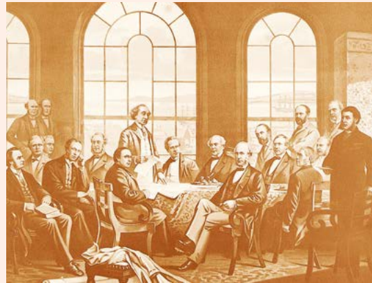
De grondleggers van de federatie.

In 1866 werden de laatste besprekingen met het Britse ministerie van Koloniën gehouden, waarmee de weg vrij was voor de belangrijkste wet in de constitutionele geschiedenis van Canada. Op 1 juli 1867 werd het gefederaliseerde Canada een feit toen de British North America Act de Britse provincie Canada in Ontario en Québec (het vroegere Opper- en Neder-Canada) splitste en samenvoegde met New Brunswick en Nova Scotia (Prince Edward Island en Newfoundland hadden zich op het laatste moment teruggetrokken). Het nieuwe land werd het dominion Canada genoemd. Een fragment uit de wet luidt als volgt: