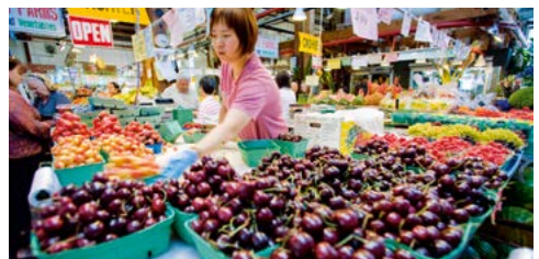
De Granville Island Public Market in Vancouver.

Granville Island Public Market, Vancouver. Een markt, theaters, restaurants en ambachtslieden - voor elk wat wils. Zie blz. 262.