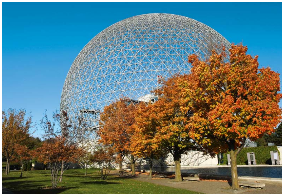
De Biosphère de Montréal.

Het Île Notre-Dame is een heerlijke bestemming voor picknickers en fietsers. Er is zelfs een kunstmatig strand en een meer om in te zwemmen.