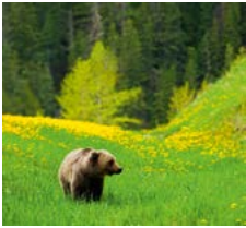
Een grizzlybeer in de bergen van British Columbia.

Een gedetailleerde gids van het hele land, waarbij de belangrijkste bestemmingen met een cijfer (of letter) zijn aangegeven op de kaartjes (bijvoorbeeld 1).