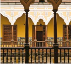
Palacio Torre Tagle, Lima.

Een gedetailleerde gids van het hele land, waarbij de belangrijkste bestemmingen met een cijfer (of letter) zijn aangegeven op de kaartjes (bijvoorbeeld 1 ).