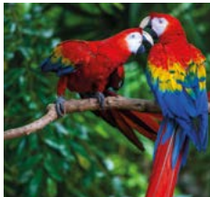
Geelvleugelara's in het Parque Nacional del Manú.

Parque Nacional del Manú. Met 1.716.295 ha is dit het grootste nationale park van Peru en een van de grootste ter wereld. Het regenwoud herbergt meer dan 1000 soorten vogels en 200 soorten zoogdieren en is het woongebied van zeven inheemse stammen. Zie blz. 219.