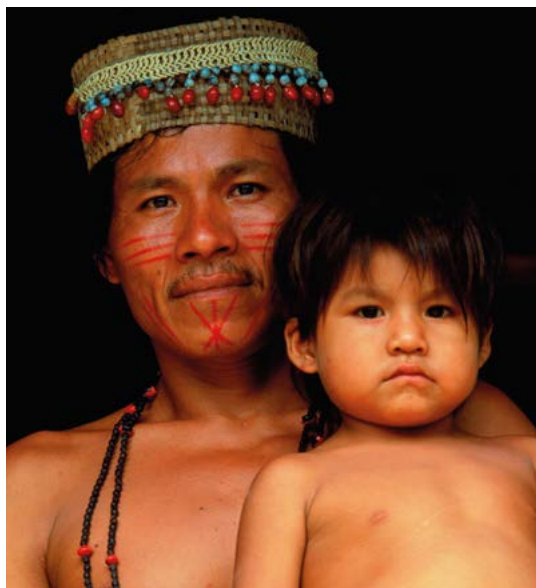
Een Jivarovader met zijn zoon.

In 1599 kwamen de Shuar in opstand, plunderden de steden en slachtten duizenden inwoners af. Ze namen de Spaanse gouverneur gevangen, die toevallig in het gebied was om belastingen te innen. 'Ze kleedden hem helemaal uit en bonden zijn handen en voeten vast. Terwijl sommigen