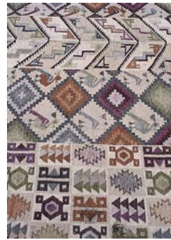
Straatkunst van bloemblaadjes tijdens de Goede Week in Ayacucho.

Het Museo Mariscal Cáceres (Jirón 28 de Julio; ma.-vr. 9.00-13.00 en 15.00-17.00 uur, za. 9.00-13.00 uur), dat gevestigd is in de sierlijke 17e-eeuwse Casona Vivanco, toont schilderijen en meubilair uit de koloniale tijd. Het museum is vernoemd naar Andrés Cáceres, een jongeman uit Ayacucho die snel carrière maakte nadat hij een legertje campesinos op de been had gebracht dat erin slaagde de Chileense troepen te weerstaan tijdens