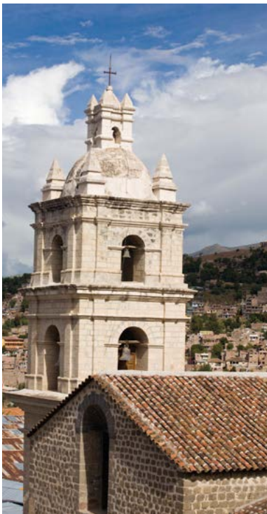
De toren van de kathedraal van Ayacucho.