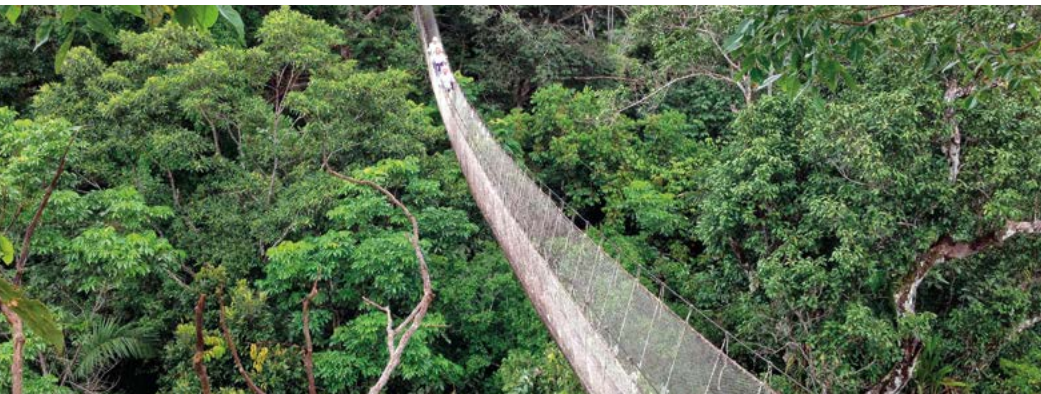
Een hangbrug door de kroonlaag van het oerwoud.