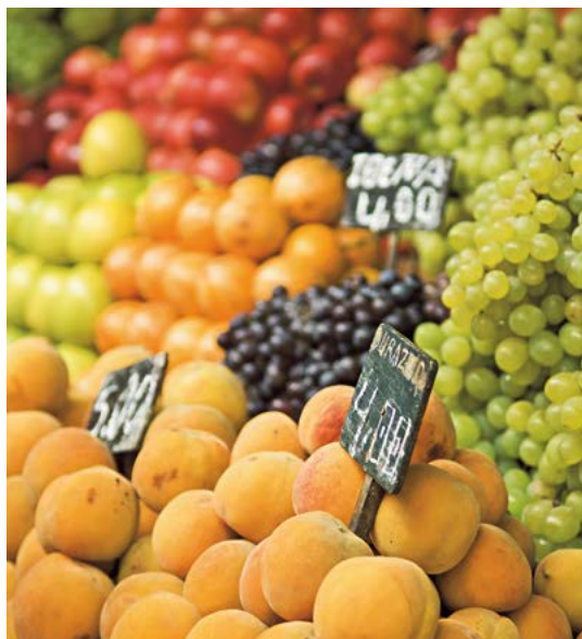
Uit de Peruaanse selva (jungle) komt heerlijk fruit.

Het lekkerste eten in Lima en andere kuststeden steunt op de overvloed aan vis en schelp- en schaaldieren in de planktonrijke kustwateren van Peru, daar waar de Humboldtstroom op andere stromen botst. Zowel vissers als koks doen hier hun voordeel mee. Een typisch Peruaans gerecht is ceviche , een schotel met rauwe witte vis in een pittige marinade van limoen- of Citroensap, uien en pepers. Elk restaurant heeft zijn eigen recept voor de marinade. Met versgevangen vis is ceviche een genot, maar de goedkopere varianten die op straat worden verkocht, kunt u beter mijden. Ceviche wordt traditioneel geserveerd met maïs en zoete aardappel, maar daar zijn inmiddels allerlei variaties op ontstaan. In ceviche mixto bijvoorbeeld worden schelp- en schaaldieren toegevoegd.