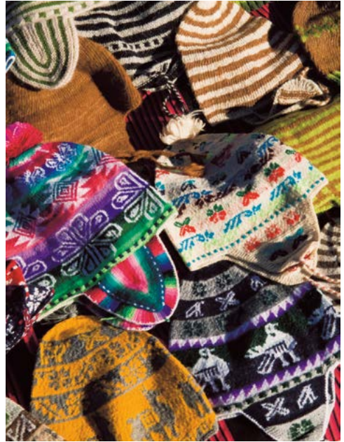
Traditionele Peruaanse mutsen van lamawol.