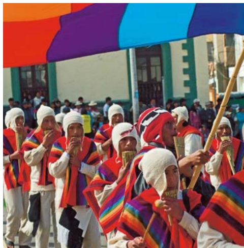
Feest van de Virgen de la Candelaria in Puno.

El Señor de los Milagros. Op 18, 19 en 28 oktober worden in Lima enorme processies gehouden ter ere van deze zeer vereerde heilige. Zie blz. 153.