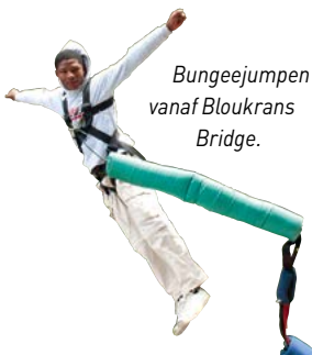
Bungeejumpen vanaf Bloukrans Bridge.