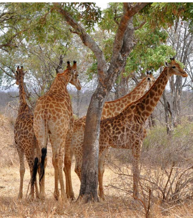
Schuilen voor de brandendhete middagzon.

sen in het Krugerpark waar zonder gids gewandeld kan worden en waar u van dichtbij kunt genieten van de aantrekkelijke flora.