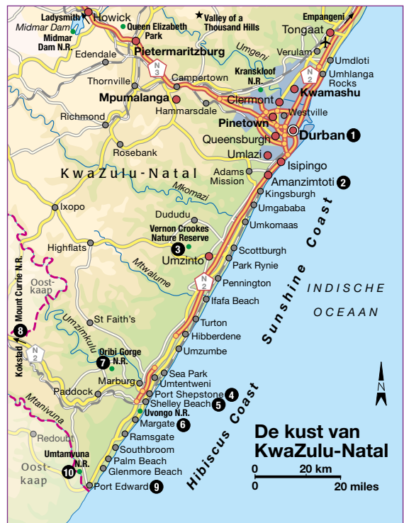
De kust van KwaZulu-Natal 0 20 km 0 20 miles