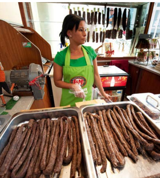
Verkoop van boerewors (worst).

Een populaire snack in Zuid-Afrika is biltong, gedroogde repen gezouten en gekruid vlees. Het wordt vaak gemaakt van rundvlees of struisvogel, maar de echte kenner geeft de voorkeur aan wild, met name koedoe- of springbokkenvlees.