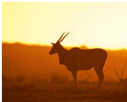
Elandantilope, De Hoop NR.

Naast de smoorhete subtropische bush zijn er onge-repte, zonovergoten stranden, door de wind geteisterde eilanden en rotsachtige schiereilanden met uitzicht op baaien waar dolfinen en walvissen zwemmen. En dat is nog lang niet alles: ook zijn er nog de afgelegen rode duinen in het uitgestrekte Kgalagadi Transfrontier Park, de nevelige wouden van de zuidoostelijke kuststreek, de fraaie Kaaps-Hollandse architectuur, de groene wijngaarden van Stellenbosch en Franschhoek, de adembenemende Tafelberg bij Kaapstad, de weergalozes bloemenpracht van Namaqualand in de lente en de torenhoge amfiteaters van rots en grazige hellingen van de uKhahlamba-Drakensbergen, waar zelfs een eenvoudig skioord ligt.