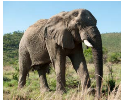
Olifant in het Pilanesberg National Park.

Er wordt veel aandacht besteed aan safari's in het Kruger National Park en particuliere wildreservaten - voor velen de voornaamste reden om Afrika te bezoeken. Maar er is nog veel meer: zo ligt Kaapstad, een van de aantrekkelijkste steden ter wereld, op een weergaloos mooi schiereiland. Wie avontuurlijk is ingesteld, vindt in Zuid-Afrika legio mogelijkheden, van de afgelegen heilige meren van de provincie Limpopo en de majestueuze bergen en rotspieken van de uKhahlamba-Drakensbergen tot de imposante weidsheid van de stenige Karoo en de zandwoestijn van de Kalahari. Waar uw belangstelling ook naar uitgaat, Zuid-Afrika is zo rijk aan bezienswaardigheden dat er voor iedere smaak en interesse wat te vinden is.