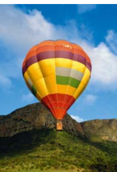
Vanuit een heteluchtballon kunt u op een bijzondere wijze genieten van het landschap.

vooral gebruikt door bezoekers die vlak voor sluitingstijd arriveren. Maar laat u daardoor niet afschrikken: op de weg tussen Orpen en Satara is er een grote kans dat u leeuwen, gevlekte hyena's of andere grote roofdieren zult zien, en de omgeving van het kamp Crocodile Bridge is bij uitstek geschikt voor het observeren van neushoorns.