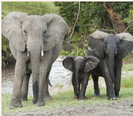
De hele kudde zorgt voor de kalveren.

Een jonge olifant die in gevaar is wordt beschermend omringd door de naaste familie. Als een olifant gewond is, proberen de anderen het dier met hun slagantanden te ondersteunen of overeind te helpen. Bij