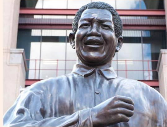
Standbeeld van Nelson Mandela in Johannesburg.

In de 26 daaropvolgende jaren probeerden de ANC-leiders in ballingschap de beweging bijeen te houden. Hierbij werden ze in hoge mate geholpen door Mandela's faam als internationaal gerespecteerd persoon en symbool van de mensenrechten. Na zijn vrijlating in 1990 speelde Mandela een centrale rol in de vier lange, moeilijke jaren van onderhandelingen tussen de verschillende politieke partijen, die in april 1994 uitliepen op de eerste democratische verkiezingen. Het ANC won overtuigend en de 76-jarige Mandela werd beëdigd als eerste zwarte president van Zuid-Afrika, een ambt dat hij tot 1999 bekleedde.