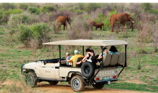
Madikwe Game Reserve.

Kgalagadi Transfrontier Park. Dit afgelegen park met rode zandduinen en droge waterwegen ligt in de Kalahari en vormt het leefgebied van tal van roofdieren. Zie blz. 311.