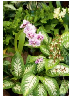
In de botanische tuin van Durban staat een schitterende orchideeënkas.

Amanzimtoti ②, slechts 24 km van Durban, heeft een grote naam onder duikliefhebbers. Hiervandaan vertrekken regelmatig boten naar de Aliwal Shoal , een zandbank op 5 km uit de kust die begroeid is met harde en zachte koralen. Bij zeer laag tij wordt de toegang tot de Shoal soms geblokkeerd door een grote, natuurlijke golfbreker, maar wie deze barrière eenmaal voorbij is, kan beginnen aan de verkenning van door de zee uitgesleten tunnels, grotten en riffen, waarvan de diepste op 43 m onder de zeespiegel liggen. Twee scheepswrakken, de Nebo en de Produce , liggen ten noorden van het noordelijkste puntje van de Shoal, dat de Pinnacles wordt genoemd. Aan de zeezijde van de zandbank, de Outside Edge, zwemmen tijgerhaaien, roggen en murenen. Vanwege de sterke stro-