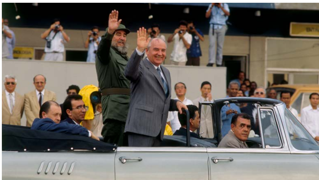
Fidel Castro en Michail Gorbatsjov, die in 1989 een officieel bezoek aan Cuba bracht.

Terwijl het Ochoa-schandaal in Cuba voor grote opschudding zorgde, viel het ene na het andere communistische regime in het Oostblok omver. Toen Michail Gorbatsjov aan de macht kwam en in het kader van de perestrojka economische hervormingen doorvoerde, voorspelden velen dat de Sovjet-geldkraan dicht zou gaan en de Cubaanse regering in de problemen zou komen. Castro was er echter heel duidelijk over dat hij niets voelde voor een meerpartijstelsel of een vrijmarkteconomie: 'De perestrojka invoeren