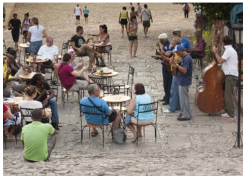
Het Casa de la Música in Trinidad.

Casa de la Música, Trinidad. Hier wordt tot in de kleine uurtjes gespeeld en gedanst.