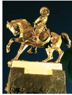
Beeld van Ignacio Agramonte, de lokale held van Camagüey.

u dat de agramonteros van lekker eten houden. Naast kramen met verse waren vindt u hier ook eenvoudige keukentjes waar warme maaltijden worden geserveerd. In de schaduw van de palmen en ander tropisch groen brengen de kooplieden hun waren luidrechtig aan de man. En ze hebben veel meer te koop dan op menig andere markt in Cuba, zoals stapels mango's en tomaten, strengen knoflook en mamey -vruchten. Het Parque Casino Campestre op de oostoever van de Río Hatibonico werd vroeger gebruikt voor veentoonstellingen, jaarmarkten, dansfeesten en andere sociale evenementen.