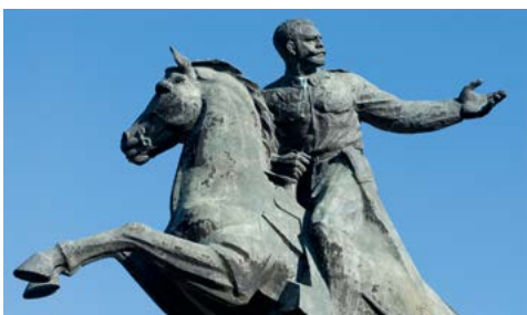
Beeld van Antonio Maceo, Plaza de la Revolución, Santiago de Cuba.

Hier, aan de rand van de Sierra Maestra, begon in 1956 de guerrillaoorlog. Een pad loopt dwars door het mangroveoerass naar zee. Zie blz. 278.