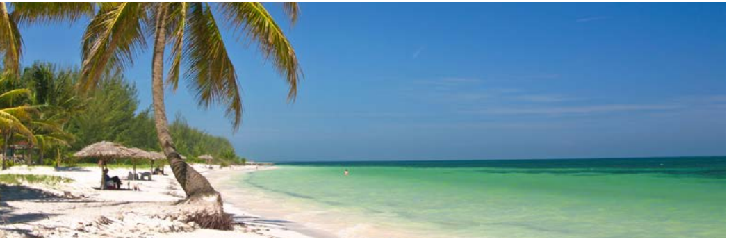
Het palmenstrand van Cayo Levisa.