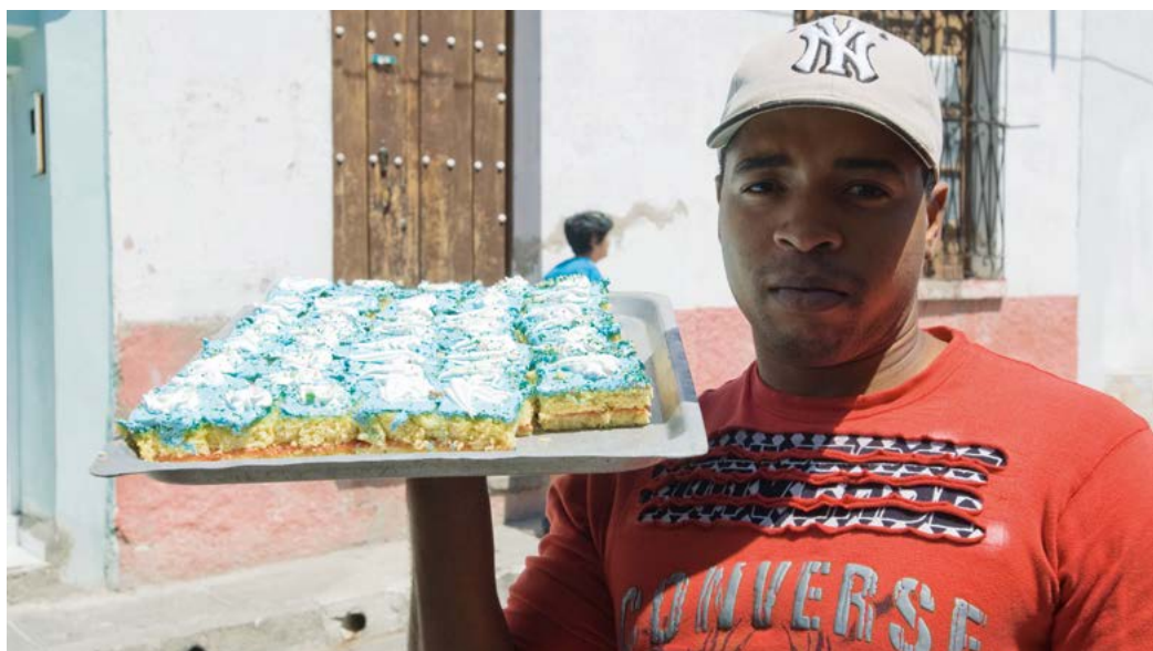
Cubaans gebak is vaak voorzien van een dikke laag felgekleurd glazuur en is mierzoet.

Suiker vormt niet alleen de basis van de Cubaanse rum, maar ook van een van de populairste niet-alcoholische drankjes, guarapo. Dit is het troebele, zoete sap van uitgeperst rauw suikerriet. Het is bij straatstalletjes te koop.