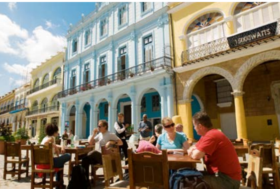
De Plaza Vieja in Havana.

In dit lommerrijke park, waaraan het chique Hotel Inglaterra ligt, is het altijd druk, vooral in de Esquina Caliente. Zie blz. 157.