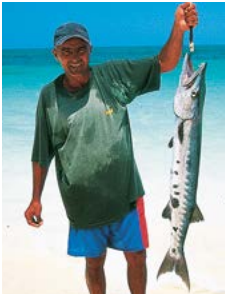
Een trotse visser.

Een gedetailleerde gids van Cuba, waarbij de belangrijkste bestemmingen met een cijfer (of letter) zijn aangegeven op de kaartjes (bijvoorbeeld 1).