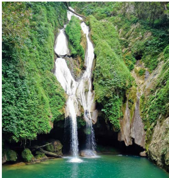
Waterval in de Sierra del Escambray.

Duiken rond het Isla de la Juventud. Een van de beste duiklocaties van Cuba. Zie blz. 309.