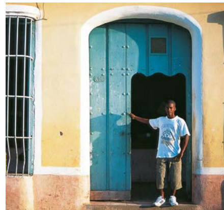
Een jongen op de uitkijk.

Het rustige, agrarische gebied in het binnenland ten oosten van Santa Clara is het minst bezochte deel van Cuba. Toch vindt u ook hier mooie oude stadjes, zoals Camagüey en Holguín, die goede uitvalsbases vormen voor de badplaatsjes aan de kust. Het oosten van Cuba, ofwel de Oriente, heeft weer een heel eigen karakter en traditie. Santiago, de op één na grootste stad van het eiland, loopt in cultureel en muzikaal opzicht dikwijls voor op Havana. Het koloniale stadje Baracoa is een pareltje. De Oriente heeft ook afgelegen stranden en ruige bergen. Een verkenning van deze streek is slechts een van de vele avonturen die Cuba te bieden heeft.