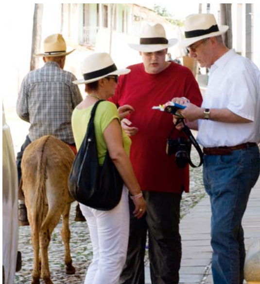
Toeristen op verkenning in Trinidad.

Het verzet van Fidel Castro tegen Batista kwam gedeeltelijk voort uit zijn afkeer van de excessen die het toerisme met zich meebracht en van het neokolonialisme dat het vertegenwoordigde. Castro vond het toerisme een afkeurenswaardig voorbeeld van de tweedeling tussen de bezittende en de bezitsloze klasse. Toen hij aan de