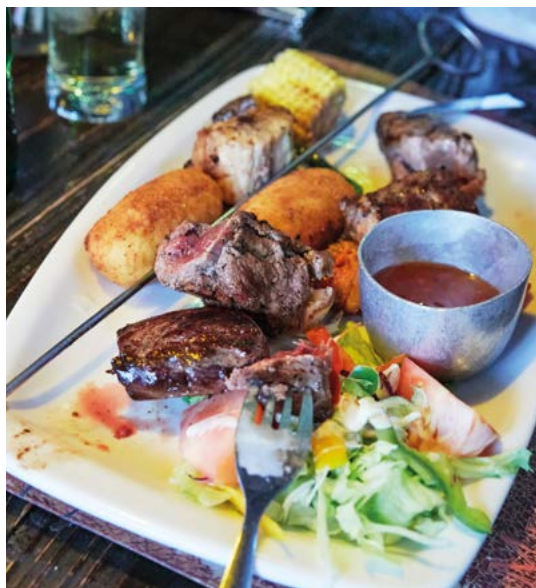
Gegrild wild in Joe's Beerhouse, Windhoek.

Ook visliefhebbers staat hier veel te wachten. Ze kunnen hun hart ophalen aan de verse kabeljou , koningsklip en tong die voor de Atlantische kust worden gevangen. Oesters uit de kwekerijen bij Swakopmund zijn een populaire delicatessen, evenals de voortreffelijke langoesten die in de buurt van Lüderitz worden gevangen.