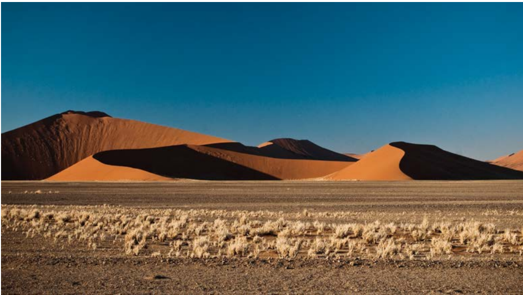
Duinen bij Sesriem.

volken. Volgens de apartheidstheoretici was het zuidwesten van Afrika ooit een onbewoond gebied, dat later bevolkt werd door immigranten. Op kaarten uit die tijd gaven zwarte pijlen de immigratiegolven van Afrikanen uit het verre noorden aan; veel dunnere witte pijlen gaven de trek van de Europeanen uit het zuiden weer. Zo ontstond het beeld dat zowel blanke als zwarte Namibiërs indringers vanuit andere streken waren geweest. De achterliggende gedachte was dat de blanke minderheid dezelfde morele aanspraken op het land kon maken als de zwarte meerderheid.