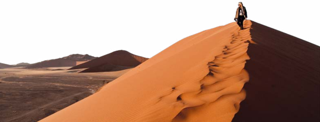
De duinen bij Sesriem.