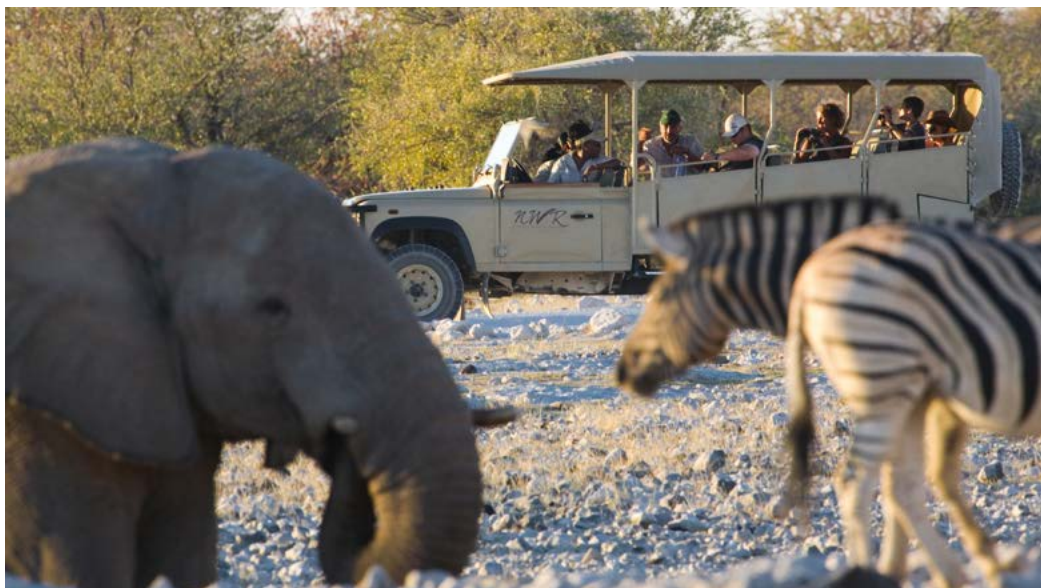
Een dagexcursie naar de 'Grote Vijf'.

Wilt u het land met eigen vervoer verkennen, dan is dat eenvoudig te regelen. Namibië be-