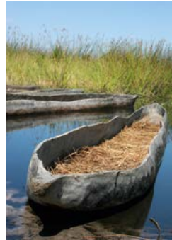
Een mokoro, afgemeerd in de Okavangodelta.

Ruim 200 km van Rundu bereikt u Divundu ①. Hier verlaat u de B8 en neemt de weg richting Mohembo en Botswana, tot u bij de Popa Falls ② de Okavango bereikt. Deze rivier vormt de westgrens van het 6275 km 2 grote Bwabwata National Park ③, dat in 2007 is opgericht. Het omvat het voormalige Caprivi Game Reserve (dat uit 1968 stamt, maar nauwelijks bescherming genoot omdat het al snel door het Zuid-Afrikaanse leger werd overgenomen) en de kleinere, beter beheerde wildreservaten Popa Falls en Mahango. Het park wordt doorsneden door de asfaltweg die over de hele lengte van de Caprivi loopt. Na 180 km bereikt u de rivier de Kwando, de oostelijke grens van het park. Bwabwata is het Namibische deel van de Kavan-