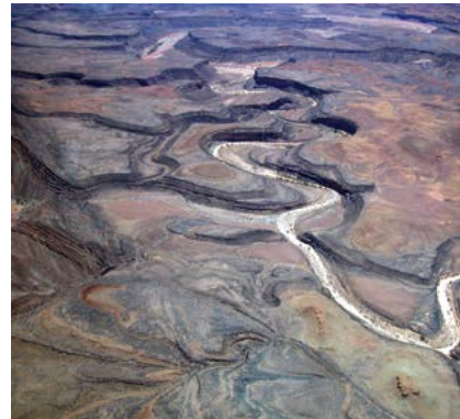
De Fish River Canyon, gezien vanuit de lucht.

In deze gebieden kunt u het niet zonder een terreinwagen stellen. De weelderig groene wildernis van de Caprivistroom laat zich daarentegen zonder problemen met een gewone personenauto verkennen.