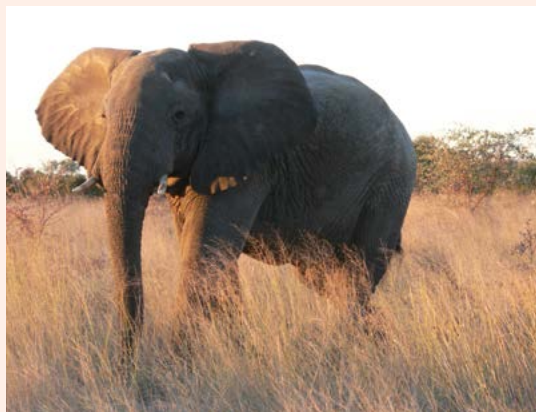
De Afrikaanse olifant is een indrukwekkend dier.

stomende hoop verse mest langs de kant van de weg, in combinatie met afgerukte takken en andere vernielde vegetatie, is onmiskenbaar een teken dat er net olifanten voorbij zijn gekomen. En mocht u op een modder- of zandweg verse pootafdrukken van een roofdier zien, dan kan het lonen het spoor te volgen. Leeuwen en andere dieren maken niet alleen gebruik van wildsporen, maar ook van wegen.