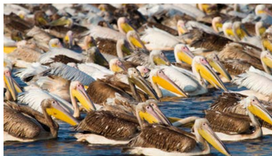
Pelikanen voor de Namibische kust.