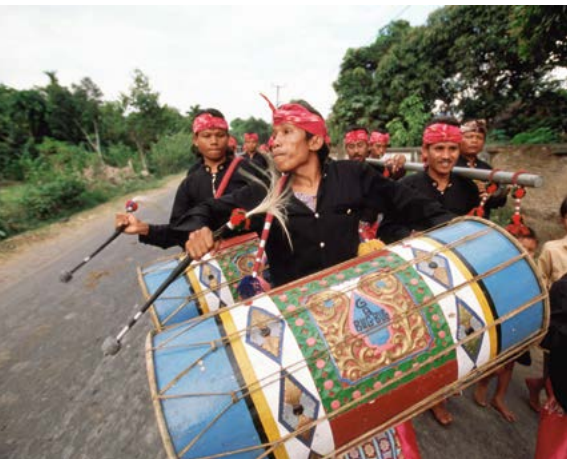
De grote gendang belek-trommels van Lombok.