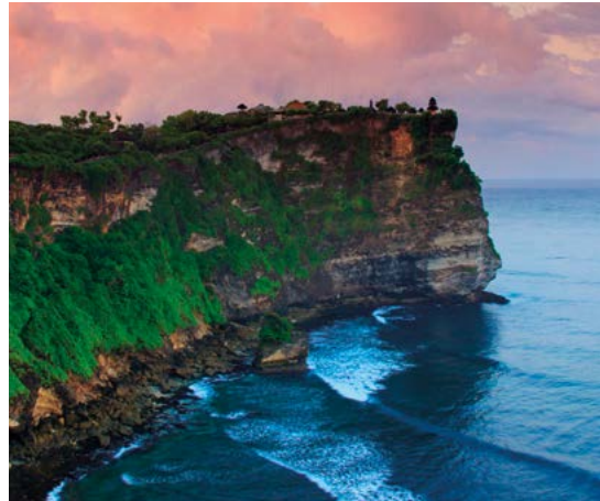
De imposante kust bij de Pura Luhur Uluwatu.

Duiker en een school snoekbaarzen bij het wrak van de Liberty voor de kust van Tulamben.