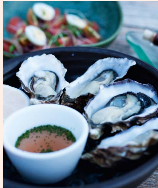
Sushi en oesters in Ku De Ta.

Internationale koks die op Bali zijn neergestreken, hebben heerlijke fusiogerechten ontwikkeld. Onder welke noemer deze manier van koken ook gepresenteerd wordt - Pacific Rim, modern-Australisch, modern-Frans, Californisch, nieuw-Aziatisch of welke fantasie naam er ook maar voor verzonnen is - hij