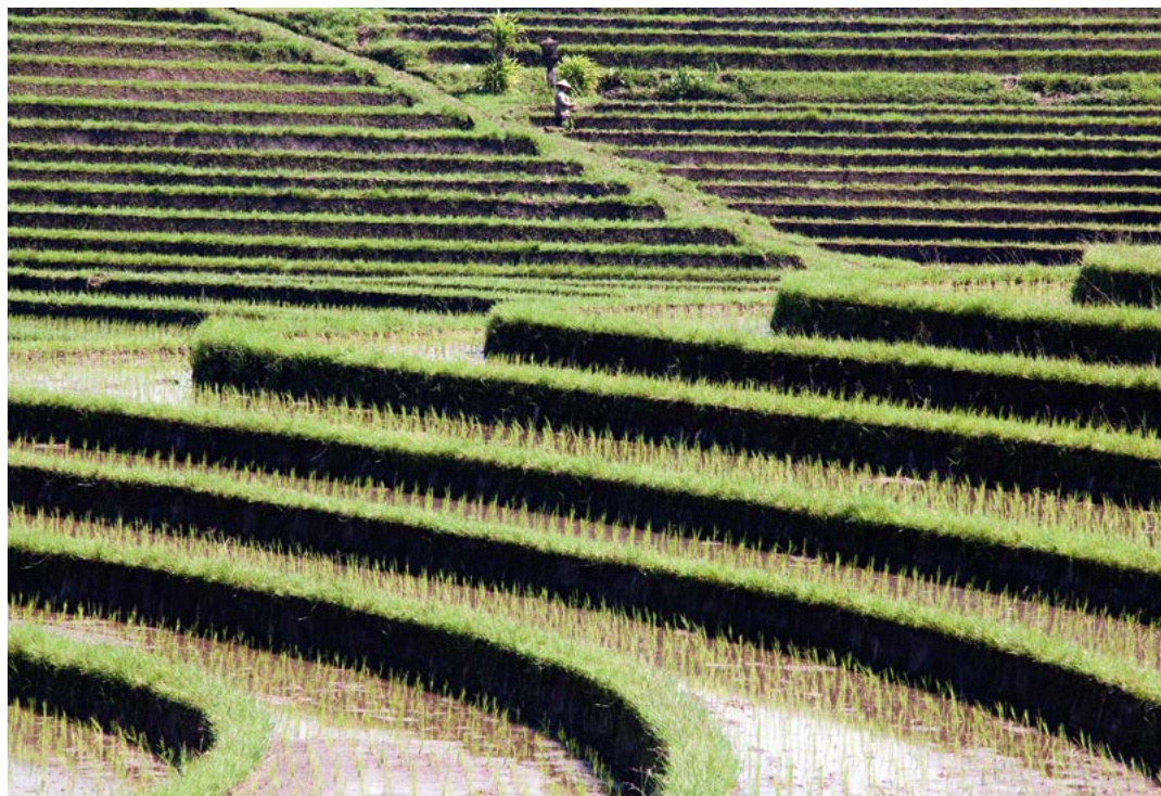
Rijst op de sawa's bij Belimbing.