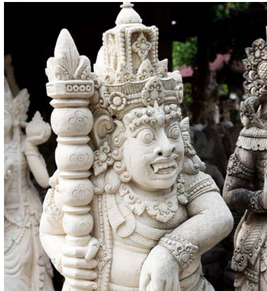
Tufstenen beelden in Batubulan.

De beeldhouwkunst gaat vele eeuwen terug, toen tempels en paleizen van symbolische decoraties werden voorzien. In veel bouwwerken zijn tropisch hardhout en paras (tufsteen) gebruikt voor poorten, balken en pilaren. Houtsnijwerk, ornamenten en koffers voor gamelaninstrumenten zijn dikwijls beschilderd en versierd met bladgoud. In de jaren dertig van de vorige eeuw