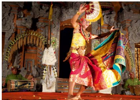
Legong-dans in Ubud.