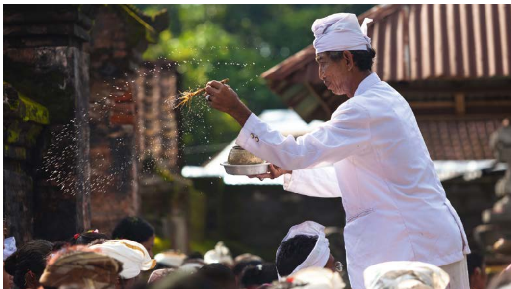
Een priester sprenkelt heilig water tijdens een ceremonie.

dan onder de spirituele geneeskunst valt. Een balian tulang is gespecialiseerd in het zetten van gebroken botten, terwijl een balian manak een vroedvrouw is. De balian tenung voorspelt de toekomst, en een balian usada geneest met behulp van een lontar (palmsbladmanuscript), die magische kennis over geneeskunst bevat. Hoewel veel balian usada bijzonder goed onderlegde wetenschappers zijn en geconsulteerd worden omdat ze de manuscripten kunnen interpreteren, zou het de lontar zijn waarvan de magische energie uitgaat.