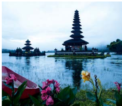
De Pura Ulun Danu Bratan, Bali.

Neem de tijd om de talloze contrasten van dit prachtige eiland op u in te laten werken. Behalve een fantastisch landschap treft u er een intense spiritualiteit en een gastvrije, vriendelijke bevolking, die toeristen beschouwt als tamu - gasten.