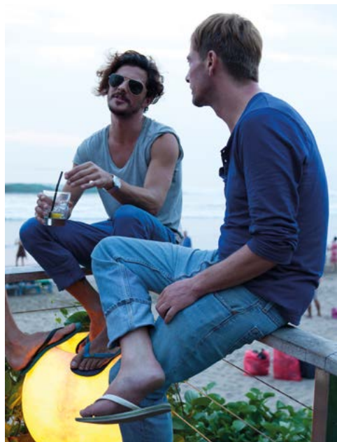
Toeristen in Ku De Ta, Seminyak.

Ayam Pelecing. Gebakken kip in een bijzonder hete chilisaus: een specialiteit van Lombok.