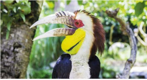
Neushoornvogel in het Vogelpark Taman Burung Bali.