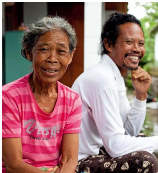
Inwoners van Seseh, Tabanan.

Hoewel de Balinese taal taalkundig gezien vooral verwant is aan de talen van de eilanden ten oosten van Bali, is hij sterk beïnvloed door het Javaans. Het is een rijke, moeilijke taal die - in een land met ruim 255 miljoen inwoners - door meer dan 4 miljoen Balinezen wordt gesproken. Als etnische en religieuze minderheid in Indonesië zijn de Balinezen trots op hun taal, die ze, behalve op kantoor en op school, het grootste deel van de tijd gebruiken. Het gesproken Balinees kent verschillende niveaus, al naar