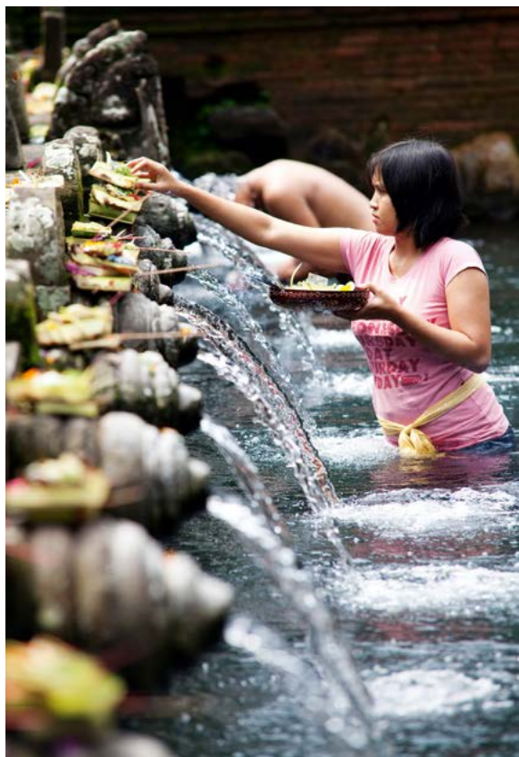
Heilige bron in de Pura Tirtha Empul, dicht bij Ubud.

Senggigi-festival, Lombok. Elk jaar in juli, met de beste traditionele opvoeringen uit alle delen van het eiland. Taman Budaya, Lombok. Het enige vaste podium van Lombok waar vaak traditionele opvoeringen te zien zijn. Zie blz. 203. Peresean-gevechten, Lombok. Mannen met bamboestokken en schilden van koeienhuid strijden met elkaar. (Vraag in uw hotel waar de uitvoeringen worden gehouden.) Zie blz. 221.