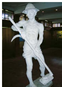
In het Museum Subak is een goed gedocumenteerde expositie over de rijstbouw op Bali te zien.

Ongeveer 3 km ten westen van de stad Tabanan ligt Krambitan ⑥. Nakomelingen van het vorstenhuis van Tabanan bezitten hier de prachtige, sfeervolle 17e-eeuwse paleizen Puri Anyar