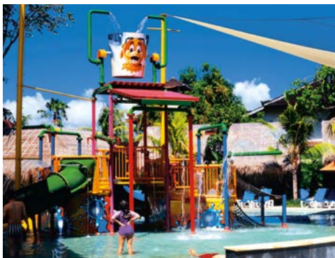
Waterpret in het Waterbom Park.

De mooiste stranden, de leukste buitenactiviteiten, de interessantste tempels - hier vindt u in één oogopslag het beste dat Bali en Lombok te bieden hebben.