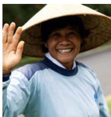
Tuinier van de Botanische Tuinen van Bali in het noorden.

Een gedetailleerde gids van het hele eiland, waarbij de belangrijkste bestemmingen met een cijfer (of letter) zijn aangegeven op de kaartjes. (bijvoorbeeld 1 ).