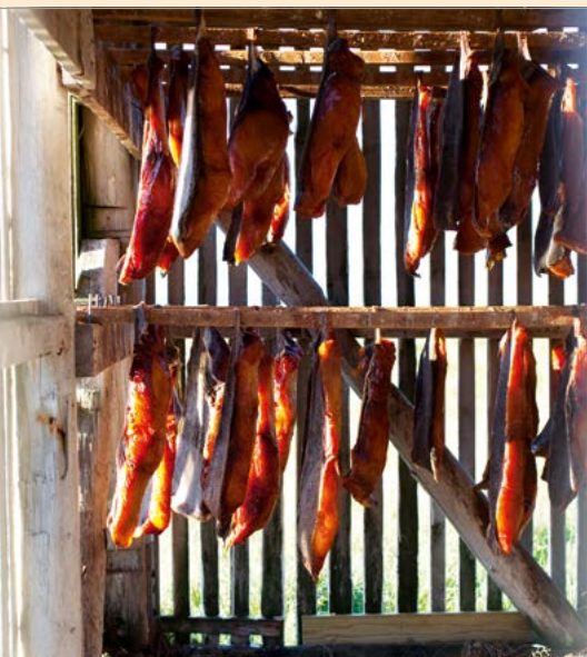
De kabeljauwvangst is nog steeds belangrijk.

Sinds 1944 is het buitenlandse beleid van IJsland sterker bepaald door de ontwikkelingen in de internationale visserij dan door de rol die het land speelt als strategisch belangrijk, hoewel legerloos lid van