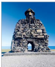
Beeld in Arnarstapi.

Een gedetailleerde gids van het hele land, waarbij de belangrijkste bestemmingen met een cijfer (of letter) zijn aangegeven op de kaartjes (bijvoorbeeld ❶).