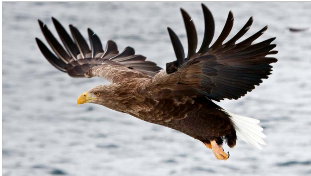
Een zeearend in de vlucht.

IJsland is nooit verbonden geweest met de oudere continenten, dus is het niet zo verwonderlijk dat het vrijwel geen inheemse landzoogdieren telt.