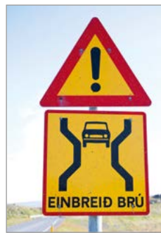
Opgelet: smalle brug!

Van Bildudalur voert de lastige, maar indrukwekkende weg 619 langs de kop van enkele dalen alvorens te eindigen