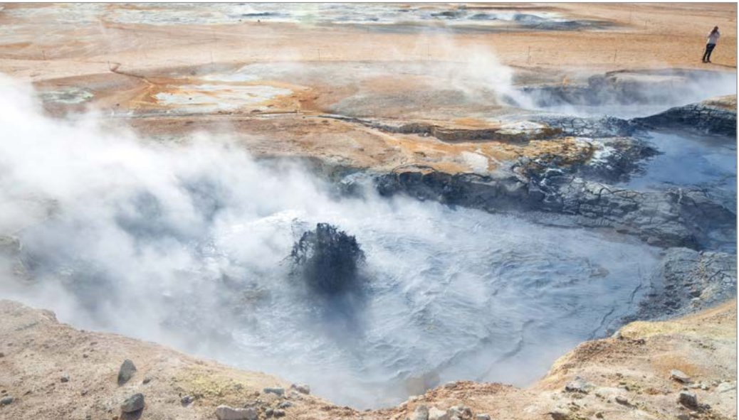
Het geothermische veld Hverir bij het Mývatn.

Soms kan het natuurgeweld betuegeld worden en geld opleveren. De afgelopen zeventig jaar zijn de IJslandse huizen dankzij geothermische energie voorzien van goedkoop en milieuvriendelijk