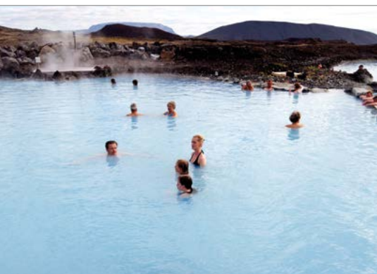
Het Mývatn-natuurbad (Jarðböðin við Mývatn).

Gerijpte haai en brennivín. Tijdens het heidense Þorrablót-festival worden traditionele IJslandse gerechten en drankjes met veel smaak geconsumeerd. Zie blz. 119.