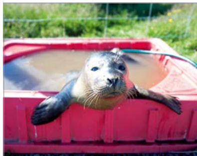
Zeehond in Húsey, 60 km ten noorden van Egilsstaðir.

Tot slot is er het binnenland, volkomen anders dan de rest van IJsland. Waar bijna alle kustwegen geschikt zijn voor gewone auto’s, vereist het binnenland een terreinwagen of speciale tourbus. Waar u aan de kust honderden dorpjes en boerderijen met accommodatie kunt vinden, bent u in het binnenland aangewezen op uw eigen tentje of een kale slaappleaats in een berghut. Aan de kust is het relatief warm, al regent het vaak, maar in het binnenland kan de temperatuur van het ene op het andere moment gevaarlijk dalen. □