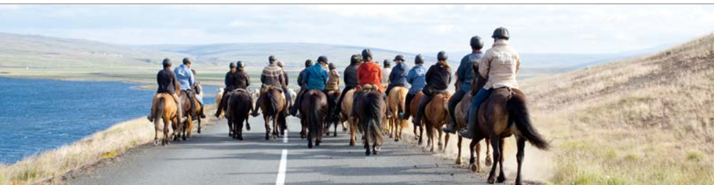
Een rit op ijslanders.

Schitterende landschappen, spectaculaire watervallen, geothermisch verwarmde baden, buitenactiviteiten, een bruisend uitgaansleven en de charmes van de noordelijkste stad van Europa: u vindt het in IJsland.