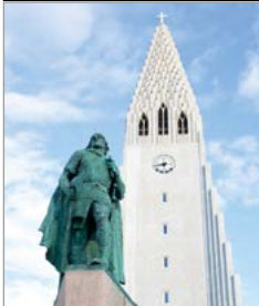
Het beeld van Leifur Eiríksson voor de Hallgrímskirkja.

Hallgrímskirkja. Boven in de toren van deze bijzondere kerk, die bijna overal in de stad te zien is, wacht u een adembenemend uitzicht. Zie blz. 151. Nationaal Museum. Een aanrader voor iedereen die meer te weten wil komen over het IJslandse verleden. Zie blz. 149.