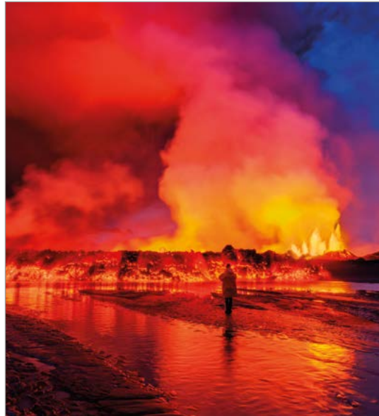
Lavastrroom en rookpluimen bij de Holuhraun-breuklijn, niet ver van de vulkaan Bárðarbunga.

De Midden-Atlantische Rug loopt van zuidwest naar noordoost over het eiland en wordt gekenmerkt door een gordel van vulkanische kraters,