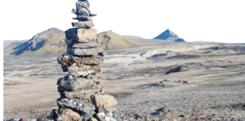
De Snæfellsjökull is de blikvanger op het schiereiland Snæfellsnes.

Herðubreið. Deze berg torent boven de zwarte lavavlakte in het oostelijke binnenland. In deze kale woestijnen vormt het Herðubreiðarlindir-dal een oase van groen. Zie blz. 309.