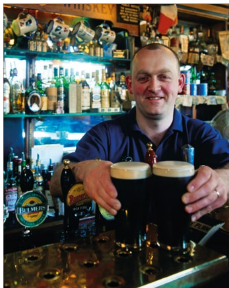
Perfect getapte pints met 'the black stuff'.

Uit een recent onderzoek van de Europese Unie bleek dat Ierland het hoogste percentage stevige drinkers van heel Europa heeft. Iets meer dan een derde van de Ierse bevolking zou gemiddeld vijf