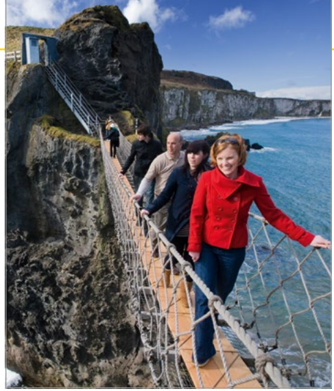
De Carrick-a-Rede Rope Bridge.

Cliffs of Moher. Paden voeren naar uitkijkpunten op de imposante kliffen. Zie blz. 211.