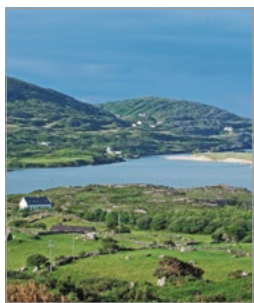
Onderweg op de Ring of Kerry.

Een gedetailleerde gids van het hele land, waarbij de belangrijkste bestemmingen met een cijfer (of letter) zijn aangegeven op de kaartjes (bijvoorbeeld ❶).