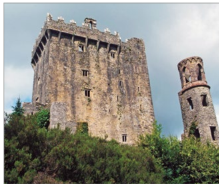
Het Blarney Castle.

De hectiek van de moderne wereld is niet aan Ierland voorbijgegaan, maar over het algemeen ligt het levenstempo hier lager dan elders. De economische crisis heeft weliswaar een erfenis van onvoltooide gebouwen en een gekwetste nationale psyche nagelaten, maar opvallend genoeg zijn de meeste Ieren hun talent voor plezier maken nog altijd niet kwijtgeraakt. □