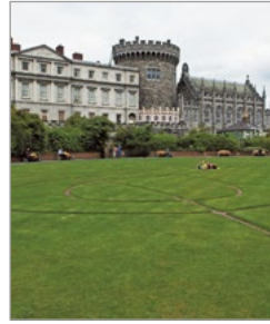
Dublin Castle, met in het midden de Record Tower.

In het gerestaureerde en gemoderniseerde gebouw met het klokkentorentje achter op het kasteelterrein is de gelauwerde Chester Beatty Library 18 gevestigd (www.cbl.ie, okt.-apr. di. t/m vr. 10.00-17.00, mrt.-okt. ma. t/m vr. 10.00-17.00, hele jaar za. 11.00-17.00, zo. 13.00-17.00 uur, toegang gratis). De