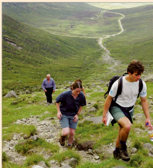
Wandelaars in de Mourne Mountains in het graafschap Down.

The Grand Canal Way (graafschappen Dublin en Midlands). Deze vlakke wandelroute begint aan de rand van Dublin en loopt langs het Grand Canal westwaarts naar het dorpje Shannon Harbour, een afstand van 130 km. Eten, drinken en overnachten kunt u in een van de mooie dorpjes die u onderweg passeert. Ook een bezoek aan Ierlands mooiste