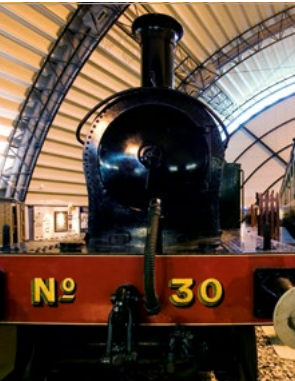
Locomotief in het Ulster Folk and Transport Museum.