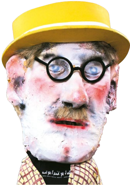
Bloomsday vieren met een James Joyce-masker op.

Kleurrijke festivals, interessante musea, gezellige pubs en mooie wandelingen: hier vindt u in één oogopslag wat Ierland verder nog te bieden heeft.