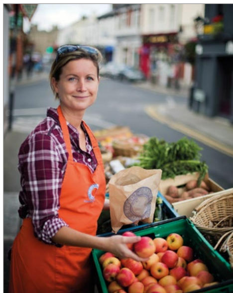
Groente- en fruitverkoopster in Dalkey.

Miljoenen bezoekers reageren op de innemende charme van Ierland door op slag verliefd te worden op het land. Een toenemend aantal kiest ervoor deze liefdesrelatie meer kans te geven door naar Ierland te emigreren; u bent dus gewaar-schuwd. Evengoed vinden veel Ieren dat de ingrijpende maatschappelijke en economische veranderingen van de afgelopen decennia (zie blz. 19) de traditionele Ierse waarden van beleefdheid, gastvrijheid, spontaniteit, sportiviteit en vrolijkheid hebben uitgehold. Deze critici stellen dat Ierland zijn ziel verkoopt in ruil voor een ontworteld kosmopolitisme, dat het ongerepte plat-teland wordt verpest door ondoordachte en slecht ontworpen bouwprojecten en dat er geen aandacht is voor de steeds groter wordende kloof tus-sen arm en rijk. Anderen zijn juist van mening dat de Ieren de creativiteit die ze altijd al aan de dag legden in de literatuur en de kunst nu aanwenden om de economie uit het slop te halen.