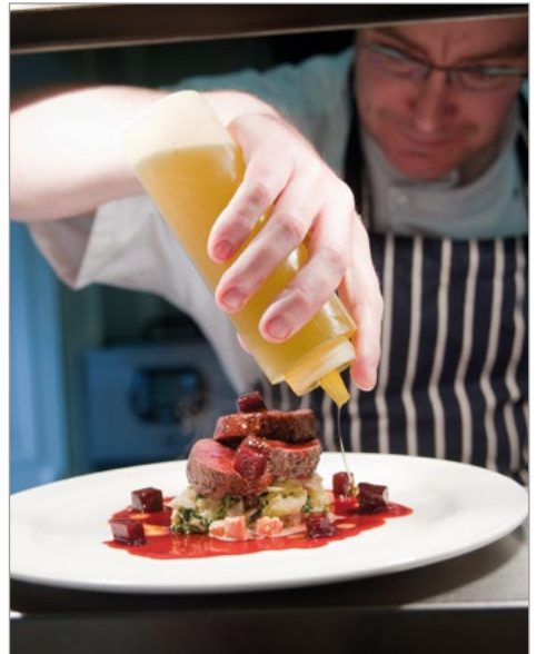
In de keuken van het Balloo House.

‘Bia’ is het Ierse woord voor eten en het woord ‘Féile’ betekent festival of viering. Met dit programma streeft Bord Bia ernaar dat restaurants verse, authentiek Ierse producten gebruiken. Leden zijn verplicht om hun klanten te informeren over hoe hun eten is klaargemaakt en waar de ingrediënten vandaan komen. Bovendien moeten ze vlees en eieren van goedgekeurde producenten afnemen. Er zijn 1450 Féile Bia-leden in Ierland. Sommige toprestaurants zijn geen lid omdat ze hun producten van eigen, biologische leveranciers betrekken. □