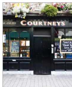
Pub in Killarney.

De regio Killarney 12 is misschien wel het meest toeristische gebied in het zuidwesten, maar het is nog altijd mogelijk om de drukte te ontlopen. Het romantische landschap van met heide begroeide bergen, zwerfkeien, ongerepte