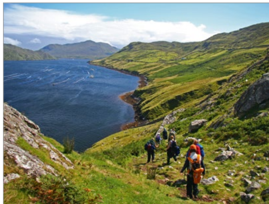
Wandelaars in Connemara.