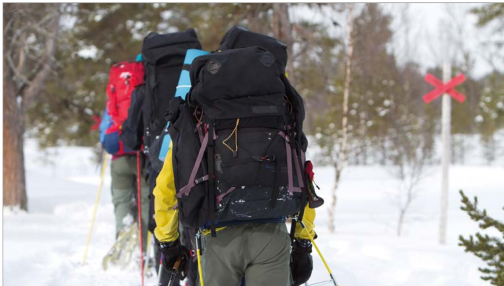
Sneeuwschoenwandelaars op een rodekruizenroute.

Wie de winterse wildernis op een heel andere manier wil verkennen, kan er met de hondenslee opuit gaan. In het noorden zitten tal van bedrijfjes die deze sport aanbieden, onder meer in Åre en Kiruna. Neem de teugels zelf ter hand of laat de