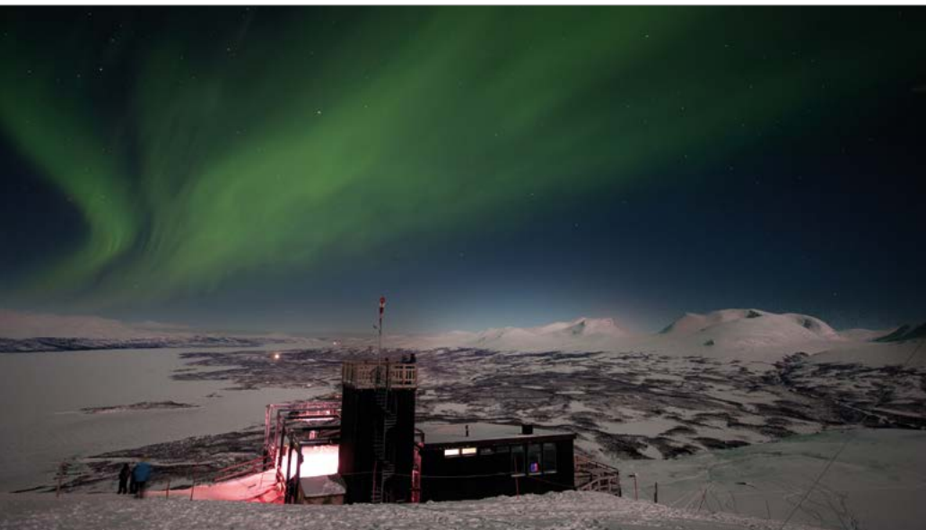
Het noorderlicht in het hoge noorden van Zweden.

Wanneer de zomer definitief ten einde is en zich somberder tijden aandienen, biedt het woest over de winterhemel golvende en pulserende groen, paars, roze en rood van het noorderlicht, aurora borealis, enige verlichting. De Samen geloofden dat de lichtstralen de rusteloze geesten van de doden waren. Als je niet stil was, als je geen respect