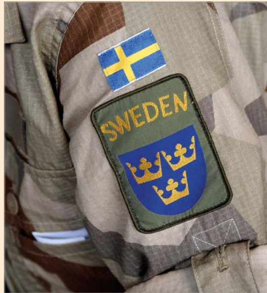
Een Zweedse EUFOR-soldaat.

De coalitieregering besloot om Zweden koste wat kost buiten de oorlog te houden en stond met tegenzin toe dat Duitse troepen met verlof via Zweden reisden. Velen zagen dit als immoreel. Anderen waren van mening dat Zweden juist dankzij zijn neutraliteit een humanitaire bijdrage kon leveren die zwaarder woog dan welke militaire bijdrage ook. Na de oorlog werden Noorwegen en Denemarken lid van de NAVO en tekende Finland in 1948 een vriendschapsverdrag met de Sovjet-Unie. Zweden