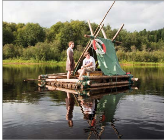
Varen met een vlot op de Klarälven.

Orsa Rovdjurspark. Speur naar beren, wolven en andere vleeseters in het Orsa-roofdierenpark. Zie blz. 255.