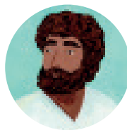
73. Jezus, het nieuwe begin blz. 288