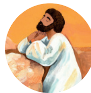
7. Jezus gaat naar de woestijn blz. 156