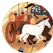
56. In ballingschap! blz. 118