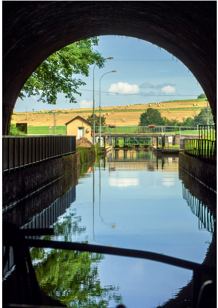
Een tunnel voor de scheepvaart is een typisch Frans fenomeen.

Bij de aanleg van dit soort kanalen moesten problemen worden overwonnen die we in Nederland niet tegenkomen. De naam 'scheidingspand' doet al vermoeden dat in feite het water aan twee kanten naar beneden stroomt. Elke keer dat in een sluis geschut wordt, lopen vele liters water van de 'berg' af. Daarom ligt in de buurt van het hoogste kanaal-pand dikwijls een stuwmeer van waaruit het water dat verloren is gegaan, weer aangevuld wordt. Er is niet altijd een bruikbare bron in de buurt en dus moet het water van ver aangevoerd worden. Hiervoor is vaak een heel stelsel van toevoerkanaaltjes aangelegd.