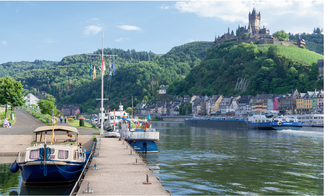
Het Rondje Maas-Moezel-Rijn brengt je na Frankrijk ook door Duitsland.

wijzingen voor omstandigheden die typisch zijn voor het varen op de Noord-Franse binnenwateren – en voor het rondje Maas-Moezel-Rijn. Hoe kun je bijvoorbeeld het best omgaan met de beroepsvaart? Ook tips om zo soepel mogelijk door de sluisen te komen en zaken als welke kaarten je nodig hebt, komen hier aan bod.