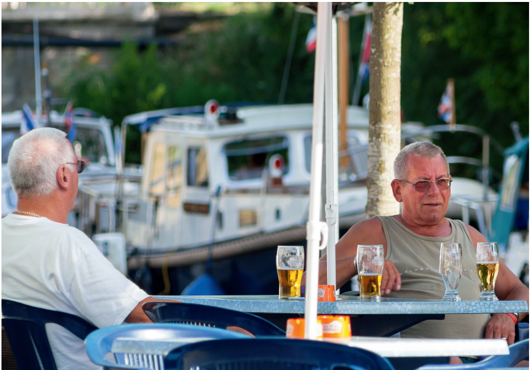
Overall rond het water hangt een genoeglijke sfeer.