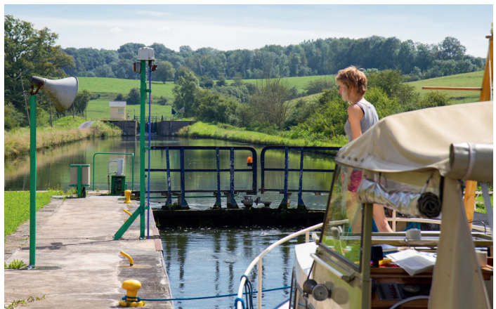
Een groot deel van de Franse vaarwegen ligt in een prachtige omgeving.

Maar hoe weet je, voor je vertrekt, wat de mooiste en de slimste routes zijn, of – als je al onderweg bent – waar je het best kunt aanleggen; en hoe voorkom je dat je een dorp of een afslag voorbijvaart, zonder te weten hoe mooi of bijzonder het daar is? Daarvoor is dit boek, om je de weg te wijzen.