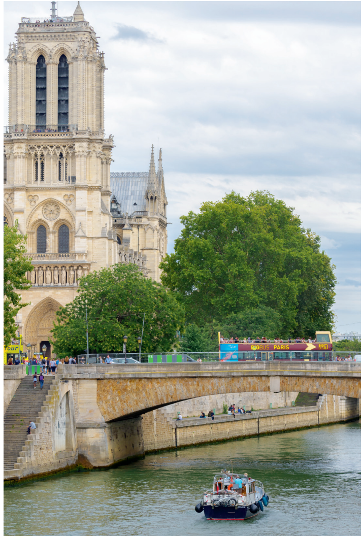
Met de eigen boot naar Parijs is een flinke vaartocht, die echter beslist de moeite waard is.

Eigenlijk zijn er in Frankrijk twee soorten kanalen. Een lateraalkanaal volgt de loop van een rivier; regelmatig vaar je op de bevaarbare delen in de rivier. Het komt echter ook voor dat het kanaal weliswaar het rivierdal volgt, maar in feite is aangelegd op de helling van de heuvels naast de rivier.