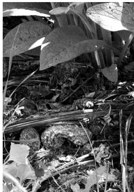
Een voorbeeld 'uit het wild' van de vele productieve lagen: lep met daaronder Wilde appel, daaronder Hazelaar, daaronder Framboos en in de schaduw Kruisbes. Op de foto ernaast Morielje onder gecultiveerde Appelbomen, met Smeerwortel in de kruidlaag als mineralen- en bijenplant.

Boven het kronendak steken de bijzonder hoge bomen uit, of de meest volwassen exemplaren. Het kan best dat ze één derde langer zijn dan de rest van het bos. In gematigde loofbossen staan ze hier en daar, en zijn ze eerder uitzondering dan regel. Het kan zijn dat een den een tijdlang boven de kroonlaag uitsteekt omdat hij snel hoog wordt. Voordat Europeanen Amerika koloniseerden stonden hier Weymouth-dennen tot bijna tachtig meter hoog. Staat zo'n boom in een eikenbos dan zou hij daar bovenuit torenen, terwijl hij in een opstand van allerlei grote dennen deel zou uitmaken van de kroonlaag.