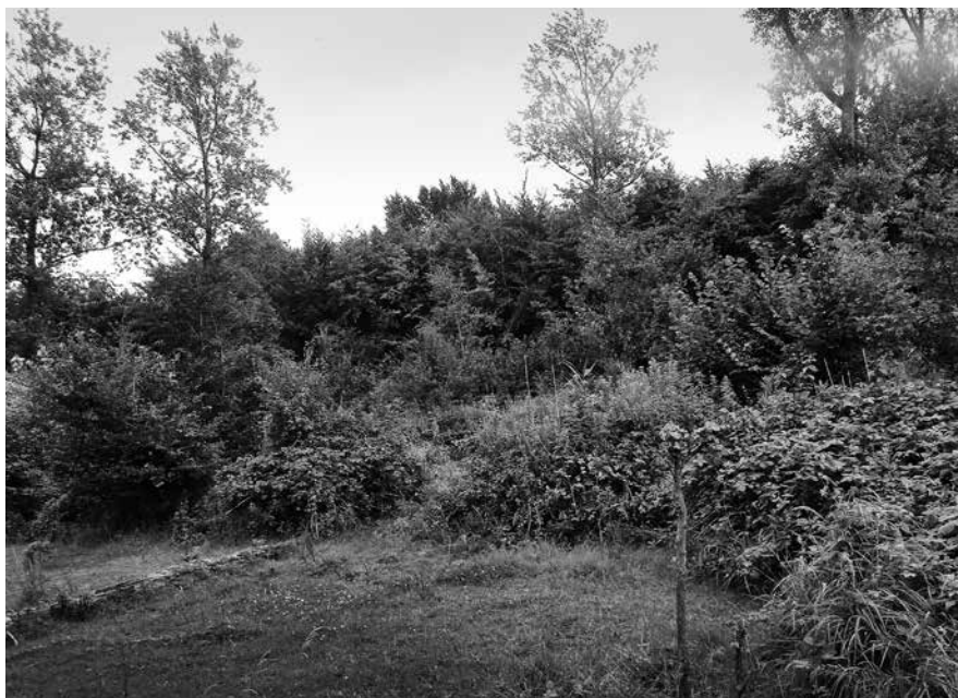
Een natuurlijke bosrand als deze kun je naar eigen believen nabootsen voor maximale fotosynthese en maximale bruikbaarheid.

raken, staan er in deze onderlaag bomen die min of meer schaduwtolerant zijn. Er kunnen bomen tussen staan die uiteindelijk in de kroonlaag zullen belanden als er daar ruimte komt door uitval en er kunnen bomen tussen staan die van nature wat kleiner blijven maar die goed gedijen in de halfschaduw.