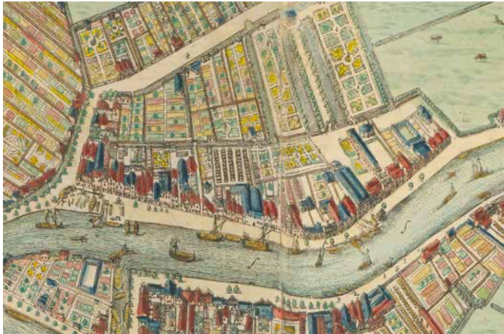
Kaart Johannes de Vou (ca. 1694) ingekleurd.

Een herberg dus. In herbergen gebeurt van alles in die tijd. Ook zaken die - zo lezen we - het daglicht niet kunnen verdragen. Dat blijkt ook hier het geval. In 1636 lezen we over een 'huisinghe, de nieuwe herbergh' op perceel 289, waar een uit de hand gelopen 'plezanterie' plaatsvindt. De akte van 16 december 1636 vertelt: