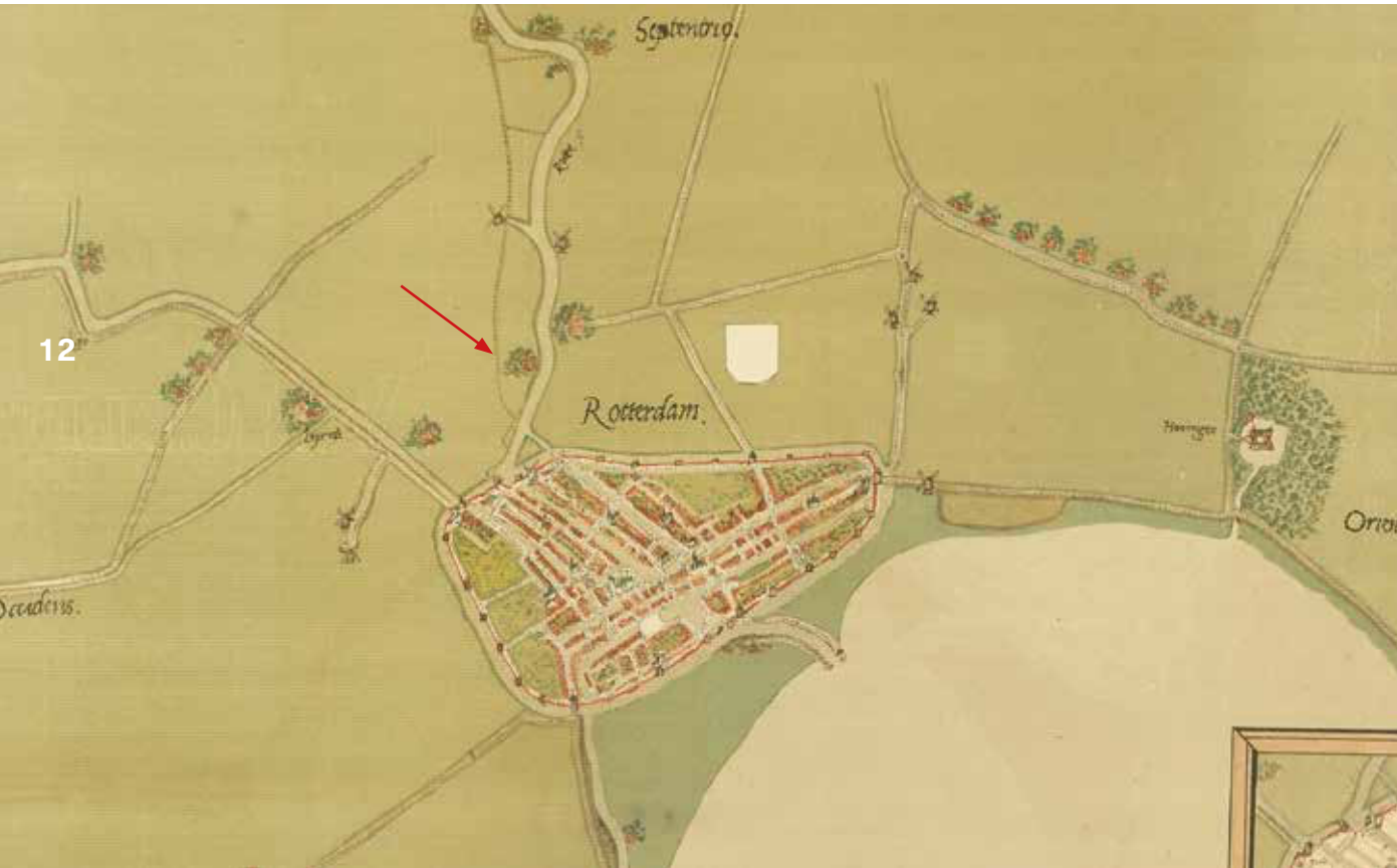
Eerste kaart met aanduiding perceel Koopmanshuizen, bosschage duidt de locatie aan. Kaart Jacob van Deventer (1555).