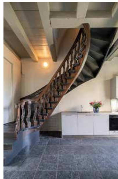
Keuken en de oorspronkelijke Rococotrap.

De Koopmanshuizen aan de Rechter Rottekade geven de typologische ontwikkeling van het Rotterdamse woonhuis in de achttiende eeuw weer. Pand 405/407 is een klein koopmanshuis met de karakteristieke opzet van twee ingangen aan de voorzijde, een functionele begane grond en de andere verdiepingen met een woon- of huishoudelijke functie. Pand 413/417 is een eenvoudiger, dubbel woon-werkhuis, dat direct aan de Vriendenlaan grenst. Samen vormde zij een ruimtelijk en historisch-functioneel geheel én een goed voorbeeld van de opbouw en indeling van achttiende-eeuwse koopmanshuizen.