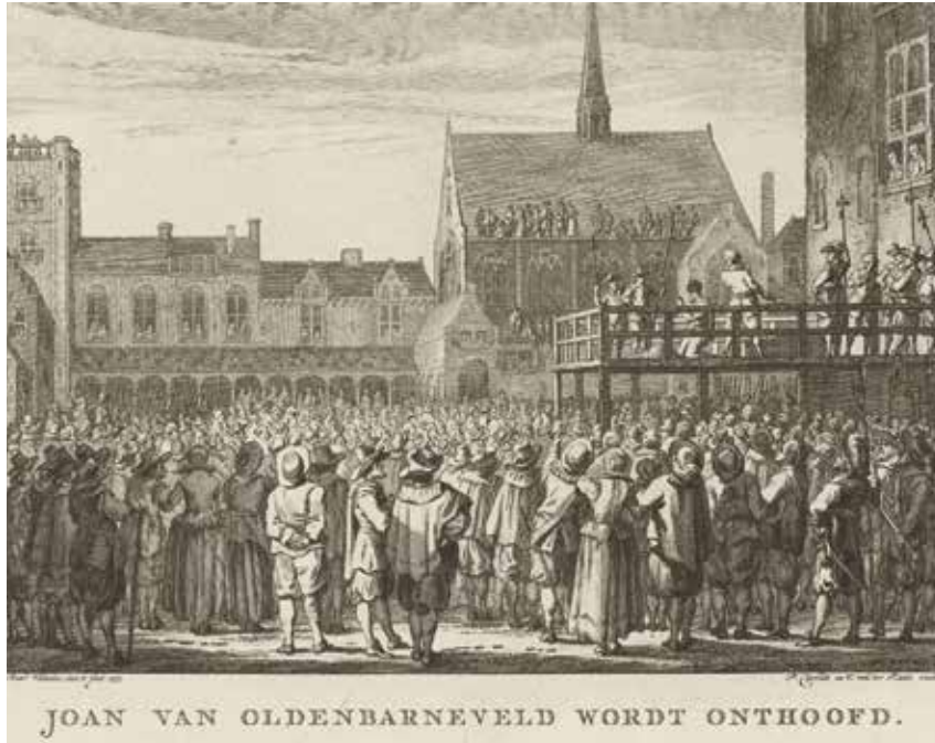
Ets onthoofding raadspensio- naris Johan van Oldenbarnevelt in 1619 op het Binnenhof van Den Haag.