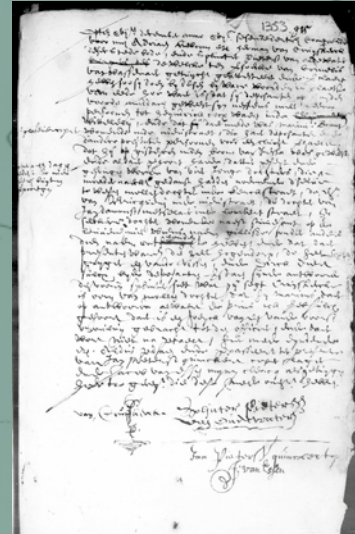
Fragment Gifteboek 1636.