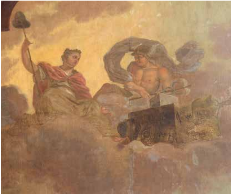
Details plafondstuk Koopmanskamer met Mercurius, Romeinse god van de handel. Hij houdt een caduceus vast, een gevleugelde staf met twee slangen. Op één van de kisten - no. 6 - is het VOC-logo te zien.