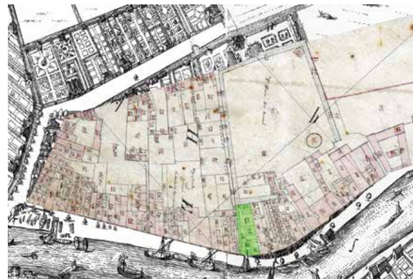
Kaart Johannes de Vou (ca.1694). In het groen de aanduiding van het perceel Koopmanshuizen vanuit de Kadasterkaart.