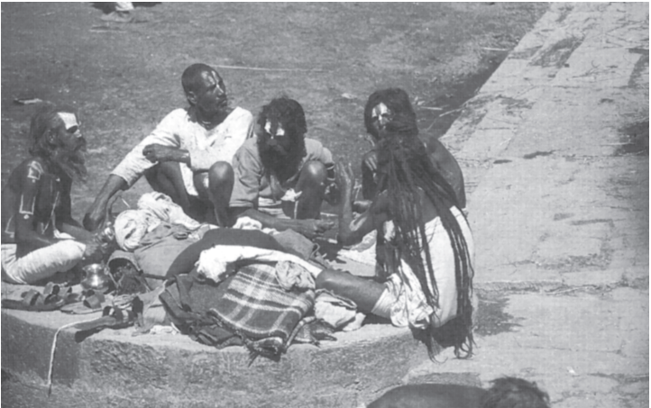
Yogi's in Pashupatinath (Nepal).

Enkele eeuwen voor de geboorte van de Boeddha, ongeveer in de achtste eeuw v. Chr., ontstond er een wezenlijke verandering in het hindoeïstische denken. Van een geloof in een aantal goden die door offers en rituelen ertoe gebracht konden worden wensen te vervullen werd het een beweging die als doel had het goddelijke in jezelf te zoeken, het brahma . Dat is de absolute, goddelijke kracht, die overal in het universum aanwezig is, en dus ook in het individu. Dit brahma werd gezocht door middel van ascese, inkeer. In principe kan iedereen dat bereiken, maar in de praktijk bleef de 'gewone man' eenvoudig het orthodoxe hindoeïstische geloof en zijn eigen godheid aanbidden. Zoals in zovele godsdiensten was alleen een kleine groep denkers bezig met deze vernieuwing: overal in India moeten personen rondgezworven hebben die zich los wilden maken van het wereldlijke en door middel van ascese en meditatie, teruggetrokken in de wildernis, de verlossing probeerden te vinden.