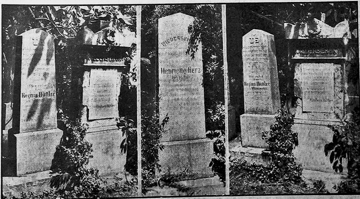
Die Gräber der Hitler auf dem Zentralfriedhof (israelitische Abteilung)

lichkeit erscheinenden Pressen auch alle möglichen dummdrehten, von Unwissenheit und planmäßiger Entstellung streuenden Artikel veröffentlicht. Wir reagieren auf diese kindischen Wutausfälle nicht weiter. Interessant ist bloß, daß die Naal die Verbindung der Judenfamilie Hitler mit Wien und Oesterreich unweilsen. Der nachstehende Bericht, in dem der Nachweis für die