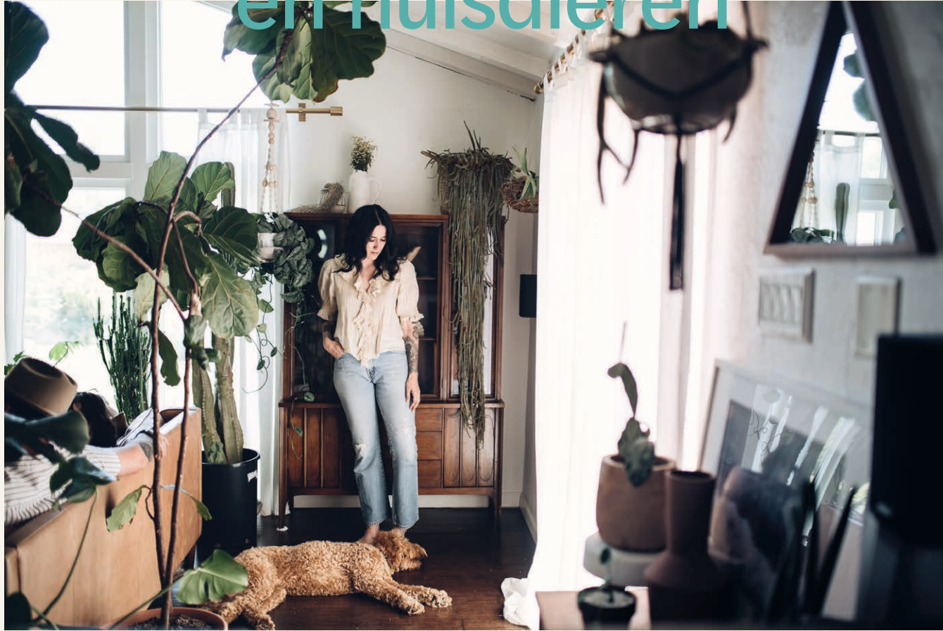
Als je geluk hebt, zijn jouw huisdieren helemaal niet geïnteresseerd in planten, zoals Lemon.

Wat een huis tot een thuis maakt, zijn de levende wezens waarmee je jezelf omringt – je partner (die misschien geen bal om je planten geeft maar stiekem geniet van het kalmerende effect van al dat groen in huis), je kinderen (die jou vast graag helpen met water geven) of je huisgenoten of vrienden (die regelmatig om een stukje bedelen als ze pizza komen eten). En wat dacht je van je harige vriendjes? Katten en honden zijn een belangrijk onderdeel van veel huishoudens en dragen bij aan de dynamiek van een (t)huis. Zo hebben ze hun eigen favoriete plekken om te slapen en te spelen. Ze willen graag op vaste tijden eten, of liever nog de hele dag door. En soms gaan ze zelf eten zoeken en nemen een hap uit je planten! Help! Dat is waar het interessant wordt: succesvol samenleven met planten en dieren kan een hele uitdaging zijn, maar er is geen reden waarom ze niet naast elkaar kunnen leven. Het vraagt alleen wat geduld, tact, soms een compromis, en enkele handige tips & tricks om iedereen in huis een veilig, gelukkig en gezond leven te kunnen laten leiden.