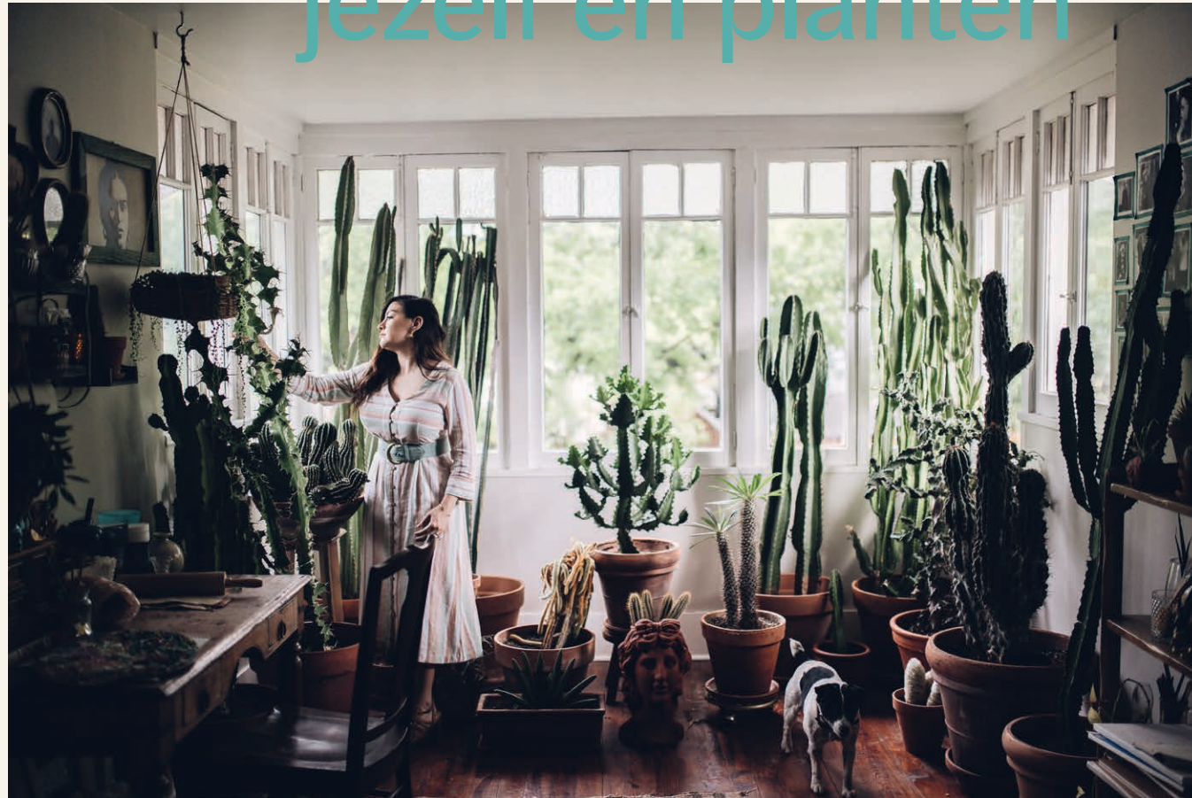
Planten hebben licht, water en grond nodig – maar ook onze aanwezigheid.

Hoeveel liefde en aandacht jij aan jezelf geeft, is cruciaal voor je relatie met kamerplanten – en voor je relaties met andere wezens en zaken in je leven. Meer liefde en aandacht voor jezelf zal je emotionele band versterken met je planten en het begin markeren van een lange, bloeiende, groene relatie.