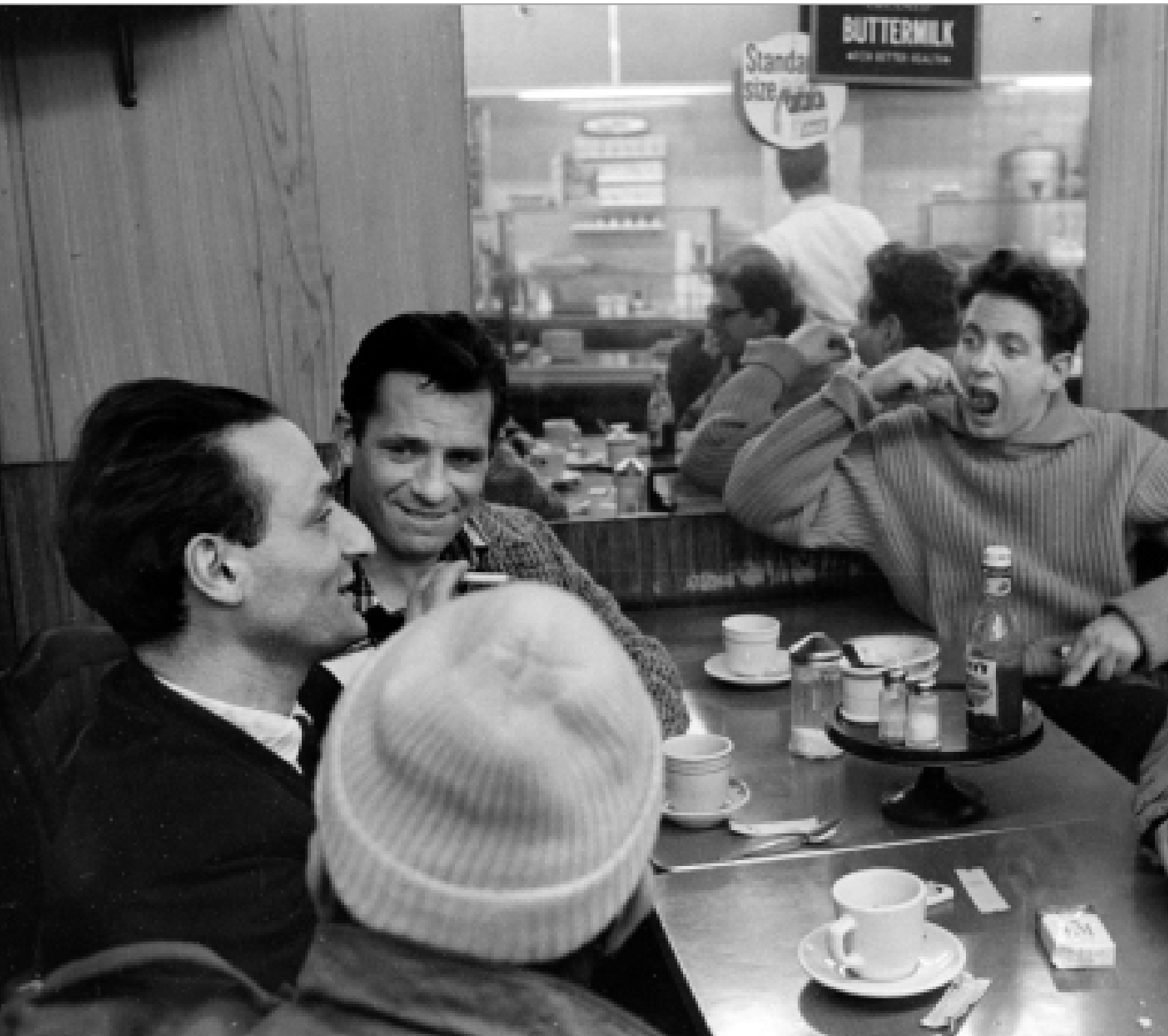
BOVEN: EEN AANTAL KUNSTENAARS VAN DE BEATGENERATION IN EEN RESTAURANT. VAN LINKS NAAR RECHTS: DE DICHTER GREGORY CORSO, MET MUTS (1930–2001), DE SCHILDER EN MUZIKANT LARRY RIVERS (1923–2002), DE SCHRIJVER JACK KEROUAC (1922–1967), DE MUZIKANT DAVID AMRAM (1930) EN DE DICHTER ALLEN GINSBERG (1926–1997).