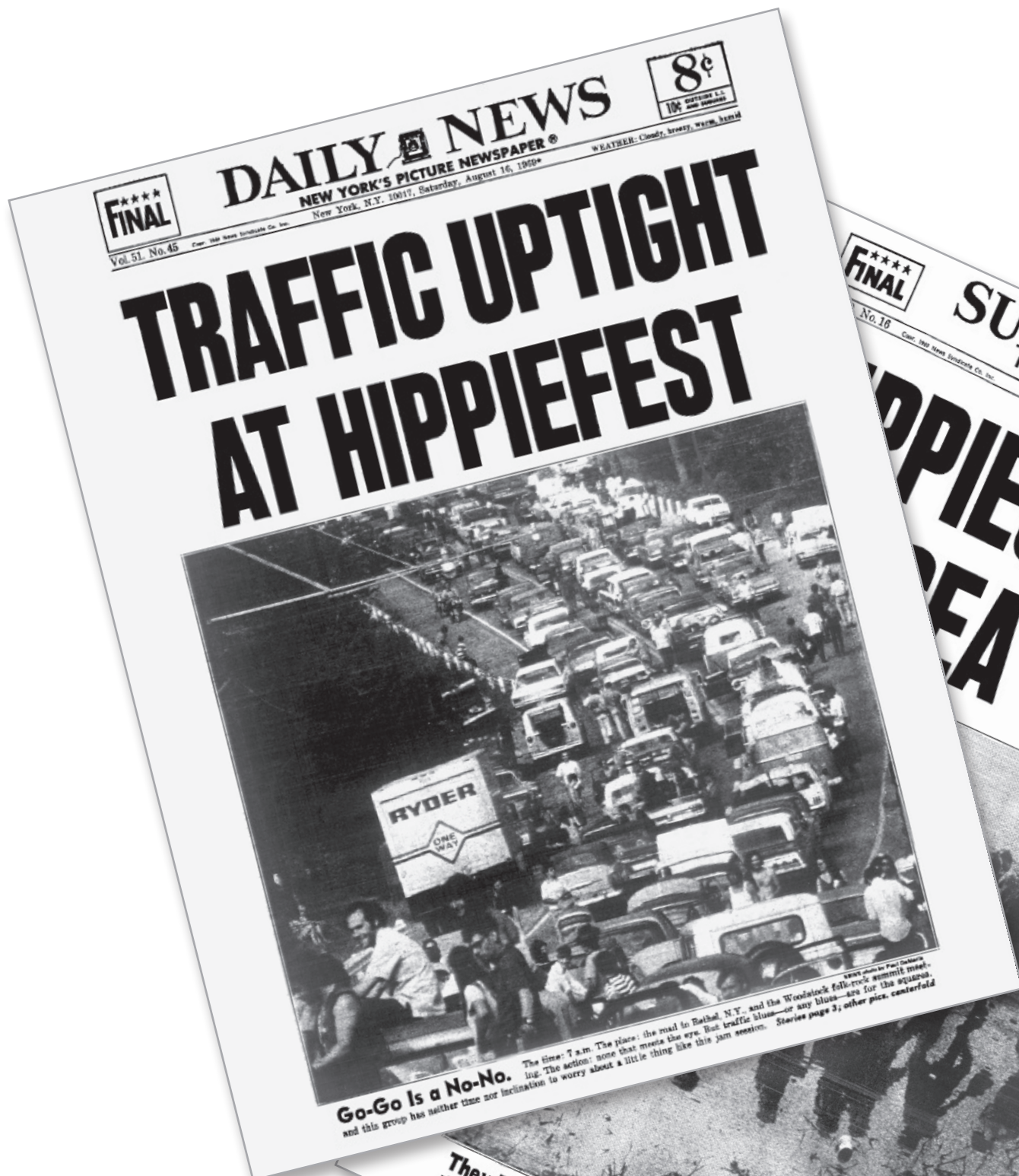
Go-Go Is a No-No. The time: 7 a.m. The place: the road to Bethel, N.Y., and the Woodstock folk-rock summit meeting. The action: none that meets the eye. But traffic blues—or any blues—are for the squares. and this group has neither time nor inclination to worry about a little thing like this jam session. Stories page 3; other pics, centerfold