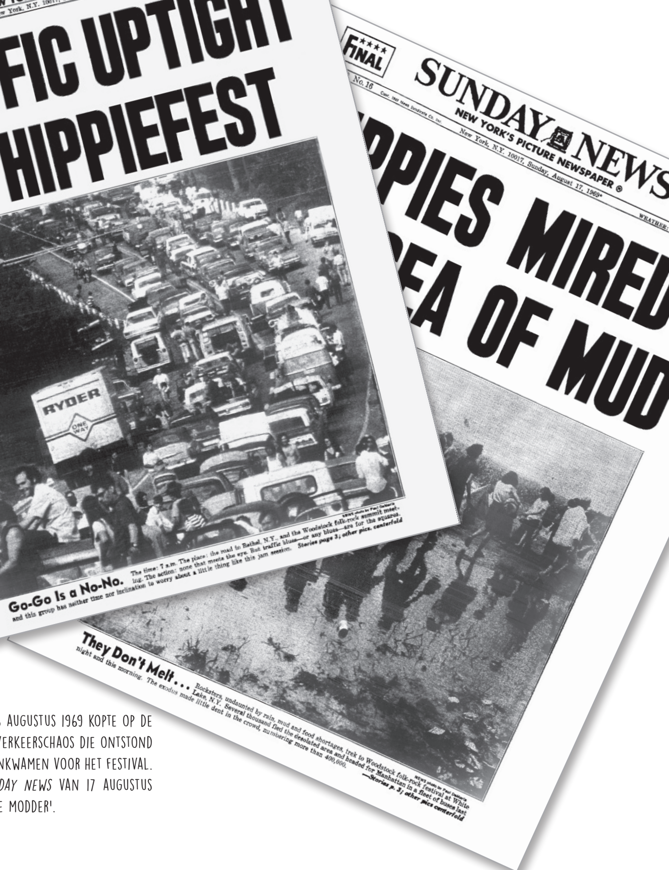
They Don't Melt... Rocksters, undaunted by rain, mud and food shortages, trek to Woodstock folk-rock festival at White Lake, N.Y. Several thousand fled the desolated area and headed for Manhattan in a fleet of buses last night and this morning. The exodus made little dent in the crowd, numbering more than 400,000. News photo in front feature; other photos in front feature; other pics centerfold

BOVEN: DE DAILY NEWS VAN 16 AUGUSTUS 1969 KOPTTE OP DE VOORPAGINA MET DE ENORME VERKEERSCHAOS DIE ONTSTOND TOEN JONGEREN IN BETHEL AANKWAMEN VOOR HET FESTIVAL. DE VOORPAGINA VAN DE SUNDAY NEWS VAN 17 AUGUSTUS 1969 TOONDE DE 'HIPPIES IN DE MODDER'.