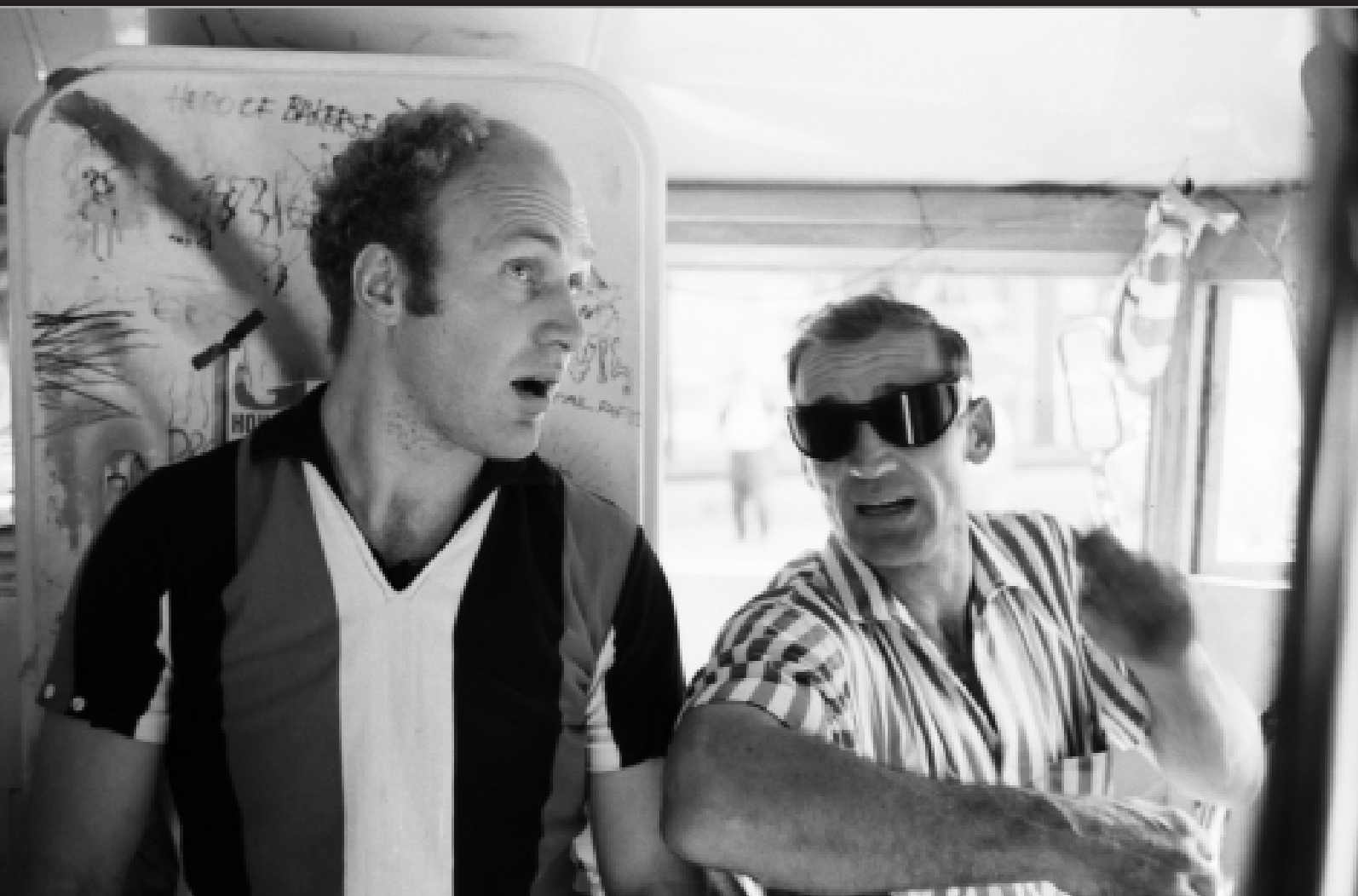
BOVEN: DE SCHRIJVER KEN KESEY EN DE LEGENDARISCHE NEAL CASSADY, DIE WERD VEREEUWIGD IN KEROUACS ON TE ROAD . ZE VOEREN EEN GESPREK IN 'FURTHER', DE BUS VAN DE MERRY PRANKSTERS, BIJ HUN AANKOMST IN NEW YORK TIJDENS 'DE TRIP' VAN 1964.

men in combinatie met de pure lol die Brian Wilson en zijn broers begin jaren zestig introduceerden. Zij brachten onder andere rock-'n-roll en doowop samen in een opwindende, puberale vorm die 'surf' werd genoemd.