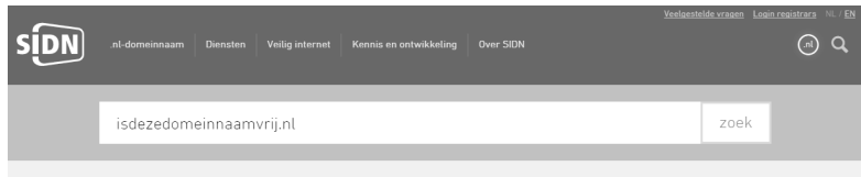
Afbeelding 1.3 De site van SIDN is handig om te controleren of de domeinnaam van uw voorkeur nog vrij is.

U kunt ook kiezen voor een domeinnaam waarin meteen duidelijk wordt wat u verkoopt. Stel dat u groene lampen wilt gaan verkopen? Leg dan de domeinnaam www.groenelampen.nl vast. Een domeinnaam die meteen duidelijk maakt wat u verkoopt, helpt ook bij de vindbaarheid via zoekmachines. De zoekopdracht groene lampen zal al snel uitkomen bij groenelampen.nl.