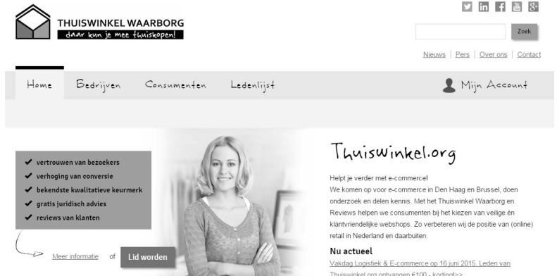
Afbeelding 1.5 Thuiswinkel Waarborg is de belangenbehartiger voor webwinkels in Nederland. Jaarlijks organiseert de organisatie de Thuiswinkel Awards voor beste webwinkels.

gaat u de webwinkel onder de aandacht brengen? Denk daarbij aan free publicity, nieuwsbrieven, blogs, social media en de ‘ouderwetse’ vormen van reclame.