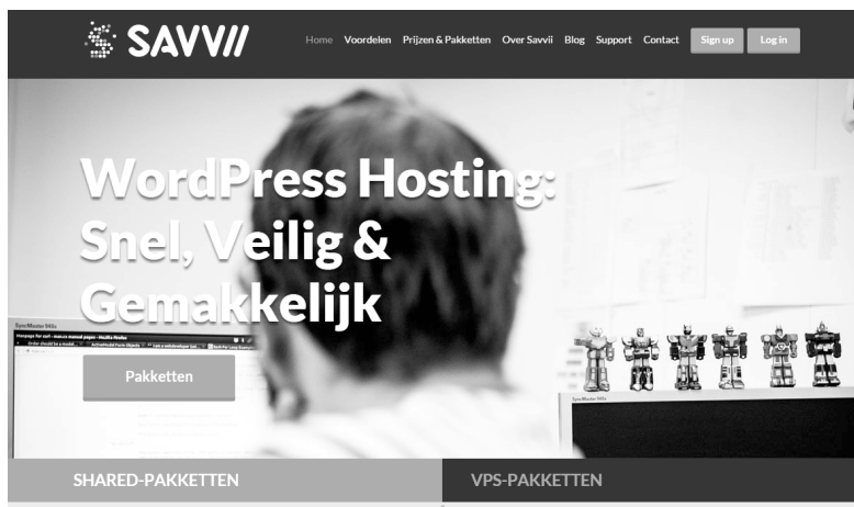
Afbeelding 1.2 Savvii is een voorbeeld van een in WordPress gespecialiseerd, Nederlands hostingbedrijf.

Sommige webhostingbedrijven zijn gespecialiseerd in WordPress. Zeker als uw bedrijf afhankelijk is van de website, is het aan te raden met zo'n bedrijf in zee te gaan. Deze hostingbedrijven zorgen ervoor dat uw WordPress-installatie altijd up-to-date is en regelen ook een geautomatiseerde back-up. Omdat het specialisten zijn in WordPress, kunnen ze ook betere support leveren.