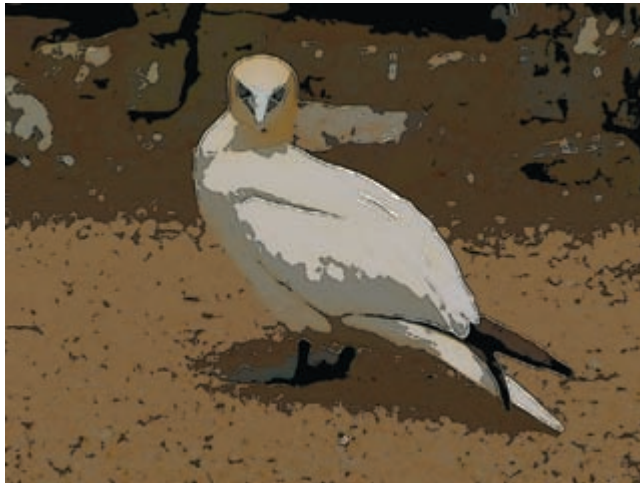
Afbeelding 1.5 Iets is niet altijd wat het lijkt. Dit lijkt op een lijntekening, maar het is een bitmapfoto waarop het effect Posterranden is toegepast.

Nadelen zijn er ook, waarvan gebrek aan fotorealisme de belangrijkste is. Voorts moet men voor het tekenen van illustraties een zeker talent bezitten. Vectorafbeeldingen zijn vooral geschikt voor relatief eenvoudige schematische plaatjes, bijvoorbeeld logo's of verkeersborden. Afbeeldingen zonder duidelijke contouren zoals vlekken en littekens op een huid, een wilde haardos, een onregelmatig patroon in de iris van een oog, een dreigende wolkenhemel enzovoort, zijn bijna niet in vectoren te vangen. Het is dan ook verbazingwekkend hoezeer sommige vectorafbeeldingen de werkelijkheid kunnen benaderen, maar uiteindelijk blijft het niet meer dan dat: een benadering.