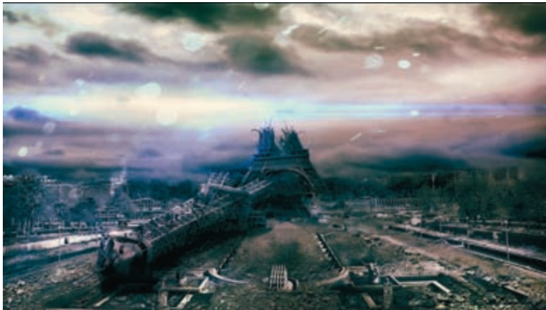
Afbeelding 1.2 Met Photoshop kunt u veilig experimenteren.

Daarnaast is het nuttig de eigen hardware kritisch onder de loep te nemen. Voor professionals zal het probleem niet snel spelen, maar bij veel andere gebruikers draait Photoshop op computers die ooit zijn aangeschaft met het oog op administratieve taken. En dat is niet ideaal. Meestal is het niet al te ingewikkeld het werkgeheugen uit te breiden (voor Photoshop is 4 tot 6 GB ideaal). Lastiger is het om de processor te vervangen omdat moederboard en koeling hierop moeten zijn afgestemd. Staat u voor een nieuwe aanschaf, dan zijn snelle processors als de Intel i5 of i7 goede keuzen. Tot slot kan ook een grafische kaart met veel werkgeheugen (minstens 1 GB) goed van pas komen. CS6 heeft een nieuwe 'motor', de Mercury graphics engine, en deze doet nog meer een beroep op de grafische processor van de videokaart (GPU). Met name het opnieuw naar het scherm tekenen van de afbeelding na het toepassen van visuele wijzigingen wordt zo veel mogelijk uitbesteed. Dat kan in- en uitzoomen zijn, maar ook het previewen van allerlei effecten en het manipuleren en renderen van 3D-objecten in de Extended-versie. De om de nieuwe engine van dienst te kunnen zijn moet de kaart wel aan bepaalde eisen te voldoen: ondersteuning van OpenGL 2.0 en Shader model 3.0 of hoger.