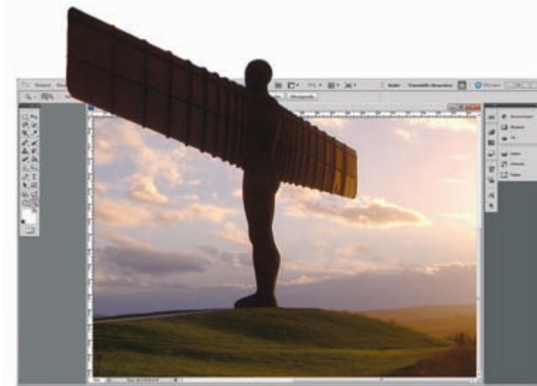
Afbeelding 1.7 Hoewel de Extended edition over 3D-functionaliteit beschikt, zijn er natuurlijk grenzen aan de mogelijkheden van Photoshop.

Een tweede rode draad, vooral van belang van professionals, is efficiëntie, zoals het automatiseren van opdrachten en het opslaan van gereedschapsinstellingen en sneltoetsen. Deze taken staan ten dienste van een hoge productiviteit, van belang voor degenen die grote hoeveelheden afbeeldingen moeten verwerken.