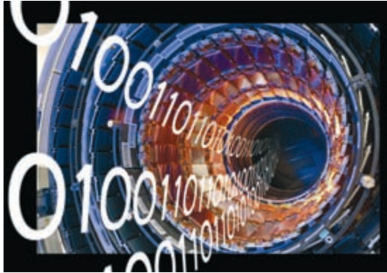
Afbeelding 1.1 Voor een computer bestaat een afbeelding uit slechts nullen en enen.