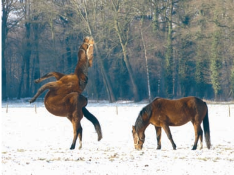
Afbeelding 1.9 CS6 biedt veel mogelijkheden op het gebied van vervorming.