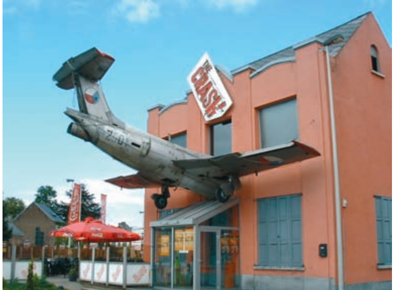
Afbeelding 1.10 Voor een maffe foto hebt u niet per se Photoshop nodig.