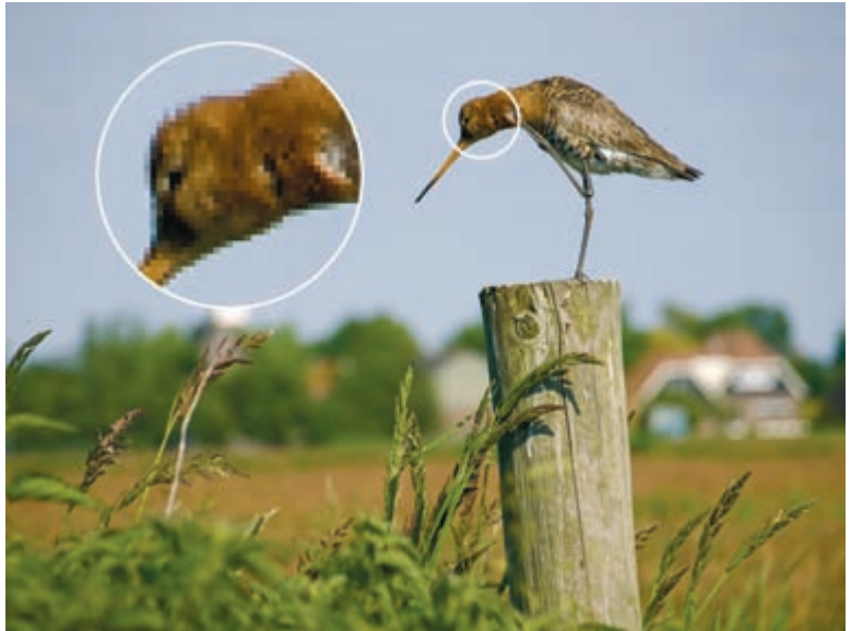
Afbeelding 1.3 Ingezoomd kunnen we bij een bitmapafbeelding de individuele pixels onderscheiden.

Een bitmap is zeer geschikt voor het weergeven van fotorealisme. Ook het eenvoudige berekeningsprincipe (gewoon pixelwaarden) wordt gezien als een sterk punt. Complexe vectorafbeeldingen kunnen nog wel eens verstrikt raken in de eigen formules. Een ander voordeel is dat we op bitmaps fantastische effecten kunnen loslaten, simpelweg door andere pixelwaarden te laten berekenen, zie hoofdstuk 13.