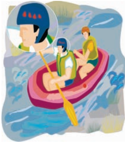
Afbeelding 1.4 Een vectorafbeelding ziet eruit als een tekening: een lijnenspel met kleurvlakken. De lijnen blijven scherp, ongeacht hoe sterk de afbeelding wordt uitgegroot, maar erg realistisch is deze niet.

Vectorafbeeldingen zijn lijntekeningen, gemaakt door teken- en illustratieprogramma's, zoals CorelDRAW en Adobe Illustrator en worden ook wel illustraties genoemd. Vectoren zijn voor gedefinieerde lijnsegmenten met vaste vormen, afmetingen en richtingen. Door meerdere segmenten te combineren worden objecten geconstrueerd zoals cirkels, driehoeken, vierkanten, maar ook alle mogelijke combinaties daarvan zoals sterren, tekstballonnetjes en veel grilliger vormen zoals gebouwen of personen. Kenmerkend voor vectorafbeeldingen is dat ze niet beschreven worden door pixelwaarden maar door wiskundige formules. Natuurlijk is een grillige kronkellijn moeilijker in een formule te vangen dan een simpele rechte lijn, maar het principe is hetzelfde. Voor vectorprogramma's zijn afbeeldingen dus op de eerste plaats een lijnenspel. De vormen die ermee worden getekend, kunnen worden opgevuld met een effen kleur, een verloopkleur of een transparante kleur.