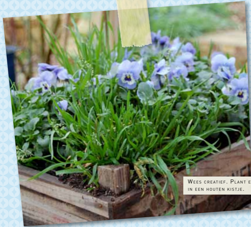
WEES CREATIEF. PLANT EETBARE VIOOLTJES IN EEN HOUTEN KISTJE.