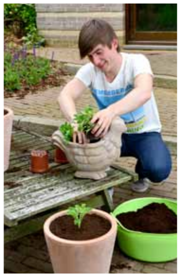
POTSCHERVEN ZORGEN VOOR EEN GOEDE DRAINAGE IN JE POT.

Een stenen pot oogt mooi, heeft de eigenschap duurzaam te zijn en is – met uitzondering van de invloed van hevige vorst – tijdloos. Bedenk wel dat je een breuk hebt eenmaal de pot gevuld is met aarde. Handig is het niet, en al helemaal niet als je rugklachten hebt. Door gebruik te maken van een plateau op wieltjes verlicht je het werk en verplaatst je de potten