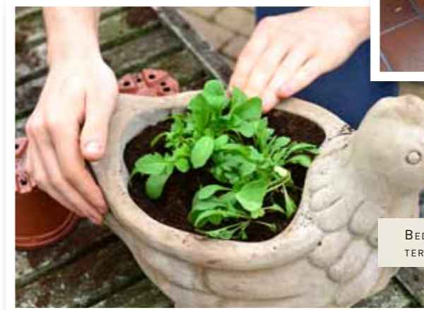
BEDENK DE GEKSTE COMBINATIES OM VAN JOUW TERRAS OF BALKON EEN SMULTUIN TE MAKEN.