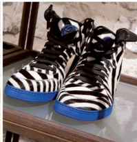
LIKUS CONCEPT STORE

⑫ Reusachtige paddenstoelen, bosaardbeien, eigengemaakte honing, gerookte kaasjes en tientallen worstsoorten. Op de dagelijkse Stary Kleparz -markt vinden Krakauers sinds de 17e eeuw alles wat ze nodig hebben om te koken. Veel producten komen uit omliggende streken en hebben een uitstekende kwaliteit. rynek kleparski, www.starykleparz.com , telefoon 12 6341532, open ma-vr 6.00-18.00, za 6.00-16.00, zo 8.00-15.00, tram 7 8, 19 basztowa lot