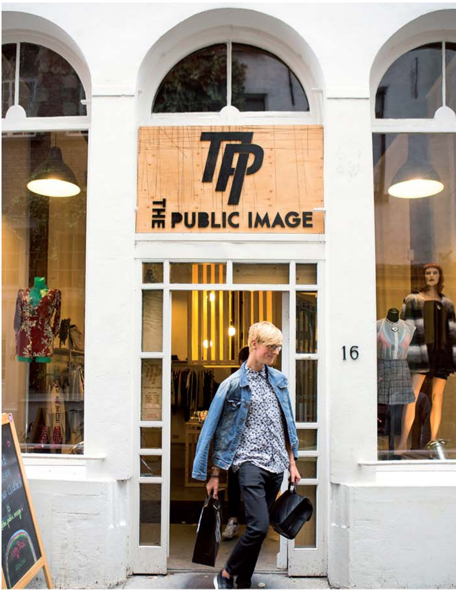
17 THE PUBLIC IMAGE