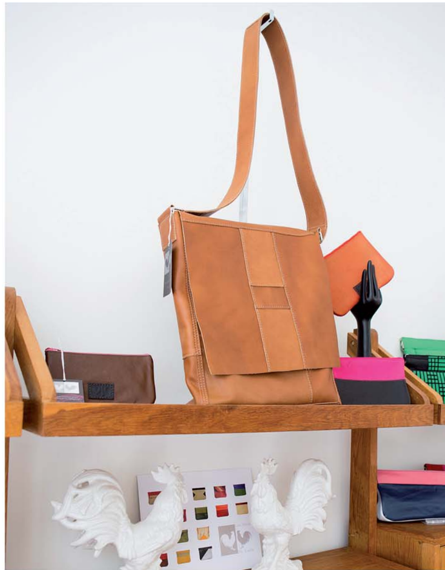
LES DEUX DE COCK 33

34 De Vagant is een begrip in jeneverland. In het café kun je van meer dan tweehonderd jenevers proeven. In de slijterij zijn meer dan vierhonderd verschillende jenevers, fruitjenevers en likeuren te koop. Het ruime aanbod miniatuurflesjes biedt een oplossing voor als je niet kunt kiezen. reyndersstraat 25, www.devagant.be, telefoon 03 2342137, open ma & wo-za 11.00-18.00, tram 3 of 15 groenplaats