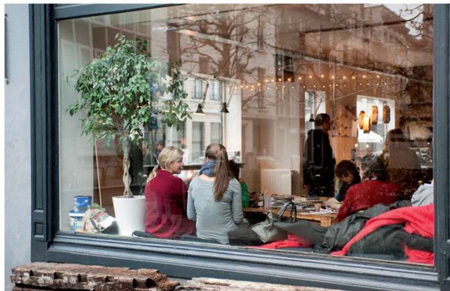
NORMO COFFEE ⑦

hendrick conscienceplein 14, check facebook: lojala, telefoon 0477 668825, open wo-za 10.30-18.00, zo 11.30-18.00, prijs € 10, tram 10 of 11 melkmarkt/ tram 7 keizerstraat