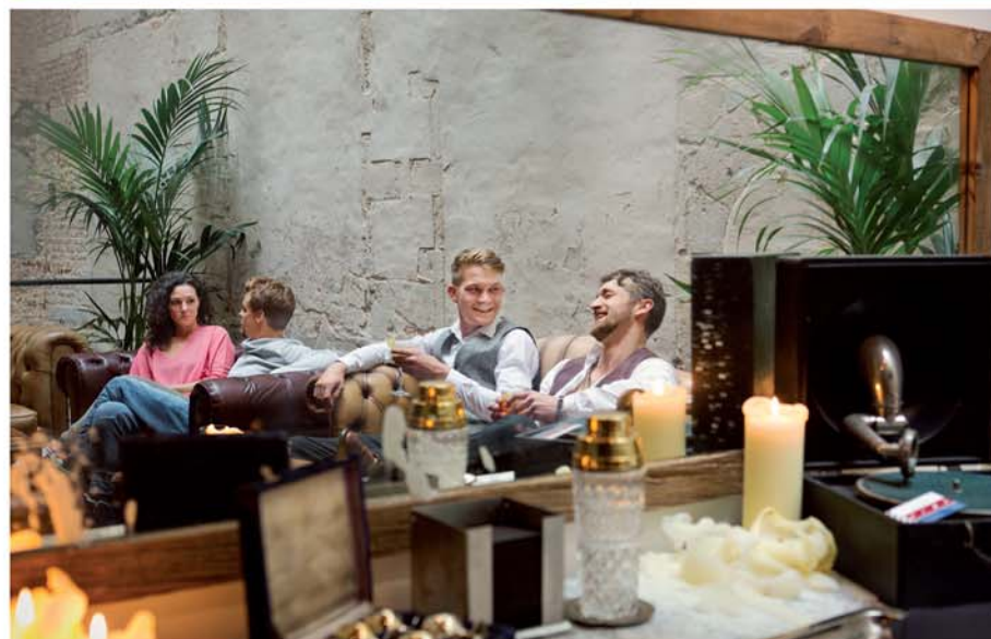
DOGMA COCKTAILS 18

36 Als je bij een Chinees restaurant nog altijd denkt aan nummertjes en heel veel rijst, dan móét je gaan dineren bij Lam & Yin . Het interieur is strak en stijlvol en ook de kaart blinkt uit in soberheid, met vijf voor- en hoofdgerechten. Gastvrouw Yin is hartelijk en chef-kok Lam bereidt de heerlijkste gerechten. Hun inspanningen werden in 2010 beloond met een Michelinster. En het is daarmee ook het eerste Chinese restaurant in Antwerpen met een ster. reyndersstraat 17, www.lam-en-yin.be , telefoon 03 2328838, open wo-zo 18.00-22.00, prijs € 30, tram 2 of 15 groenplaats