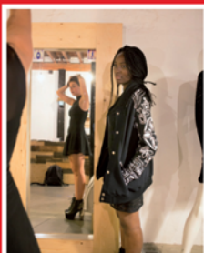
The Public Image

Terug in de tijd naar het middeleeuwse Antwerpen.