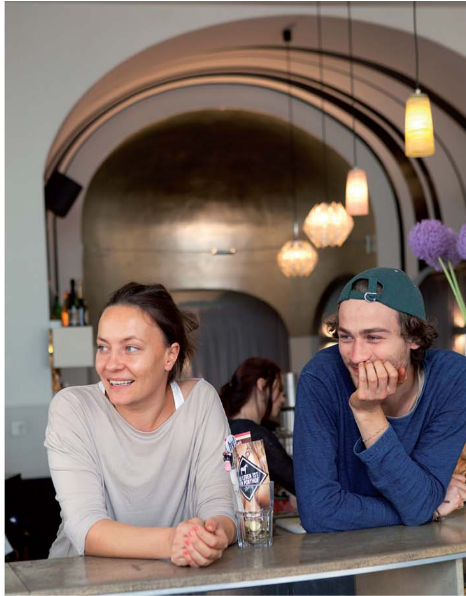
SANKT OBERHOLZ 7

33 De Ehemalige Jüdische Mädchenschule heeft een woelige historie. Het pand was compleet vervallen, maar nu is het opgeknapt en kun je er eten. Pauly Saal is een toprestaurant dat herinnert aan de jaren 20. Bij Mogg & Melzer, aan de andere kant, eet je Joodse delicatessen als pastrami sandwich en matseballensoep. Ook in het pand: galeries en Museum the Kennedys . auguststraße 11-13, www.maedchenschule.org , zie website voor tijden en prijzen, u-bahn u6 oranienburger tor, s-bahn oranienburger straÙe